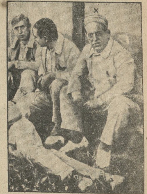
B. generał i minister hiszpański, monarchista Sanjurjo jako więzień polityczny.

Przy imieninach, zaręczynach, ślubach i jubileuszowych i innych uroczystościach używajcie tylko telegramów T. G. L.