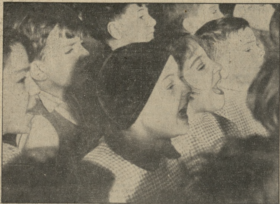
Dzieci z przytulku francuskiego biorą udział w przedstawieniu teatralnym. Młyny ich są zaisle rozkoszne.

344. „Ror“. Mimo że jest 5-letniemięcznem niemowlęciem, potrafi pisać, wobec czego charakter określam. Silna wola w swych zamiarach uparty, sceptyk, sprytny, lubi życie ruchliwe, kapryśny, lubi się ławic, lecz bez strat materjalnych. Drugich denieruje, lecz bez rlościwości, dyplomata, dyskretny, ekonomista.