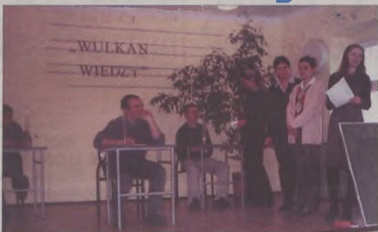
Trzecia runda konkursu

Drugi etap konkursu składał się z sześciu rund podczas których uczniowie musieli m.in. ułożyć z podanego wyrazu hasło związane