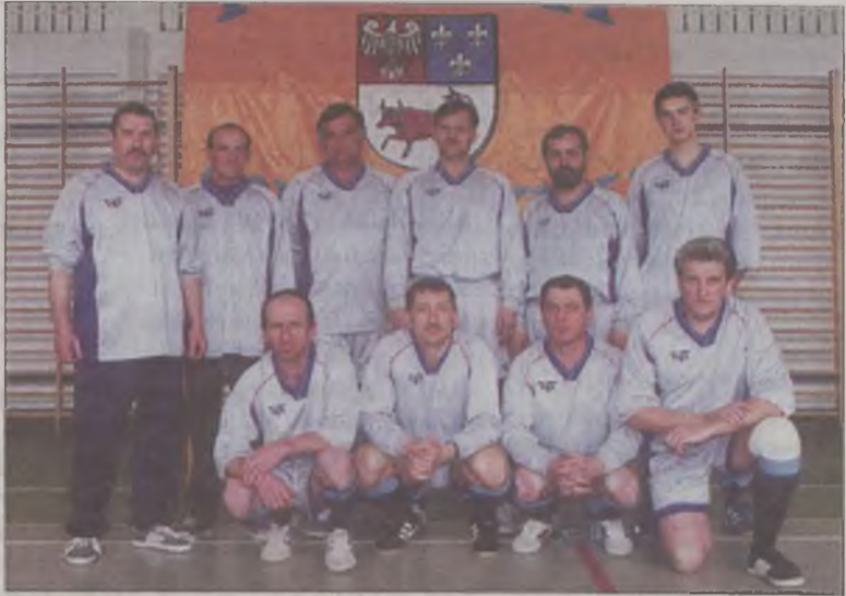
O sukcesie zespołu z Władysławowa zdecydowała prawdopodobnie najdłuższa ławka rezerwowych i najliczniejszy skład

W pierwszym meczu półfinałowym doszło do sporej niespodzianki, bowiem gospodarze turnieju, zespół Przykony po serii rzutów karnych wyeliminowali faworyzowaną drużynę z gminy Turek. Drugi półfinał bez historii i gład-