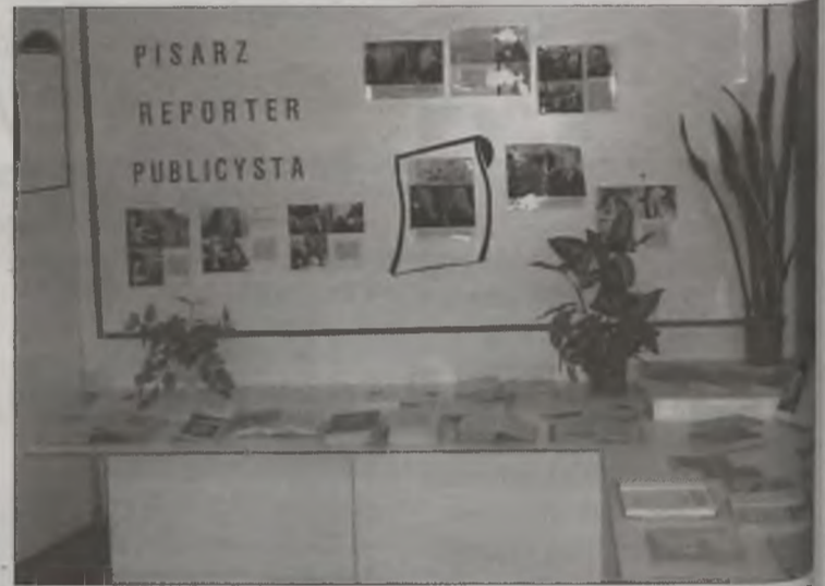
Jeszcze tylko przez kilka dni można obejrzeć wystawę poświęconą Melchiorowi Wańkowiczowi.

Na tablicach pojawią się sylwetki aktorów, którzy w roku 1957 urodzili się bądź zmarli. Wystawa podzielona będzie na dwie części. W jednej z nich zobaczący będzie można wielkich aktorów sceny polskiej. Nie zabraknie więc informacji i fotografii Czesława Wołej-