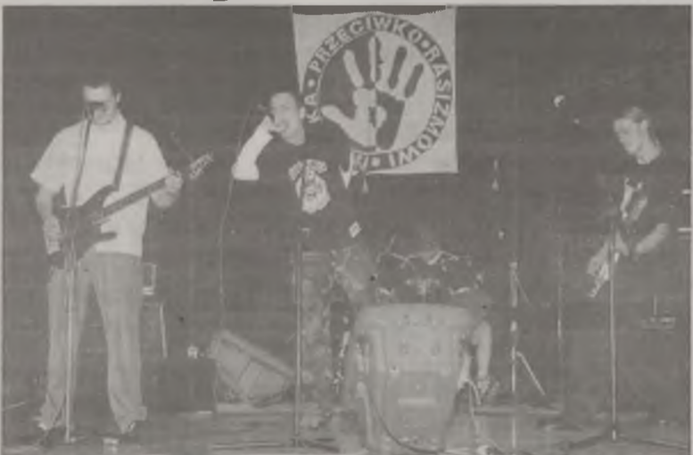
W Miejskim Domu Kultury odbył się koncert rockowy „Muzyka przeciwko rasizmowi”. Na scenie wystąpiły zespoły z Konina: Presh-runk, Punishment, Tension Rises oraz Alians z Pily. Miłośnicy twardego rocka z pewnością byli zadowoleni.