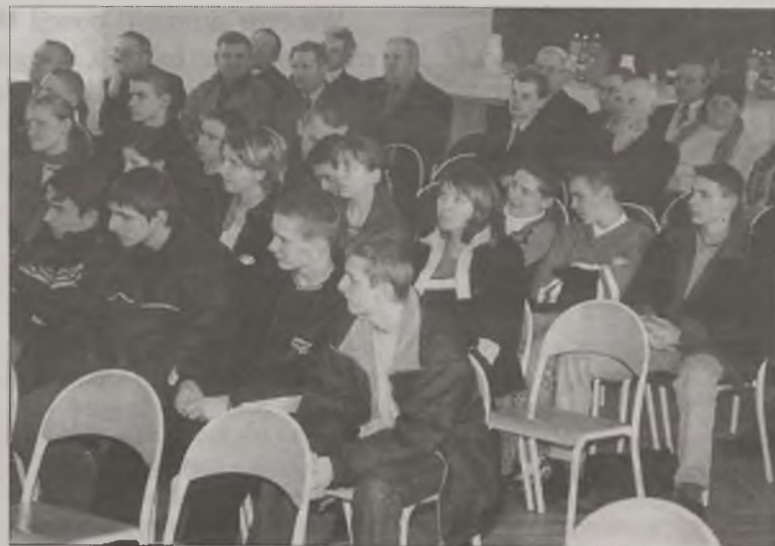
W Forum wzięła udział również młodzież