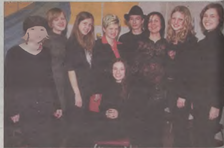
Poetka (w środku) z nauczycielkami i przyjaciółmi