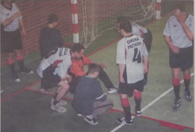
Samorządowcy z Przykony wydają się być zmartwieni faktem zdobycia „tylko” drugiego miejsca. Ale przecież grało ich w sumie raptem siedmiu. Tylko na obiedzie i liście zgłoszeń było ich ponoć więcej niż na parkiecie. Ale nie wiadomo czy to prawda