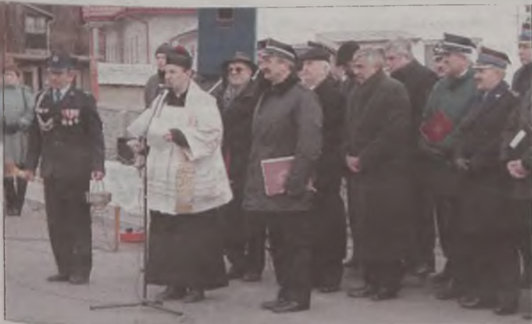
Obchody 95-lecia rozpoczęły się licznymi przemówieniami

Uroczystości na tuliskowskim placu poprzedziła narada w Komendzie Powiatowej Państwowej Straży Pożarnej w Turku. Wzięli w niej udział przedstawiciele miasta, powiatu, PSP i OSP oraz parlamentarzyści. Podsumowano realizację działań za rok 2001 i przedstawiono kierunki działań KP PSP na 2002 rok. Strażackie piątkowe urodziny zakończyły się poczęstunkiem. Z powodu tak dostojnego jubileuszu kapelan udzielił dyspensy na ich... skosztowanie. ach