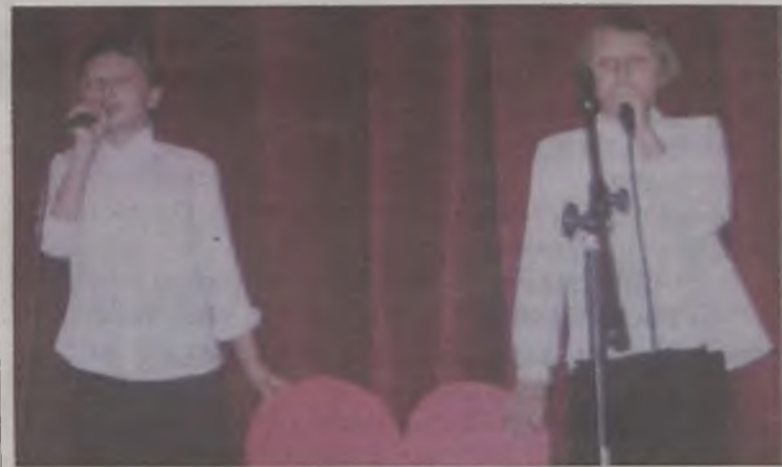
Uczennice klasy V i VI w piosence o tematyce zdrowotnej