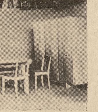
Całość wykonana w dębie lub jesionie i utrzymana w kolorze naturalnym, odznacza się prostotą linii i pomysłowością konstrukcji.