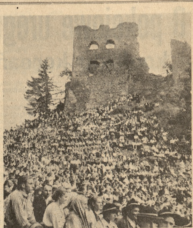
Dnia 24 czerwca 1951 r. odbyła się w Czorsztynie uroczysta akademia, poświęcona pamięci bohaterów chłopskiego powstania sprzed 300 lat. Ponad 8-tysięczna rzesza górali w barwnych strojach regionalnych zgromadziła się na wzgórzu Czorsztyńskim, obok historycznych ruin zamku, skąd w czerwcu 1651 roku przywódca powstania chłopskiego Koska - Napierski rozesał po wsiach wici, wzywając chłopów do walki z pańszczyźnianym uciskiem szlachty i magnaterii polskiej. Przybycie na akademię przedstawicieli budowniczych Nowej Huty, górników kopalń śląskich i podkrakowskich oraz delegacji licznych zakładów pracy, przerodziło się w wielką manifestację na rzecz sojuszu robotniczo - chłopskiego. — Na zdjęciu: fragment uroczystości.