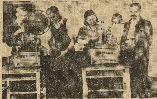
Kandydat na kinomechaników kin wiejskich stałych przy ćwiczeniach praktycznych — w czasie kursu w poznańskim Zakładzie Doskonalenia Rzemiosła. — Pierwszy z prawej: wyróżniony repatriant z Buga, pierwszy z lewej: starosta kursu.

Kto w Polsce przedwzrusznie marzył o tym, by na wsi wyświetlano filmy i to nie w kinach objazdowych, ale w stałe funkcjonujących na miejscu? Takich wiejskich kin stałych jest już dzisiaj w Polsce prawie dwie setki — a do