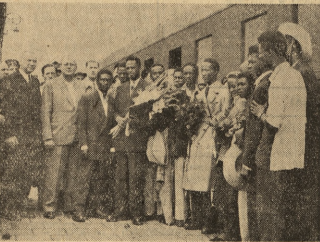
Do Warszawy przybył 17-osobowy murzyński zespół wokально-taneczny, który wystąpi we wszystkich większych miastach Polski. Na zdjęciu: zespół murzyński na dworcu w Warszawie