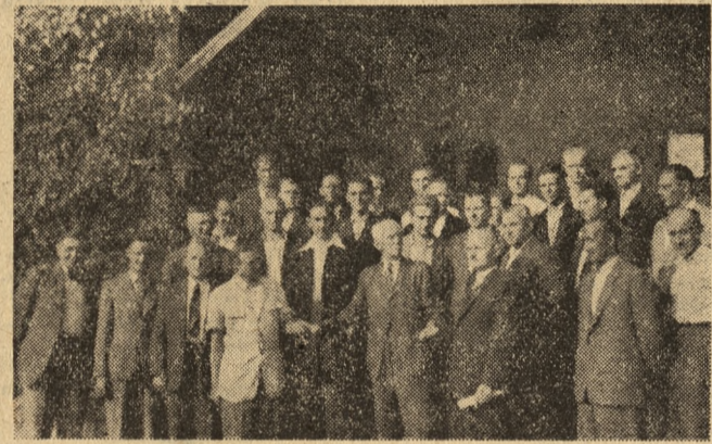
Mistrz Solski w otoczeniu śpiewaków ostrzeszowskich po koncercie w Morawinie

Powszechne świadczenta miast i wsi na S.F.O.S. umacniają sojusz robotniczo-chłopski.