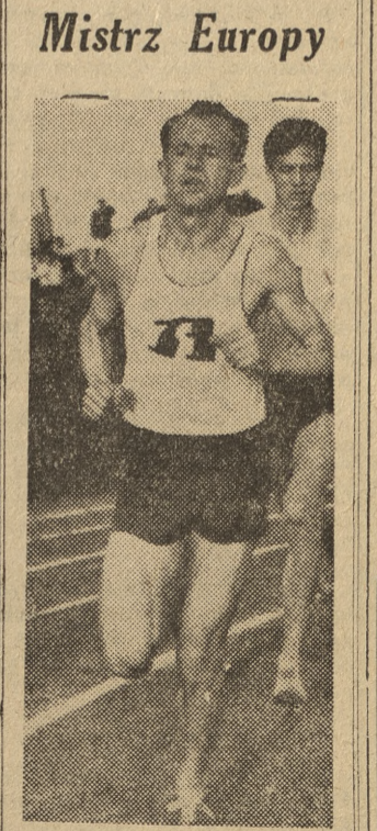
Mistrz Europy Jak było do przewidzenia, mistrzostwo Europy w biegu na 10 tys. m zdobył Emil Zatopek (Czechosłowacja). Obszerne sprawozdanie z pierwszego dnia mistrzostw na str. 4.

20 sierpnia kontrtorpedowiec amerykański nr 726 usiłował ostrzeliwać pewną miejscowość położoną na wschodnim wybrzeżu Korei Północnej na południe od Namhynaru. W wyniku skoncentrowanego ognia artylerii nadbrzeżnej Armii Ludowej okręt został trafiony 27 pociskami. 3 działa wielkiego kalibru, 2 małego kalibru, maszyny, kominy i środkowa część kontrtorpedowca zostały zniszczone. Znaczna część załogi poległa. Płonący kontrtorpedowiec amerykański wycofał się na południe z szybkością zaledwie 7 węzłów i według wiadomości otrzymanych od mieszkańców wybrzeża, zatonął po silnym wybuchu.