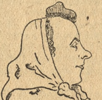
Skrzypczak-Helena robotnica pracuje 20 lat

W kłębach pary zakurzone szmaty po 24-godzinnej dezynfekcji przechodzą do trzepaków i po wypraniu schną w piecach.