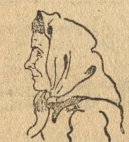
Chmielewska Stanisława robotnica 25 lat pracy

W kłębach pary zakurzone szmaty po 24-godzinnej dezynfekcji przechodzą do trzepaków i po wypraniu schną w piecach.