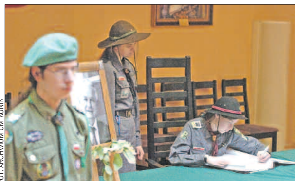
12 kwietnia – kolejne wpisy do księgi kondolencyjnej wyłożonej w konińskim ratuszu.