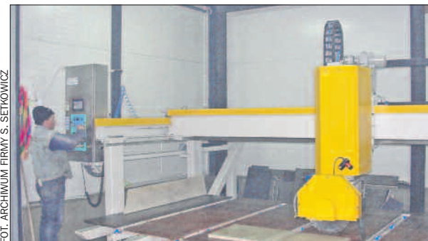
Maszyny zakupione dzięki dotacji z WRPO charakteryzują się precyzją cięcia i dużą wydajnością.