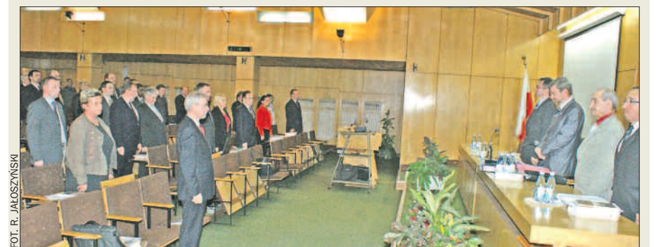
Radni sejmiku rozpoczęli obrady XLVI sesji, która odbyła się 26 kwietnia, od minuty ciszy. Uczcili w ten sposób pamięć ofiar katastrofy prezydenckiego samolotu pod Smoleńskiem.