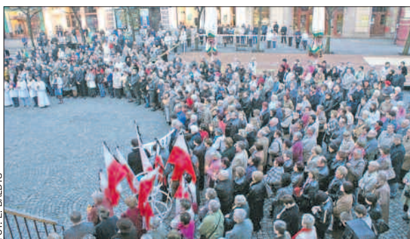
13 kwietnia – uroczystości na leszczyńskim Starym Rynku upamiętniające ofiary zbrodni katyńskiej i smoleńskiej katastrofy.