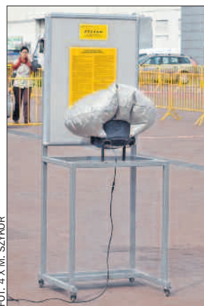
Pokaz działania poduszki powietrznej.