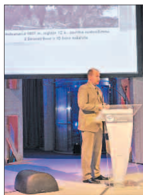
Prezentacja działań na rzecz bezpieczeństwa na drogach podejmowanych przez policję litewską.