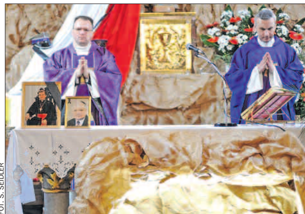
11 kwietnia za ofiary katastrofy modlono się między innymi w poznańskim kościele garnizonowym.

– Sądzę, że ludzie postąpili po prostu racjonalnie. Mając do wyboru oglądanie tego samego na telebimie lub na ekranie telewizora, postawili na to drugie rozwiązanie. W końcu telebim to nie ołtarz. Ci, którzy najbardziej odczuwali potrzebę osobistego uczestniczenia w tych pożegnaniach, wybrali się do Warszawy i Krakowa. Wiadomo, że pojechało tam wielu Wielkopolan. •