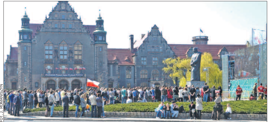
18 kwietnia kilkaset osób zgromadziło się na poznańskim placu Mickiewicza, by na telewizyjnie śledzić uroczystości pogrzebowe pary prezydenckiej.

Marszałek i wojewoda, a wcześniej także prezydent Poznania, pełnili warty honorowe przy trumnach pre-