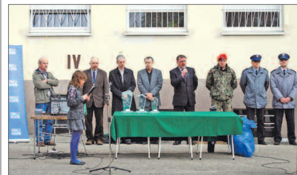
Uroczyste otwarcie zawodów.