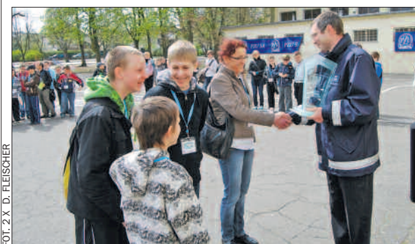
Nagrody dla zwycięzców.