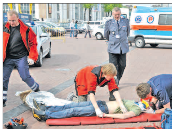
Akcja ratownicza, na zdjęciu ratownicy medyczni i policjanci z WRD KWP w Poznaniu.

poznańska konferencja przyczyni się w znaczący sposób do poprawy bezpieczeństwa ruchu drogowego na drogach