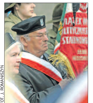
12 kwietnia – minuta ciszy podczas poznańskich uroczystości katyńskich.