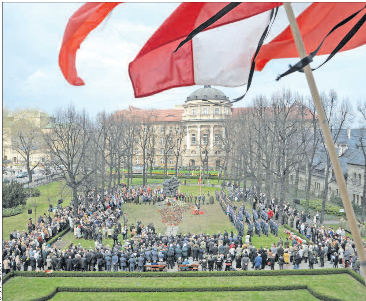
Wielkopolskim obchodom 70. rocznicy zbrodni katyńskiej towarzyszyła też pamięć o tych, którzy zginęli w katastrofie pod Smoleńskiem. Na zdjęciu – uroczystości 12 kwietnia przed poznańskim Pomnikiem Ofiar Katynia i Sybiru.