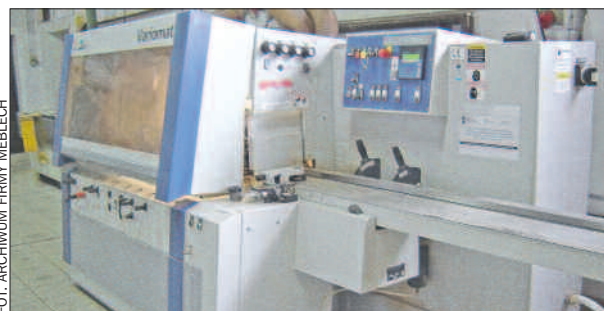
Nowy nabytek firmy: automat strugający i frezujący.

Pan Baś wymienia zalety urządzeń, kupionych dzięki dotacji z UE i podkreśla, że na inwestycji zyska dział badawczo-rozwojowy zakładu. – Automat strugający i frezujący, łączy technologie strugarki czterostronnej i frezarki stacjonarnej i zdobył złoty Medal na Targach Drema 2008. Kabina susząca, dzięki nowoczesnej technologii promieniowania, pozwala szyb-