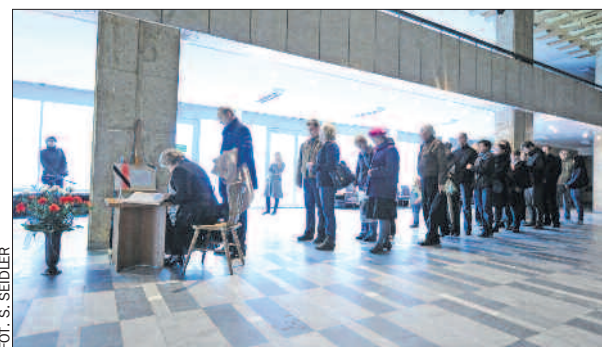
11 kwietnia – poznaniacy stoją w kolejce, by wpisać się do książki kondolencyjnej, wyłożonej w holu Urzędu Wojewódzkiego.