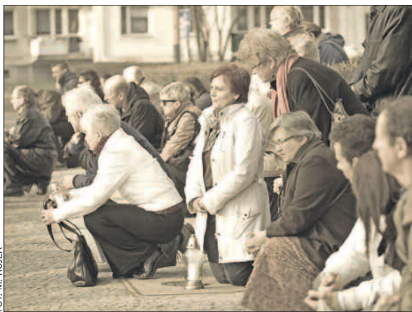
12 kwietnia – msza żałobna na Placu Zwycięstwa w Pile.