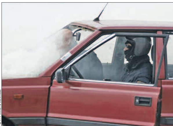
Pokaz ukazujący skuteczność działania pasów bezpieczeństwa w czasie wypadku drogowego.