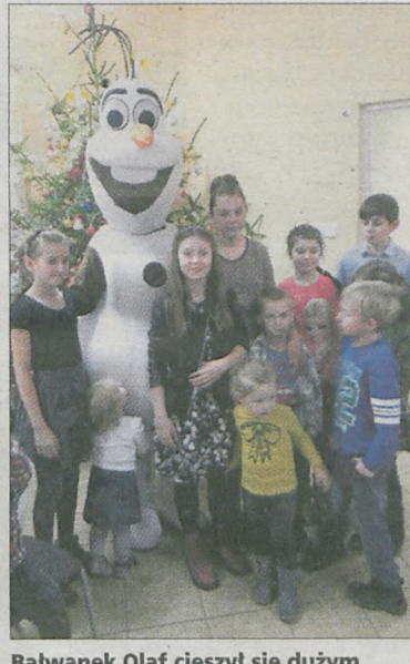
Bałwanek Olaf cieszył się dużym zainteresowaniem dzieci