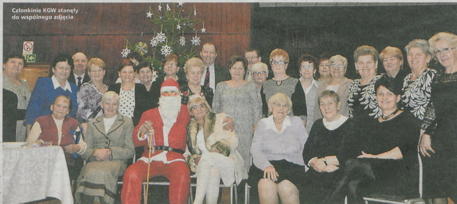
Członkinie KGW stanęły do wspólnego zdjęcia