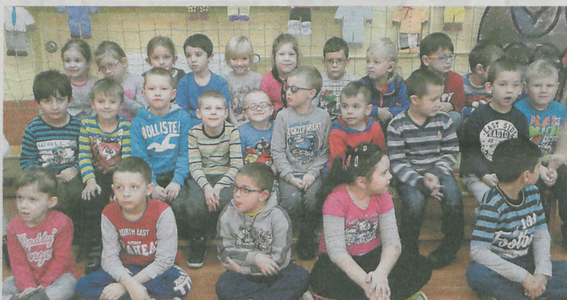
Wspólne malowanie sprawiło dzieciom dużo frajdy. Na zakończenie spotkania maluchy ustawiły się do zdjęcia