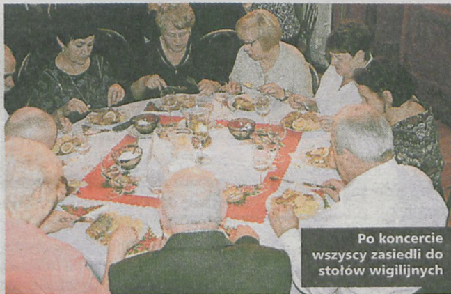
Po koncercie wszyscy zasiedli do stołów wigilijnych