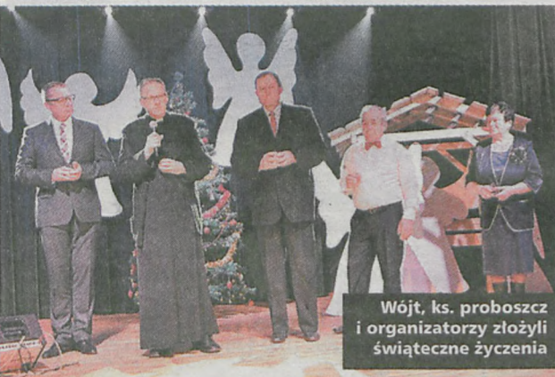
Wójt, ks. proboszcz i organizatorzy złożyli świąteczne życzenia

Jesień, która zaśpiewała kilka kolęd. Po złożeniu życzeń przez władze i organizatorów, można było kupić płyty wokalistki, które rozchodziły się jak ciepłe bułeczki. Następnie wszyscy zasiedli do wspólnej wigilii, a na stołach królowały ryby i świąteczne potrawy. (seb)