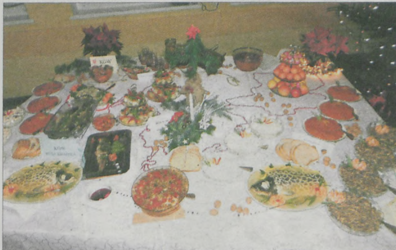
Stół wigilijny z potrawami