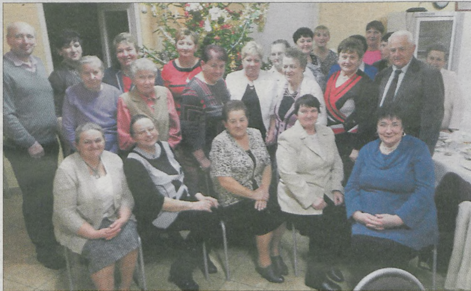
Członkinie KGW w towarzystwie panów ustawiły się do pamiątkowego zdjęcia