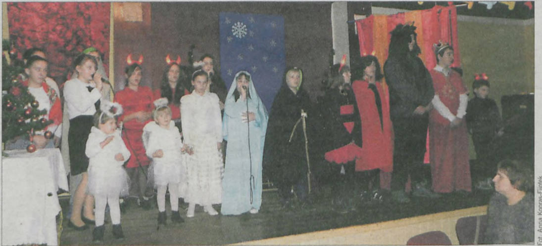
Dzieci występują w jasełkach