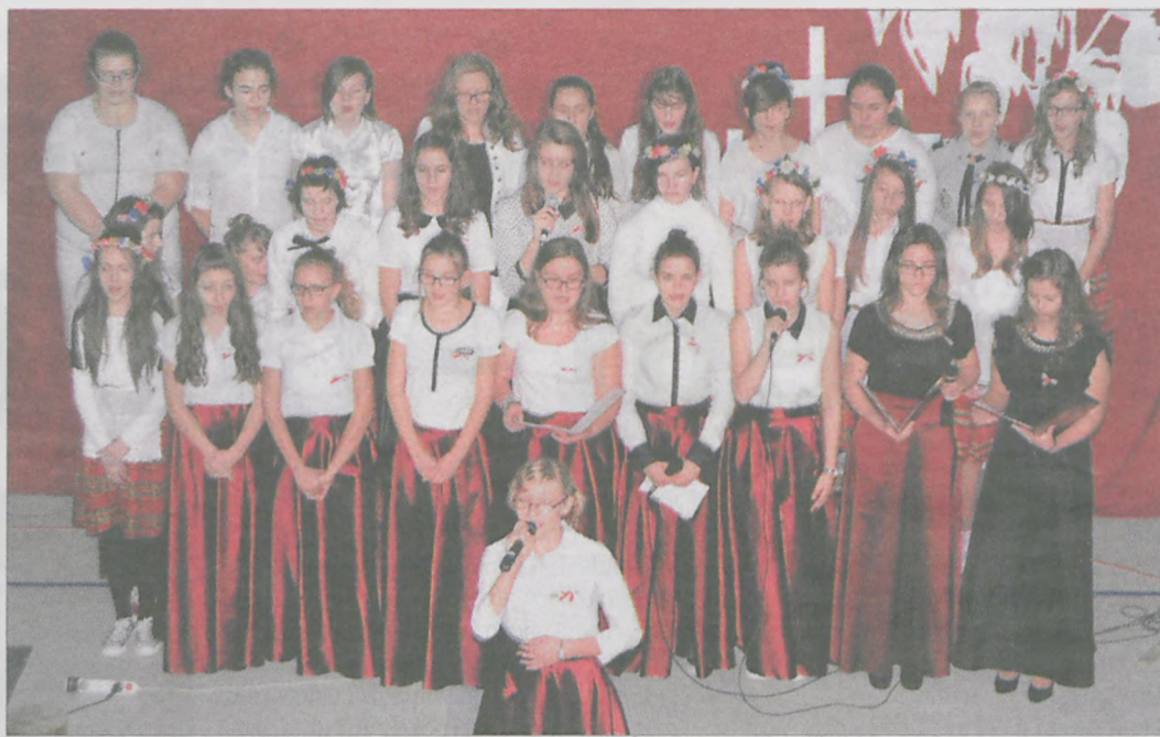
Oprac. (era) W części artystycznej zaprezentowali się uczniowie Gimnazjum z Woli Książęcej

Goście zasiedli przy stołach zastawionych kawą i ciastem. W przygotowaniu przyjęcia pomogły rada rodziców oraz sołecka.