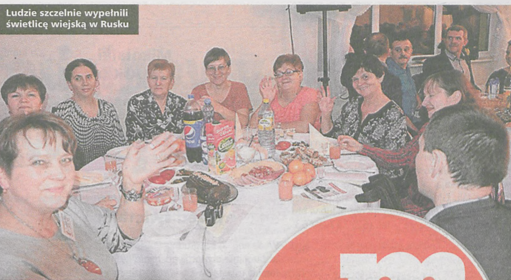
Ludzie szczerze wypełnili świetlicę wiejską w Rusku