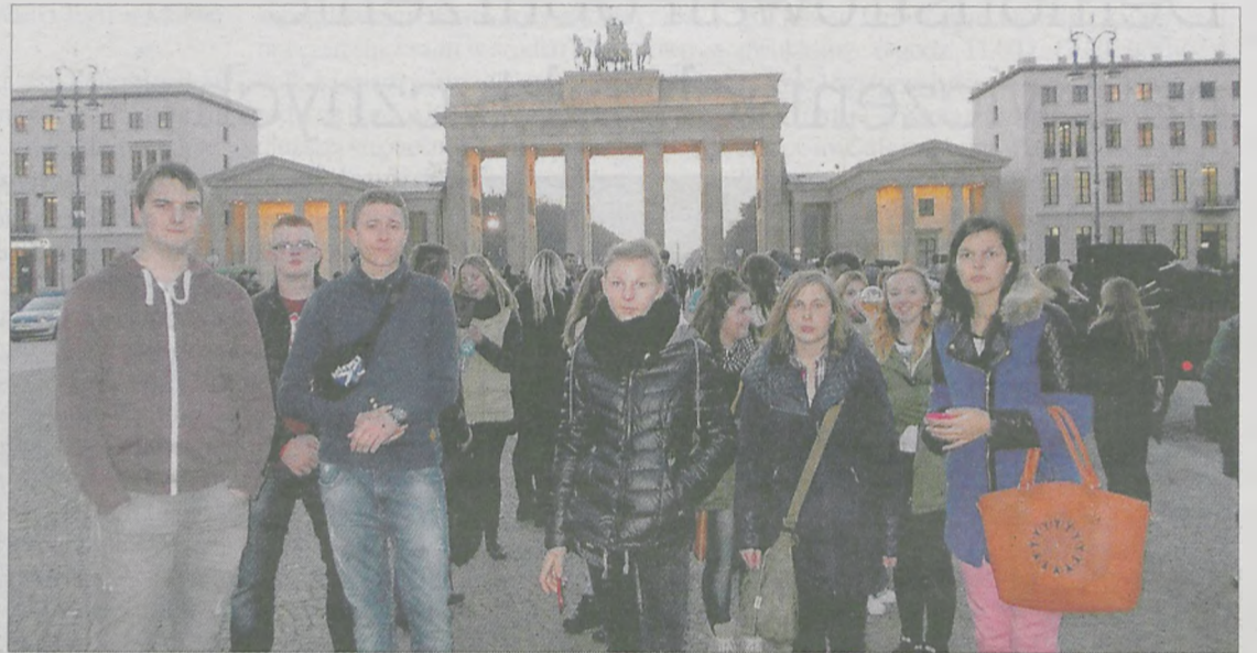
Uczniowie szkoły w Tarcach przed Bramą Brandenburską w Berlinie

► W ramach projektu „Lekcje z ZUS” młodzież Zespołu Szkół Ponadgimnazjalnych nr 2 w Jarocinie zgłębiała wiedzę o ubezpieczeniach społecznych podczas cyklu lekcji dotyczących Zakładu Ubezpieczeń Społecznych. Dowiedzieli się między innymi, czym są ubezpieczenia społeczne, jaka jest rola ZUS-u, jak funkcjonuje system emerytalny w Polsce oraz jakie są zasady rozliczania w przypadku prowadzenia własnej działalności gospodarczej. Uczniowie otrzymali od organizatorów konkursu - ZUS-u oraz Ministerstwa Pracy i Polityki Społecznej - specjalnie opracowane materiały dydaktyczne, z których przygotowywali się do testu wielokrotnego wyboru składającego się z 20 pytań. Swoją wiedzę uzupełniali materiałami znajdującymi się na stronie internetowej projektu.