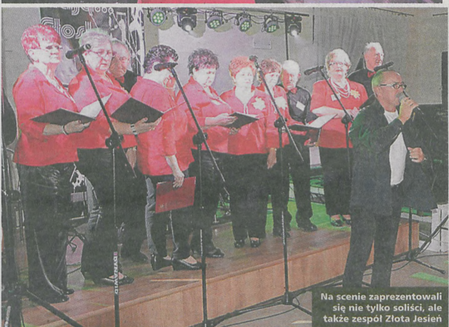
Na scenie zaprezentowali się nie tylko soliści, ale także zespół Złota Jesień