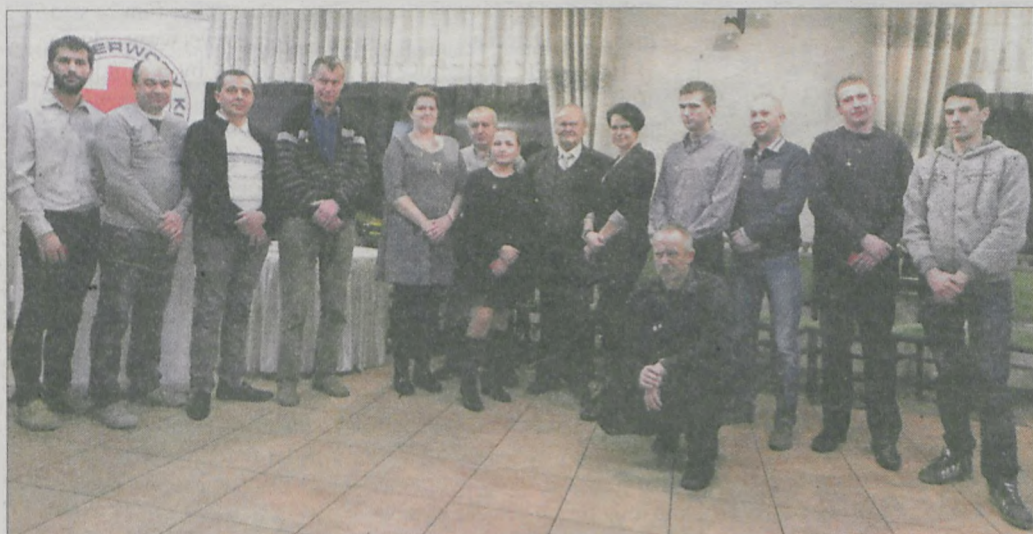
Największą grupę stanowili ci, którzy otrzymali odznaki trzeciego stopnia