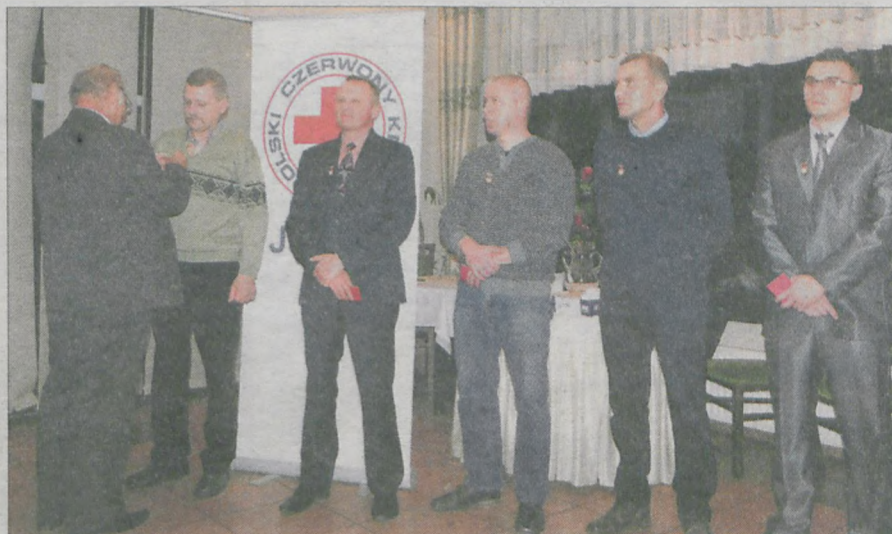
Najwyższym, pierwszym stopniem odznaczenia uhonorowano w tym roku aż dziesięć osób