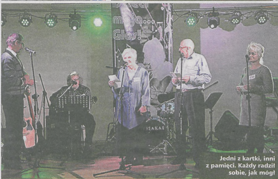
Jedni z kartki, inni z pamięci. Każdy radził sobie, jak mógł