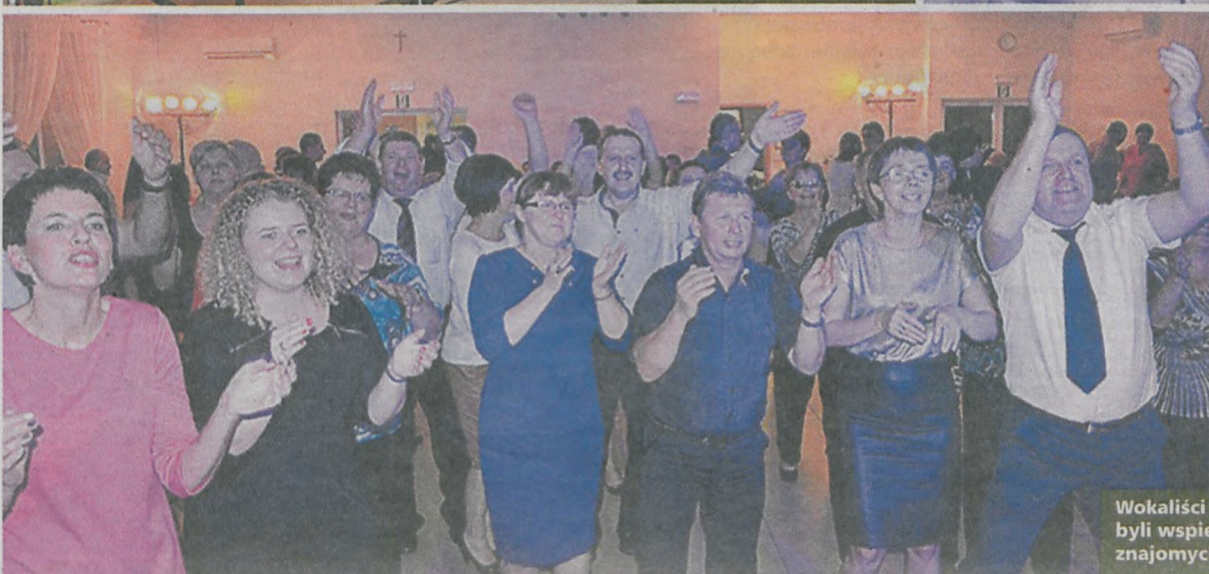
Wokaliści często byli wspierani przez znajomych i rodziny