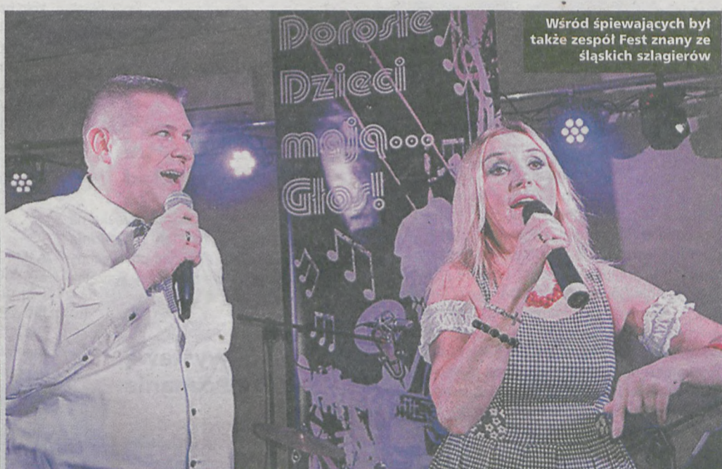
Wśród śpiewających był także zespół Fest znany ze śląskich szlagierów