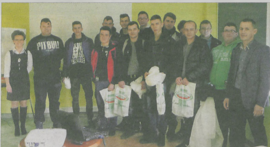
Młodzież ze szkoły w Tarcach odbyła praktyczne zajęcia w firmie Neorol w Chrzanie