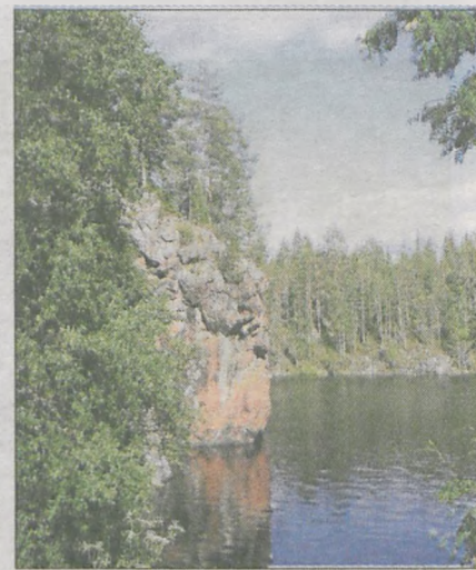
W Parku Narodowym Oulanka (Finlandia) można podziwiać niezwykłą, nieskażoną naturę. „To zdecydowanie najpiękniejsze miejsce jakie dane nam było ujrzeć na fińskiej ziemi” - pisali podróżnicy