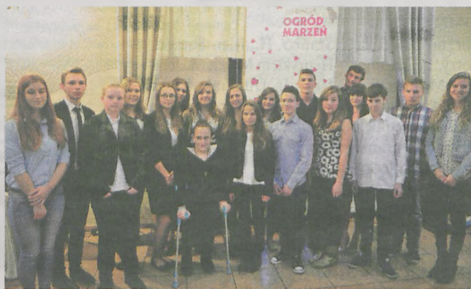
Część pieniędzy z 1% zostanie przekazana na Fundusz Stypendialny „Kuznia Młodych Talentów”. Na zdjęciu ubiegłoroczni stypendyści