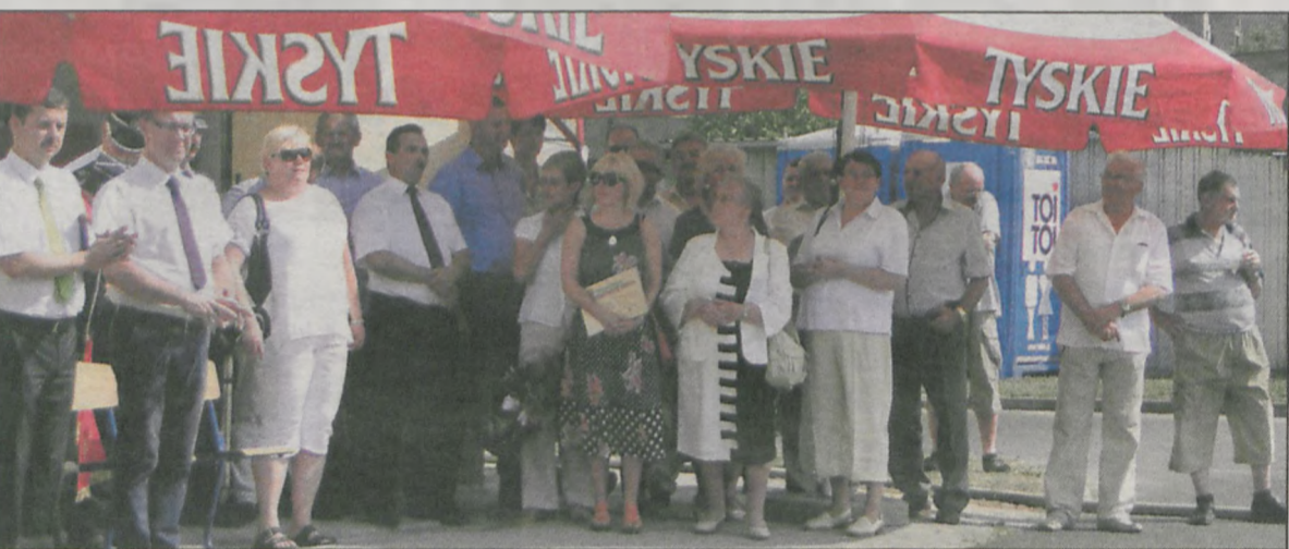
Zaproszeni goście chronili się pod parasolami