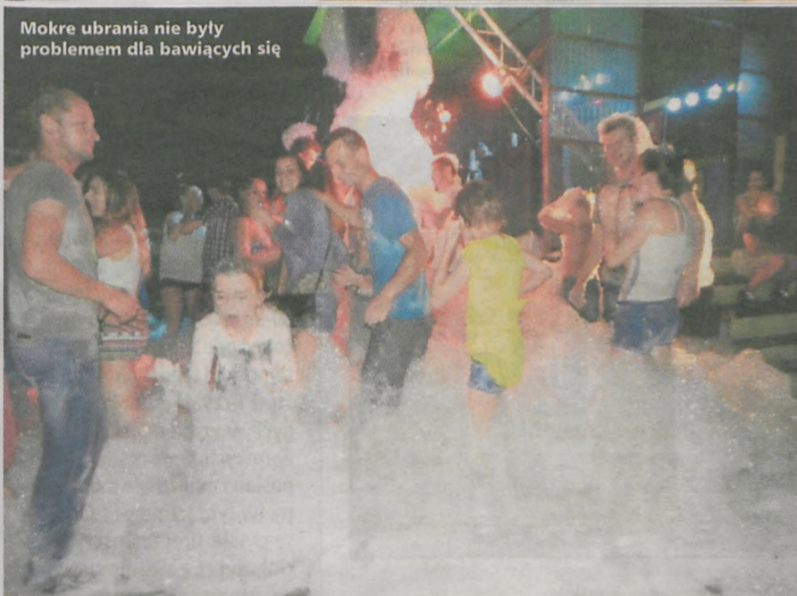
Mokre ubrania nie były problemem dla bawiących się