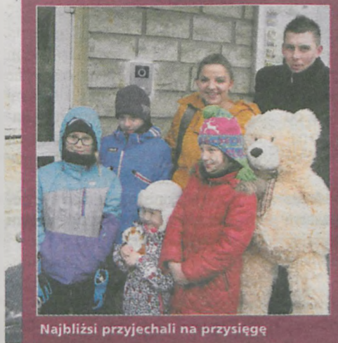
Najbliżsi przyjechali na przysięgę