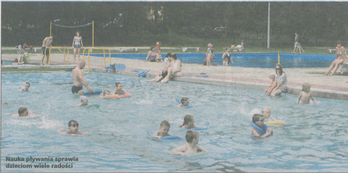
Nauka pływania sprawia dzieciom wiele radości