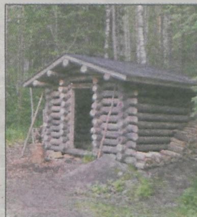
W takich drewnianych domkach mogą znaleźć schronienie turyści przebywający w Parku Narodowym Koli w Finlandii