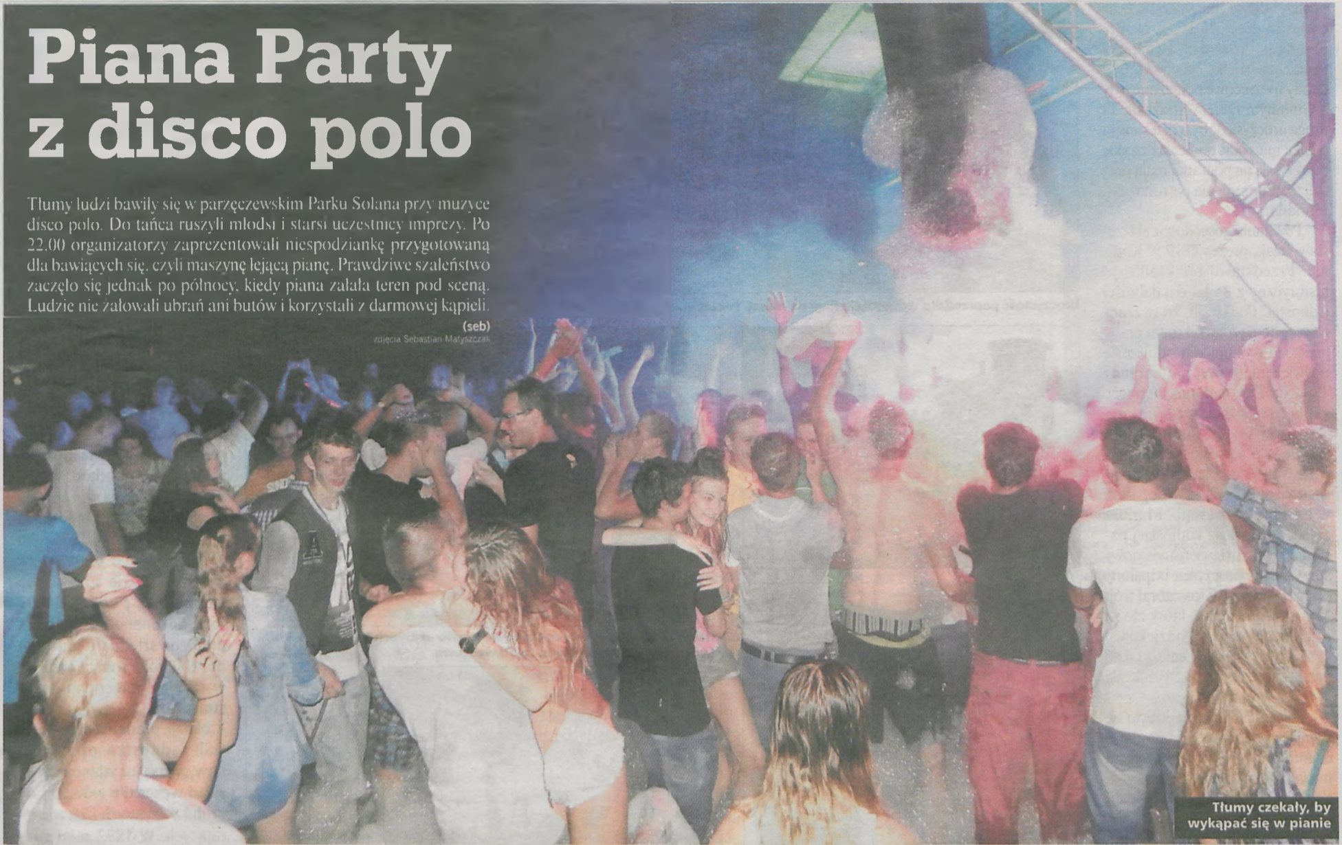
Tłumy czekały, by wykąpać się w pianie