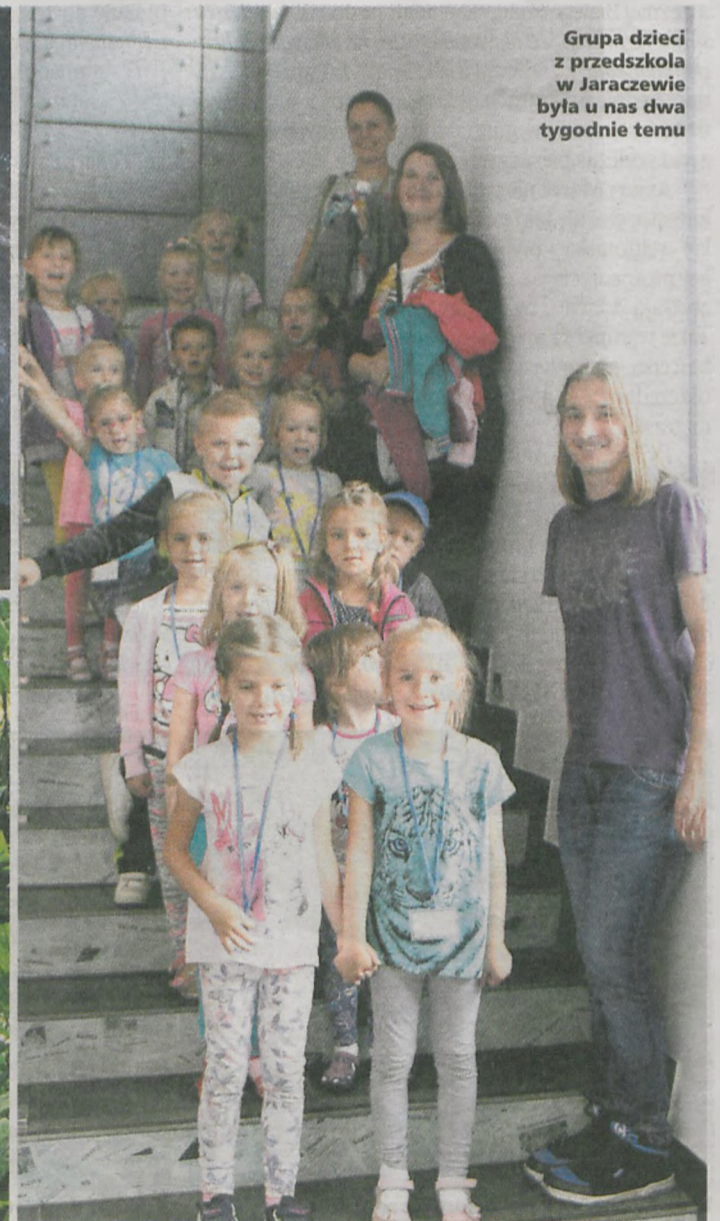
Grupa dzieci z przedszkola w Jaraczewie była u nas dwa tygodnie temu