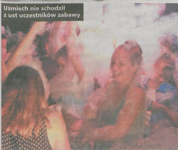
Uśmiech nie schodził z ust uczestników zabawy