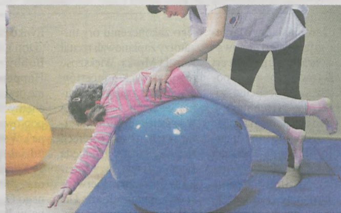
Fundacja przeznaczy większość zebranej sumy na pomoc dzieciom chorym i niepełnosprawnym, m.in. na organizację turnusów rehabilitacyjnych