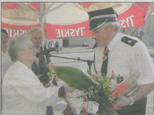
O życzeniach dla jednostki pamiętali chorzyści z „Ariona” oraz panie z KGW