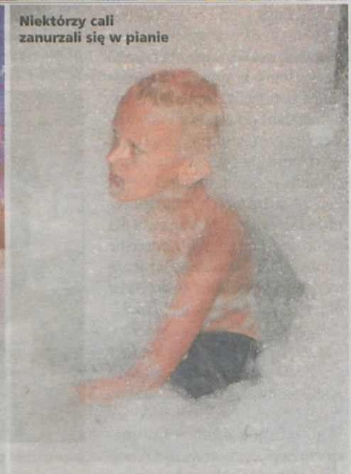
Niektórzy cali zanurzali się w pianie