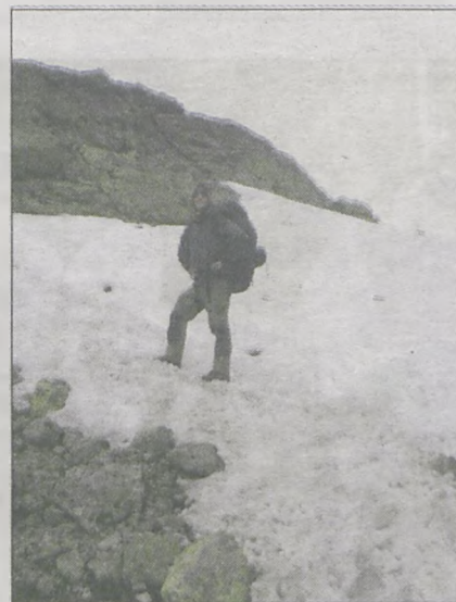
W Parku Narodowym Jotunheimen (Norwegia), wysoko w górach, śnieg nie topnieje przez cały rok