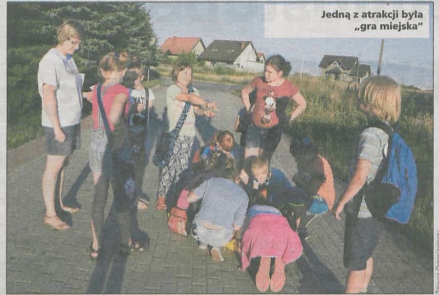
Jedną z atrakcji była „gra miejska”