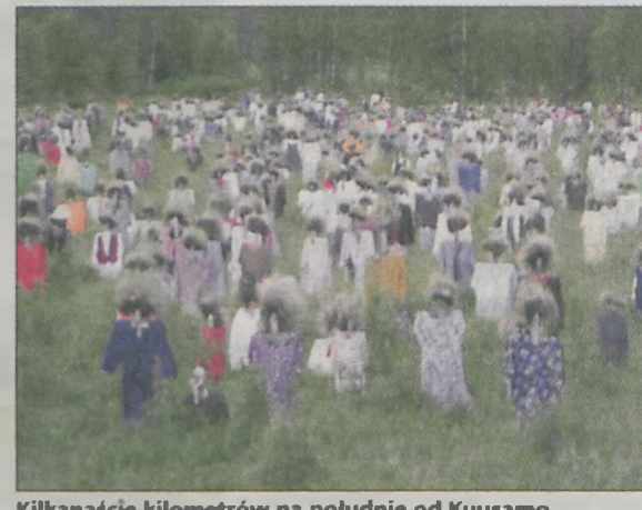
Kilkaście kilometrów na południe od Kuusamo (Finlandia) spotkali „Milczących ludzi”. To ubrane w ludzkie stroje i peruki krzyże