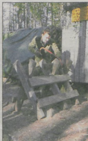
Podczas przygotowywania drewna na ognisko