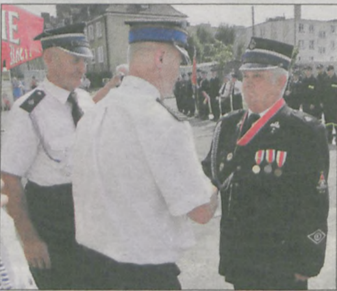
Wręczono kilkadziesiąt medali i kilkanaście listów gratulacyjnych. Niestety nie wszyscy odznaczeni byli obecni na uroczystości