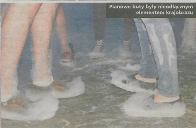
Pianowe buty były nieodłącznym elementem krajobrazu