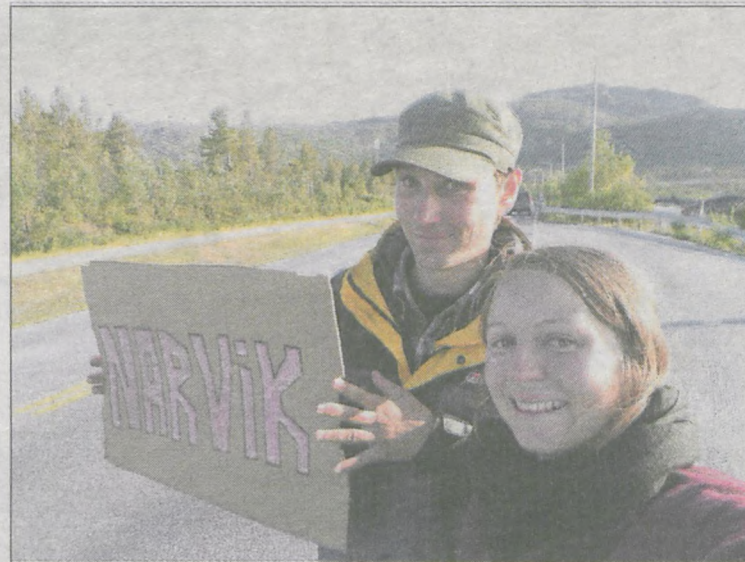
Jak przystało na autostopowiczów, podróżują z przygotowanymi kolorowymi tabliczkami