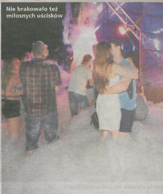
Nie brakowało też miłosnych uścisków