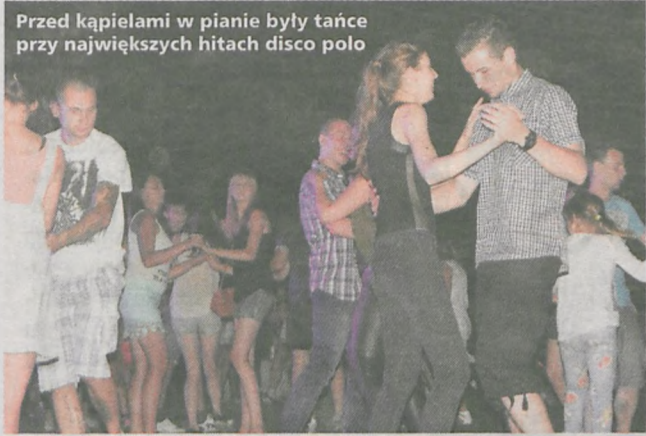
Przed kąpielami w pianie były tańce przy największych hitach disco polo