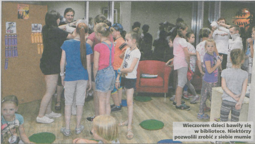
Wieczorem dzieci bawiły się w bibliotece. Niektórzy pozwolili zrobić z siebie mumie