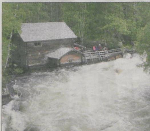
W Parku Narodowym Oulanka podróżnicy nocowali w starym młynie