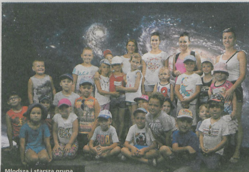
Młodsza i starsza grupa uczestników półkolonii Jarocin Sport odwiedziła nas w minioną środę