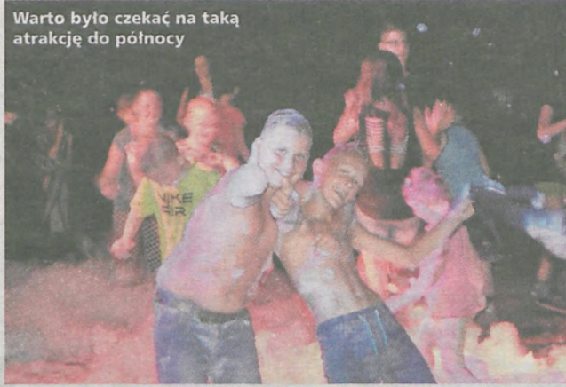
Warto było czekać na taką atrakcję do północy