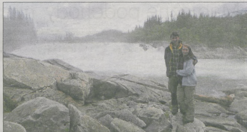
Wodospad Laksforsen w Parku Narodowym Sjunghatten