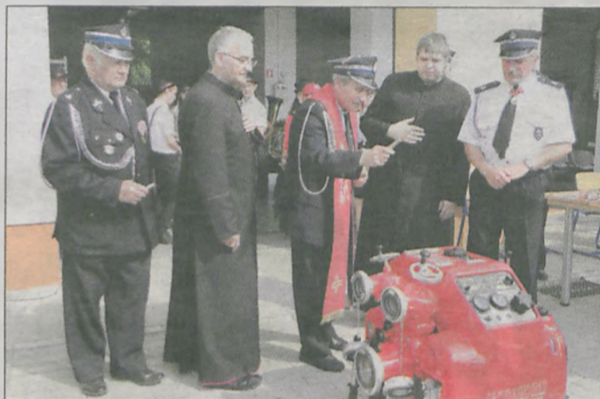
Poświęcenia nowej motopompy dokonało aż trzech kapłanów - dwóch z Kotliny oraz jeden ze Sławoszewa