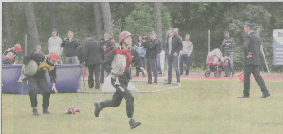
W zawodach wzięły udział również dziewczyny, które należą do żerkowskich jednostek OSP