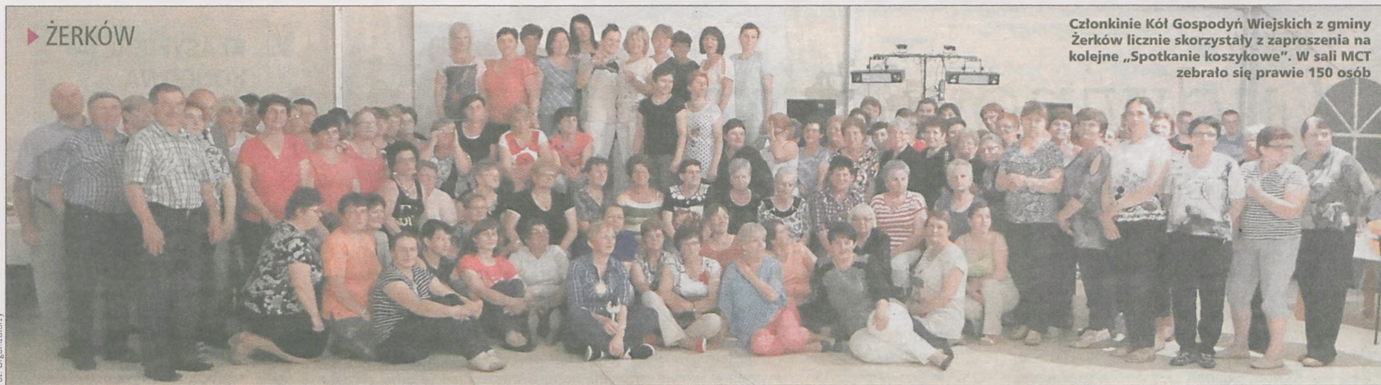
Członkinie Kół Gospodyń Wiejskich z gminy Żerków licznie skorzystały z zaproszenia na kolejne „Spotkanie koszykowe”. W sali MCT zebrało się prawie 150 osób