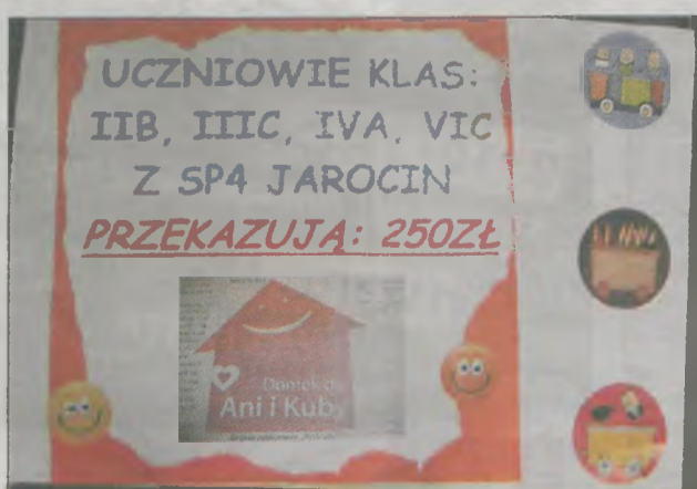
Byli wśród nich uczniowie Szkoły Podstawowej nr 4 w Jarocinie