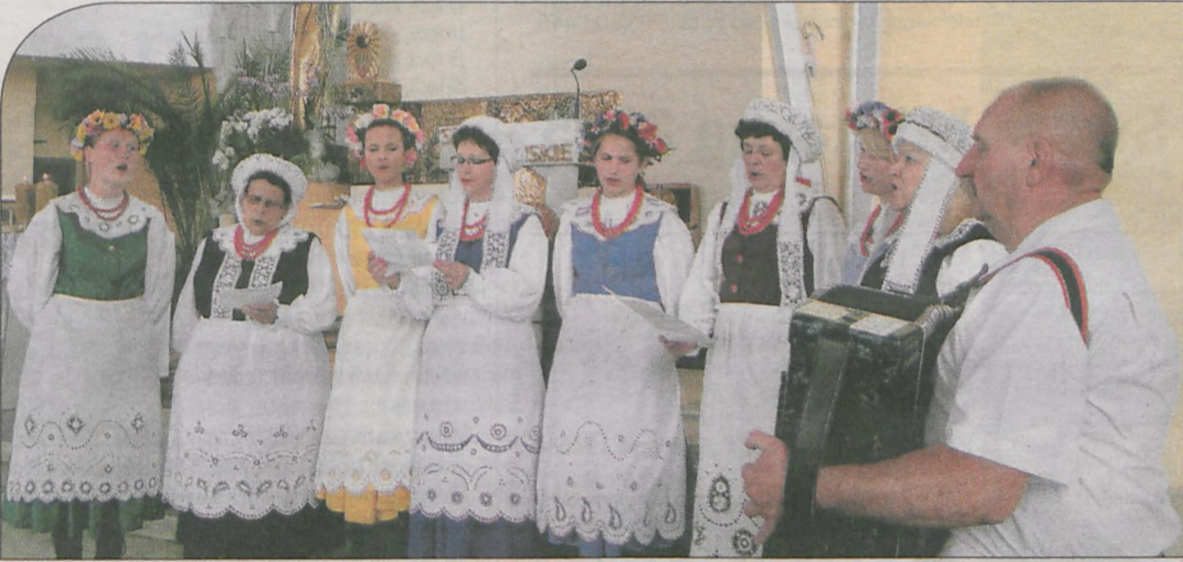
Oprawę mszy św. w kościele franciszkanów zapewniły zespoły uczestniczące w spotkaniach folklorystycznych. Na zdjęciu „Dąbrowianki” z Dąbrowy