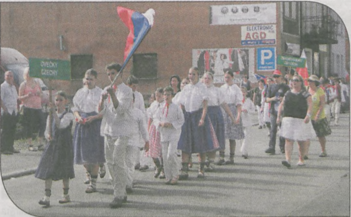
Trasa przemarszu została znacznie skrócona z uwagi na upały. Na zdjęciu grupa „Owieczki” z Czech, która na naszym festiwalu gościła już po raz czwarty