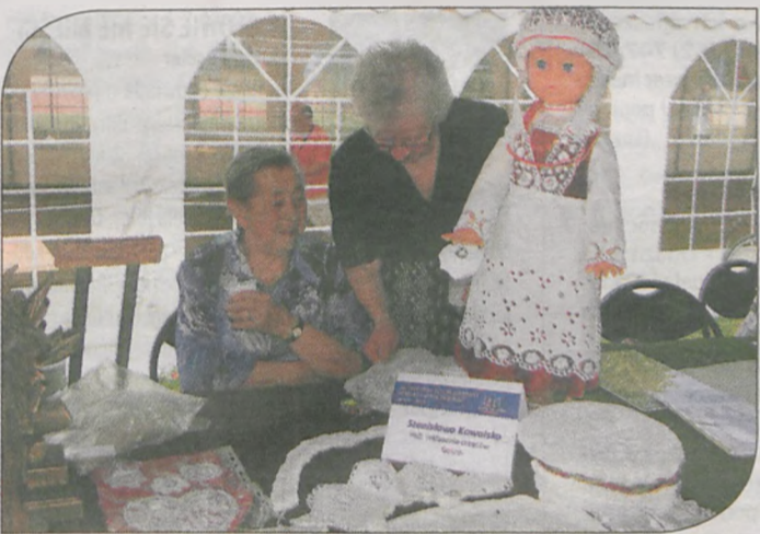
Występom przy jarocińskich basenach towarzyszyła wystawa sztuki ludowej

W pierwszy weekend lipca już po raz osiemnasty odbyły się Międzynarodowe Spotkania Folklorystyczne, organizowane przez Stowarzyszenie Miłośników Kultury Ludowej z Potarzycy. W tym roku wprowadzono kilka zmian do dotychczasowej formuły festiwalu. Po raz pierwszy w historii imprezy zamiast potarzyckiego koncertu inauguracyjnego zorganizowano dwa występy. Pierwszy odbył się w Kotlinie, a drugi w Jaraczewie. W sobotę zespoły pojawiły się tradycyjnie w Żegocinie. W niedzielę folklor z różnych stron Polski i Europy zagościł w Jarocinie. Młodzi tancerze i śpiewacy uczestniczyli wzorem poprzednich edycji we mszy św. sprawowanej specjalnie dla nich we franciszkańskim kościele św. Antoniego Padewskiego. Półtorej godziny później zgromadzili