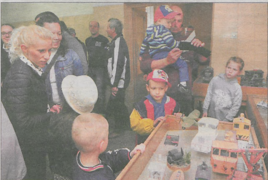
O tym, czym się bawią „duzi chłopcy” można było przekonać się na wystawie modeli i makiet kolejowych