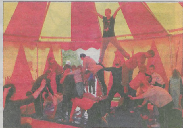
... i wziąć udział w akrobacjach

Fundacja z Hamburga ma zdecydowanie więcej zasług dla Domu Dziecka w Górze niż organizacja wakacji. - Bardzo jesteśmy wdzięczni naszym przyjacio-