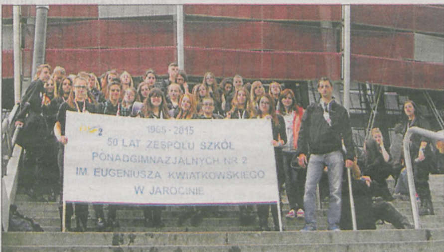
Jarociniacy - uczestnicy Przystanku PaT na tle Stadionu Narodowego w Warszawie