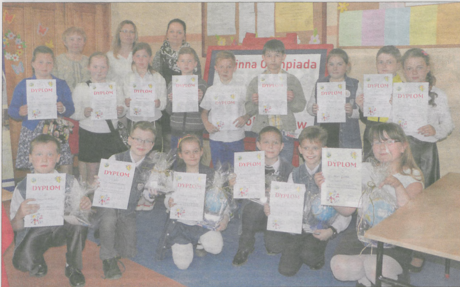
Każdy uczestnik olimpiady matematycznej otrzymał pamiątkowy dyplom

W Szkole Podstawowej w Żerkowie po raz piętnasty odbyła się Gminna Olimpiada Matematyczna Trzecioklasistów.