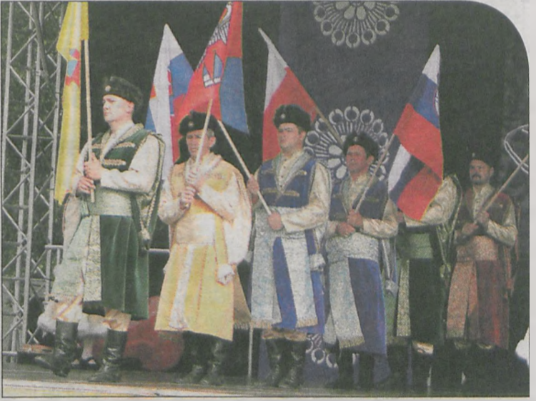
Koncert finałowy rozpoczął się polonezem z flagami w wykonaniu najstarszej grupy „Snutek”