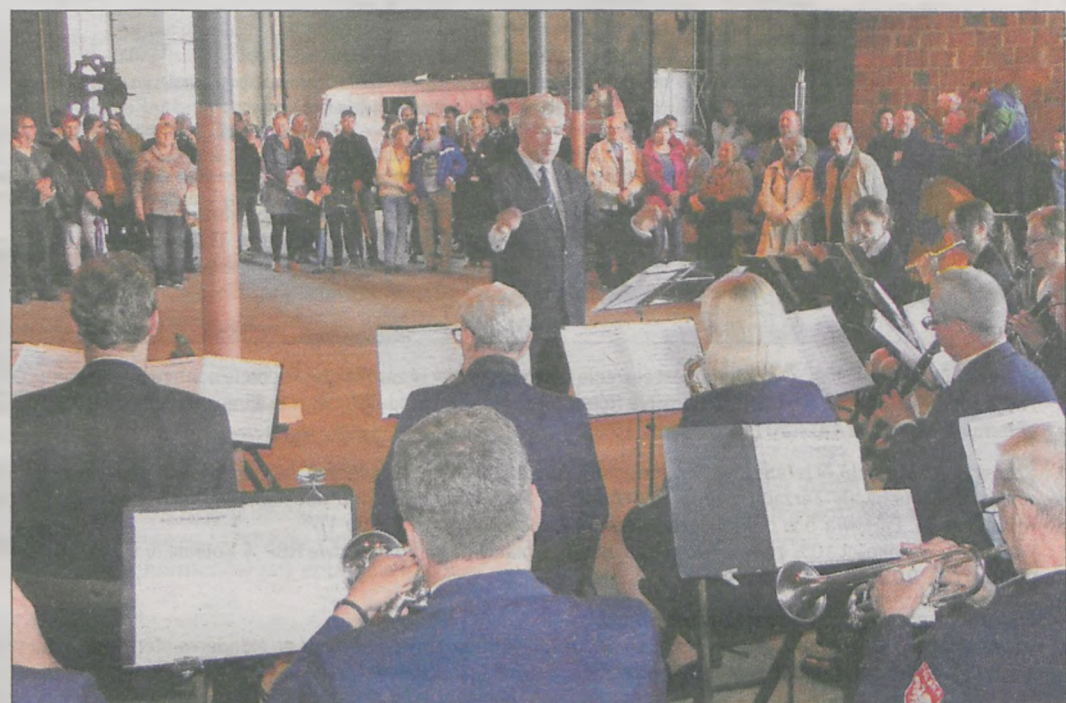
Orkiestra kolejowa z Poznania w czasie koncertu w Parowozowni zagrała zarówno skoczne marsze, jak i znane szlagiery m.in. „My way” Franka Sinatry czy „Moon River” z filmu „Śniadanie u Tifany’ego”

Czerwcowy piknik jest jedną z trzech imprez, jakie odbywają się w ramach obchodów Roku Jarocińskich Kolejarzy. Decyzję o uczczeniu tej grupy zawodowej podjęła w uchwale pod koniec zeszłego roku rada miejska. Pierwsza impreza miała miejsce w maju, w ramach Nocy Muzeów. Drugą był czerwcowy festyn kolejowy w Parowozowni. Ostatnią część obchodów jubileuszowych zaplanowano na listopad. Okazją do uczczenia kolejarzy są przypadające w tym roku: 140. rocznica utworzenia węzła kolejowego, 100-lecie zakończenia budowy pierwszej linii Jarocińskiej Kolei Powiatowej oraz 90. rocznica powstania orkiestry kolejowej.