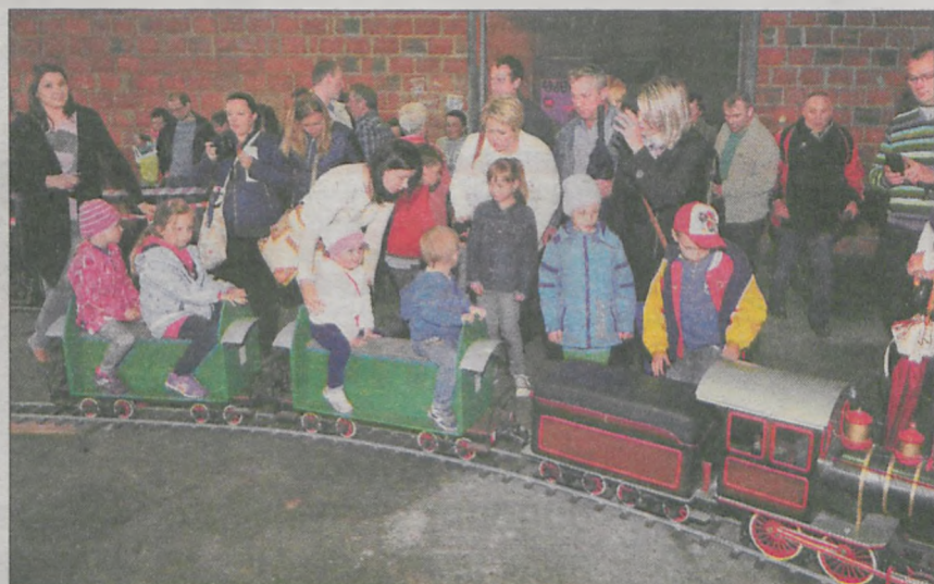
Atrakcją dla najmłodszych były przejażdżki Kolejką Parkową Pecna

Nawet deszczowa pogoda nie pokrzyżowała planów organizatorom „Pikniku kolejowego”, który odbył się na Parowozowni w Jarocinie. Zarówno na dzieci, jak i na dorosłych czekało mnóstwo atrakcji. W wielu miejscach królowały wagoniki, lokomotywy i parowozy. Były to zarówno te olbrzymie eksponaty muzealne, jak i miniaturowe makietki i papierowe modele. Najmłodszy mogli wsiąść do współczesnych i zabytkowych lokomotyw albo przejechać się minipociągami w ramach Kolejki Parkowej Pecna.