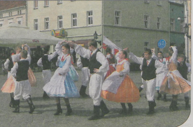
Zespół Folklorystyczny „Snutki” z Potarzycy, który jest od początku gospodarzem festiwalu, na rynku wykonał polkę „Jarocinkę”