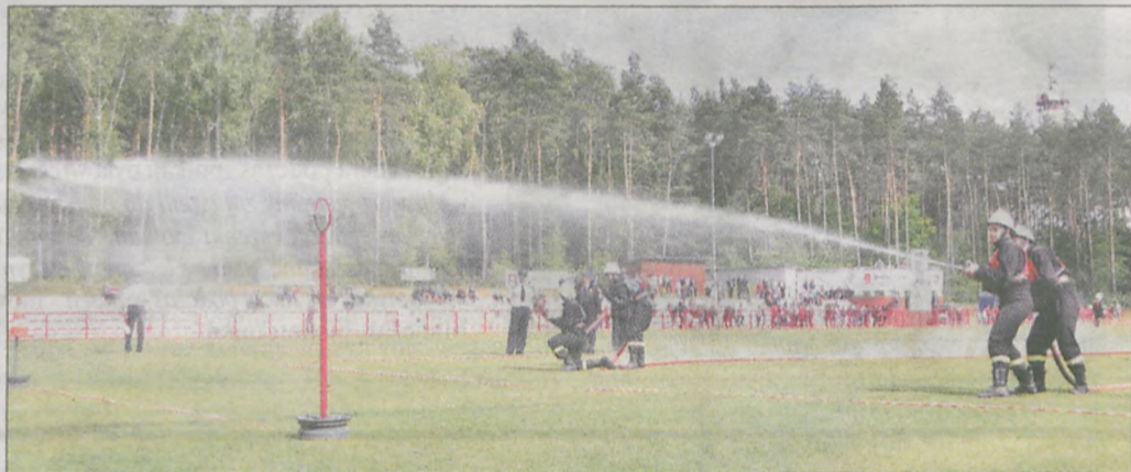
Jedno z zadań polegało na strąceniu celu strumieniem wody