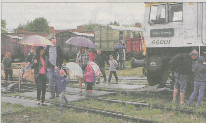
Pomimo deszczowej pogody z propozycji spędzenia niedzielnego popołudnia na pikniku kolejowym skorzystało wielu jarociniaków, w tym również całe rodziny