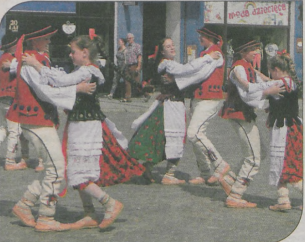
Zespół z Żegocina zamiast folkloru wielkopolskiego pokazał tańce i przyspiewki z rejonów bardziej górzystych