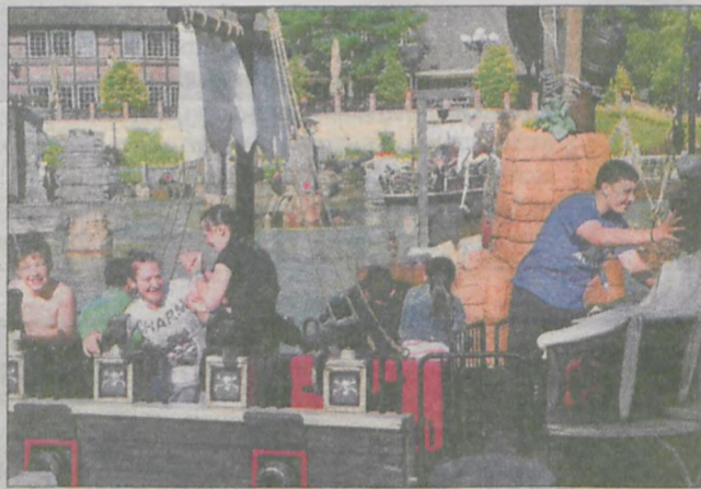
Podopieczni będąc w Niemczech mogli przepłynąć się statkiem...

Dzięki staraniom organizacji, podopieczni mogli wielokrotnie spędzać wakacje w Niemczech. W 2003 roku mieli okazję przebywać na wyspie Sylt na Morzu Północnym. Dzieci zwiedziły też Hamburg i okolice, największy port przeładunkowy, lotnisko, muzeum miniatur z klocków lego oraz miasteczko kowbojskie. - Naj-