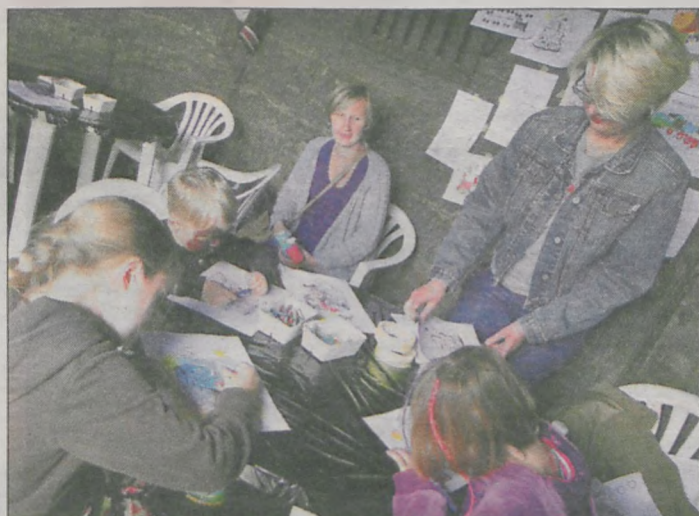
Przez cały czas trwania pikniku kolejowego panie z biblioteki pomagały w tworzeniu małych lokomotyw i pociągów