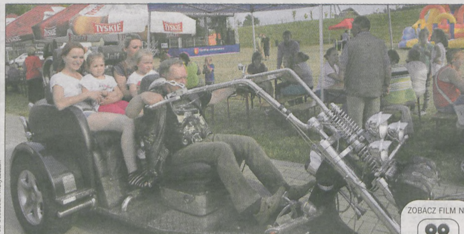
Furorę robili trójkołowcy przewożące całe rodziny