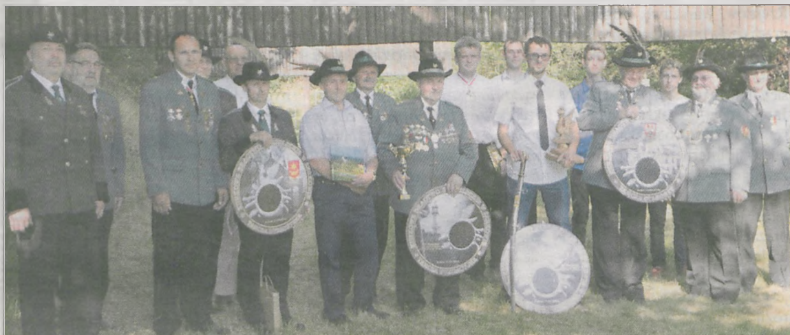
Fot. Piotr Miśkiewicz