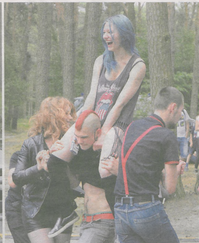
Fenomenem imprezy jest to, że można tu posłuchać różnych gatunków muzyki