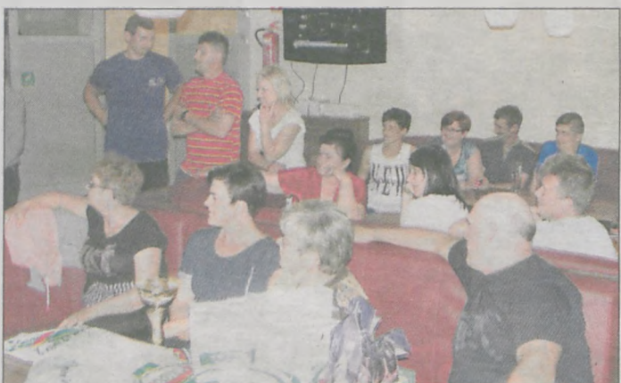
Każdy uczestnik turnieju starał się wypaść jak najlepiej, tym bardziej, że licznie zgromadzona publiczność śledziła każdy ruch zawodników