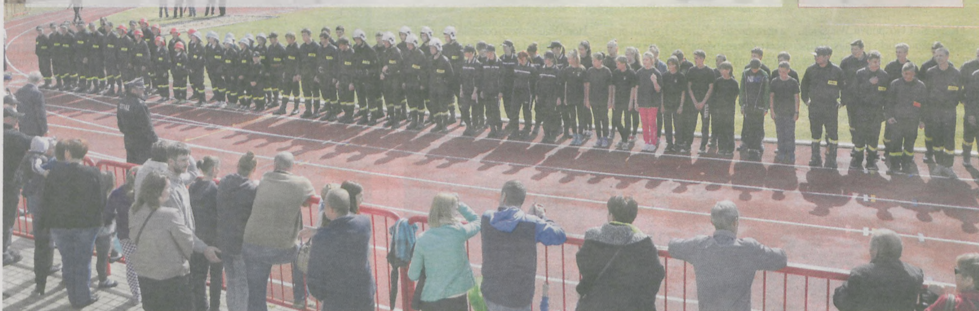
Zawody sportowo-pożarnicze odbyły się na stadionie w Żerkowie