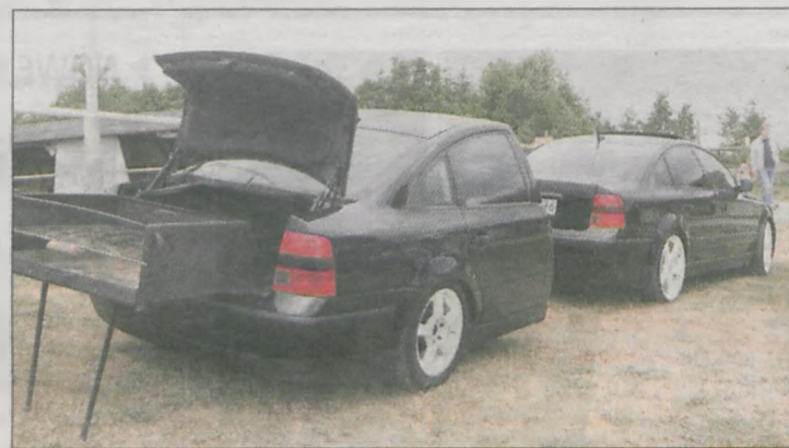
Drugiego takiego pojazdu w Bryllandii nie było