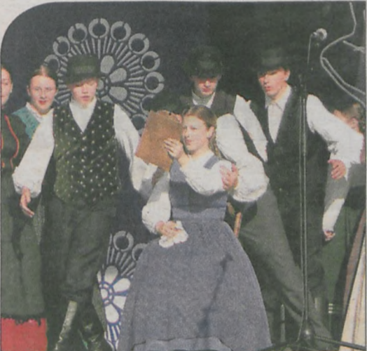
Goście ze Słowenii - zespoły „Student” i „Rożmarin” - oprócz swoich tradycyjnych tańców zaprezentowali kilka obrazków scenicznych