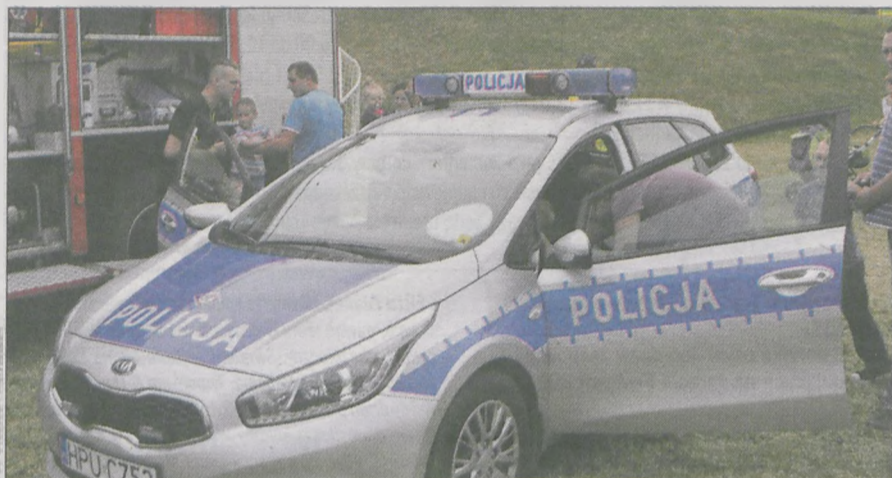
Dzieci chętnie pozowały w samochodach strażaków i policjantów

Stare szlagiery, jak znana z repertuaru Alicji Majewskiej piosenka „Być kobietą”, przypomniwały seniorom, korzystającym z Domu Dziennego Pomocy Społecznej w Jarocinie, „Pszczółki” i „Misie” z Przedszkola nr 6 „Jarzębinka”. Były też tańce i wierszyki. Okazje do radości i wzruszeń stanowiły majowy Dzień Matki i czerwcowy Dzień Ojca. Na koniec wszyscy widzowie zostali obdarowani życzeniami i papierowymi kwiatami wykonanymi przez najmłodszych. (ls)