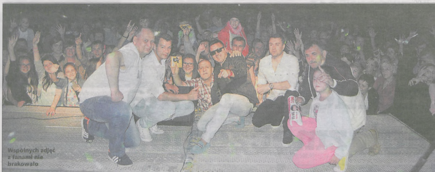
Wspólnych zdjęć z fanami nie brakowało