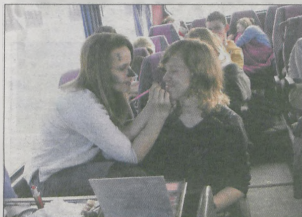
Przygotowania do karnawałowej zabawy rozpoczęły się już w autokarze