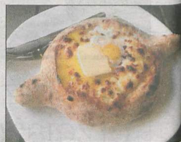
Klasyczne danie kuchni gruzińskiej, czyli chaczapuri. To zapiekany chleb z serem, tu z dodatkiem jajka