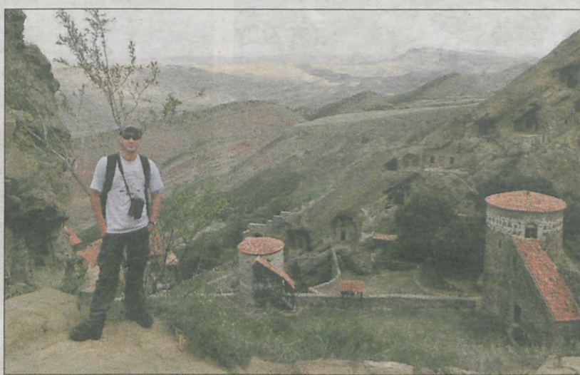
W otoczonym legendami monasterze David Garedża z VI w., dokładnie na granicy między Gruzją i Azerbejdżanem.