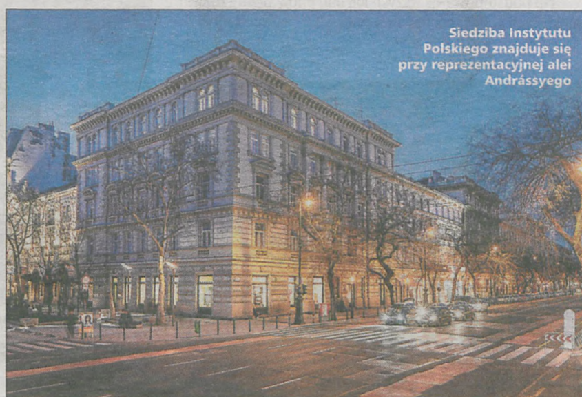
Siedziba Instytutu Polskiego znajduje się przy reprezentacyjnej alei Andrássyego

z mediami. Głównie jednak zajmowałem się współpracą kulturalno-naukową - opowiada. Następnie przeniósł się znowu do Warszawy. - Tak zazwyczaj jest, że przez cztery-pięć lat dyplomaci są na placówkach, a potem wraca się do tzw. Centrali, czyli głównej siedziby MSZ w Warszawie - tłumaczy. Tu, na miejscu, zajmował się przygotowaniem polskiej prezydencji w Radzie Unii Europejskiej. Odpowiadał za spotkania na wysokim szczeblu oraz promocję Polski w Brukseli i innych krajach podczas prezydencji. Kiedy prezydencja dobiegła końca, - musiał poszukać sobie nowego wyzwania. - Nawet jak się jest dyplomata, to ministerstwo ogłasza, że w danym terminie będzie nabór na jakieś stanowisko i trzeba złożyć dokumenty, przejść rozmowę kwalifikacyjną - tłumaczy. Aplikował na stanowisko w centrali, ale rozważał też z zoną wyjazd za granicę. Pojawilo się również kilka ofert w instytucjach międzynarodowych. Ogłoszono m.in. nabór do Misji Obserwacyjnej Unii Europejskiej w Gruzji (EUMM), która funkcjonuje w ramach europejskiej dyplomacji.