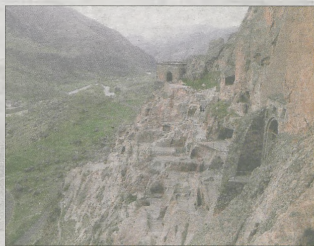
Niesamowite miasto skalne Wardzia z XII wieku w południowej Gruzji, niedaleko granicy z Turcją