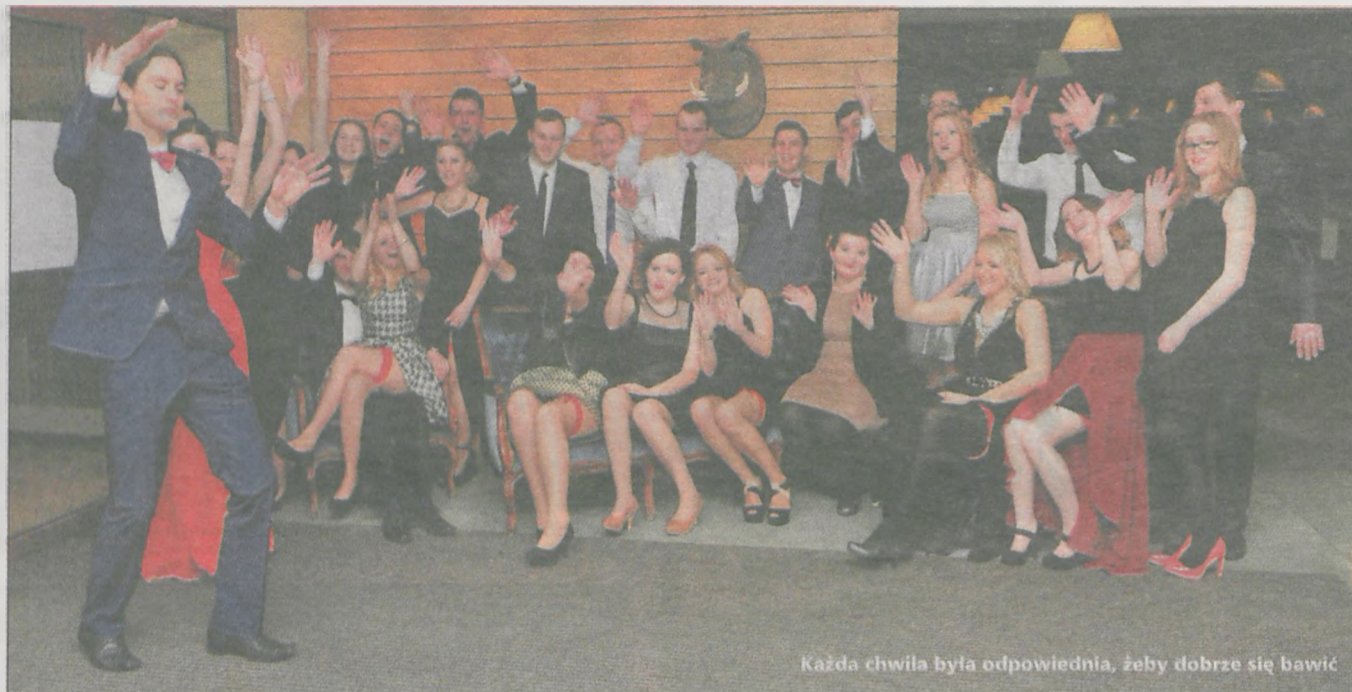
Każda chwila była odpowiednia, żeby dobrze się bawić