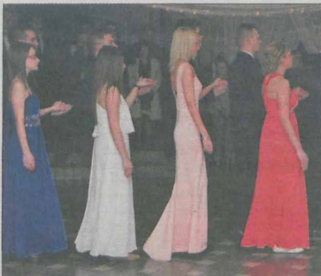
Młodzież ze szkoły w Tarcach bawiła się w pałacu w Słupi. Dziewczęta wybrały kreacje, które pasowały do miejsca i okoliczności