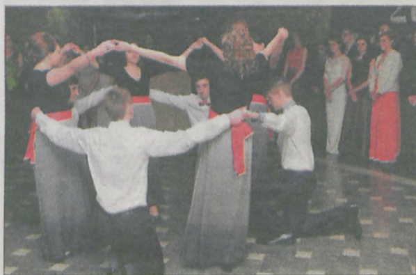
Na balach królował walc. Każda szkoła przygotowała indywidualną choreografię do tego tańca