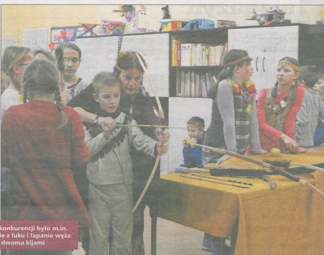
Wśród konkurencji było m.in. strzelanie z łuku i fapanie węża dwoma kijami