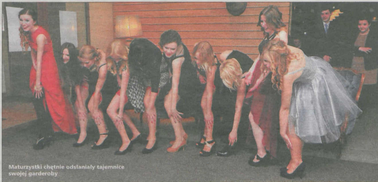
Maturzystki chętnie odsłaniały tajemnice swojej garderoby