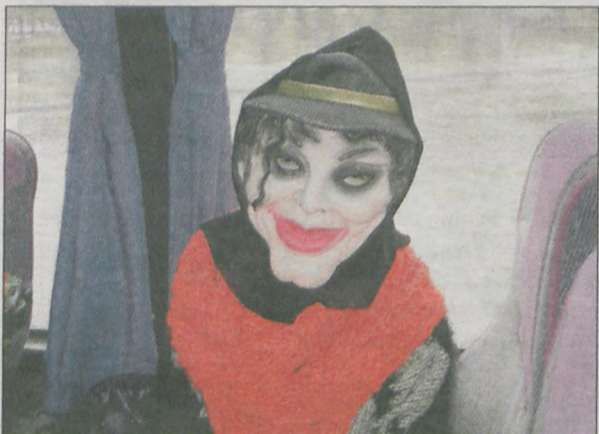
Niektórych trudno było rozpoznać