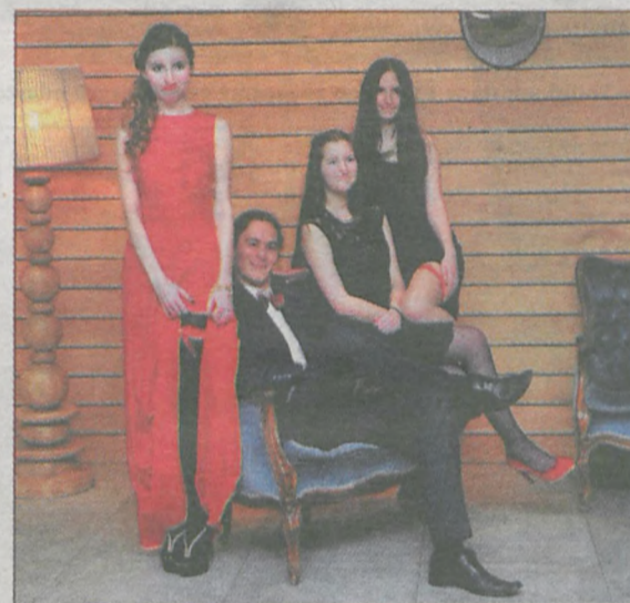
„Król” jest tylko jeden