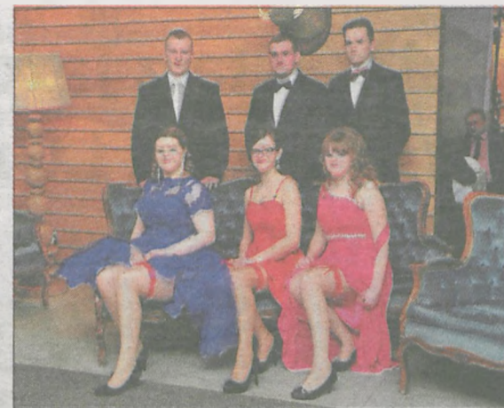
Podwiązki - nieodłączny atrybut studniówkowych kreacji dziewcząt