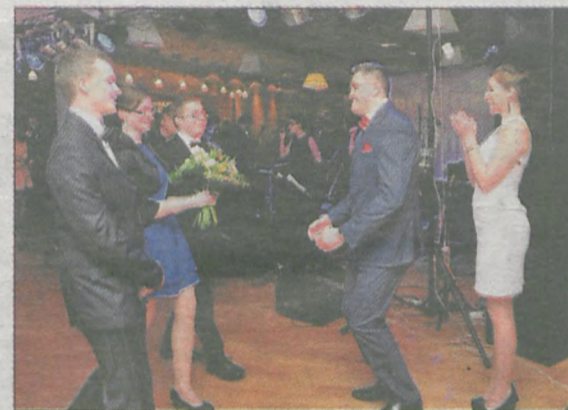
„Kochamy naszego pana dyrektora...”