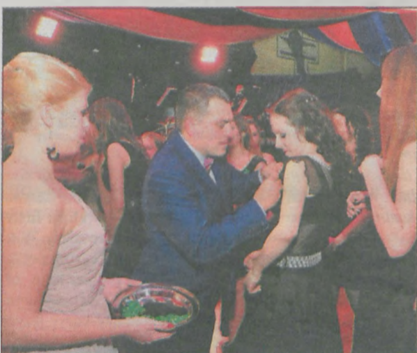
Przypięcie tradycyjnej koniczyny sprawiało niektórym kłopoty