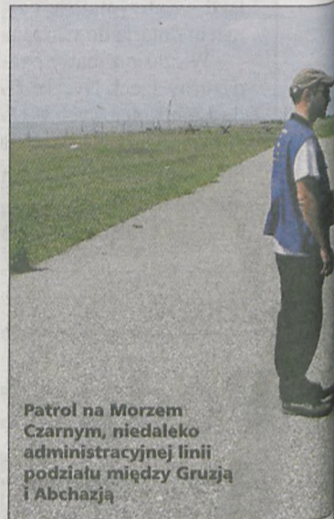
Patrol na Morzem Czarnym, niedaleko administracyjnej linii podziału między Gruzją i Abchazją