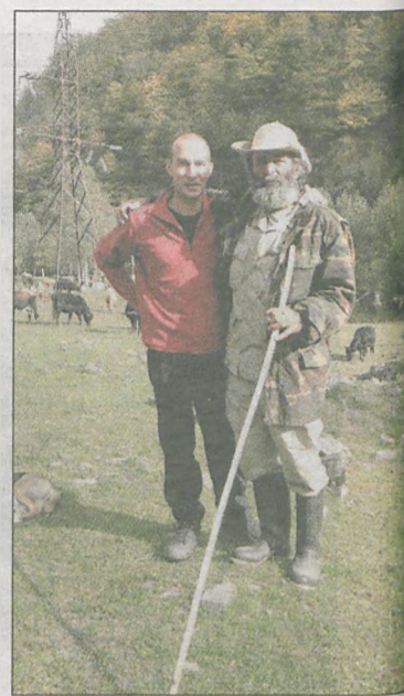
Spotkanie z pasterzem w regionie Tuszetii