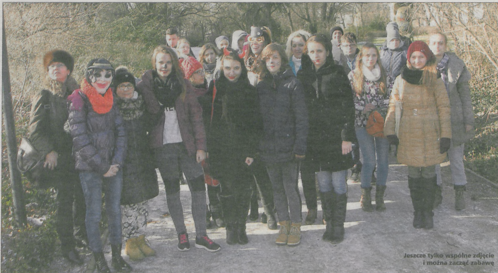
Jeszcze tylko wspólne zdjęcie i można zacząć zabawę

Na pierwszej placówce dyplomatycznej był w Szwajcarii, w latach 2005-2010. Pełnił tam funkcję attaché ds. kultury i nauki. - Miałem też szereg obowiązków politycznych, odpowiadałem za sprawy protokolarne i kontakt