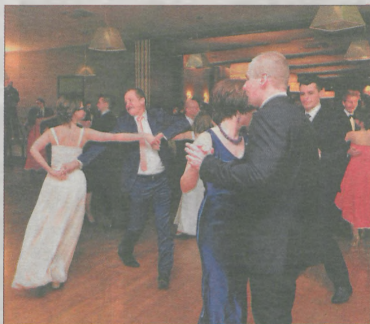
Uczniowie porwali nauczycieli do tańca