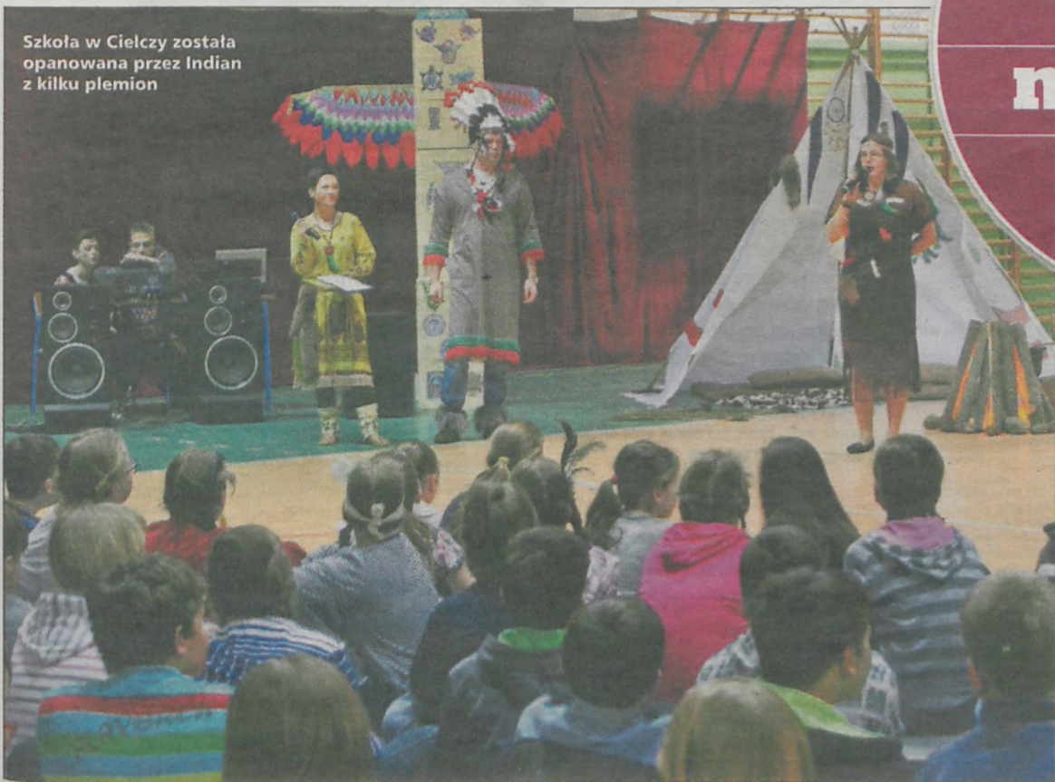
Szkoła w Cielczy została opanowana przez Indian z kilku plemion