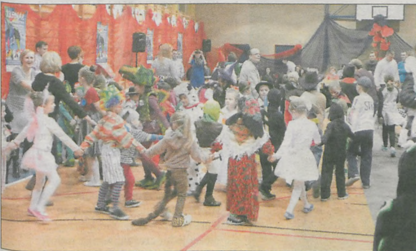
W Dobieszczynie akcję charytatywną połączono z balikiem karnawałowym. Szkole udało się poprawić wynik zbiórki prawie o 500 zł