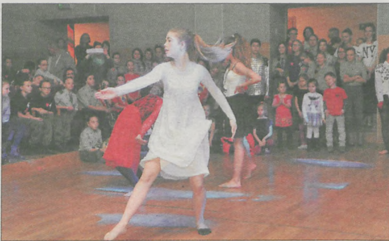
Zaprezentowały się też grupy taneczne