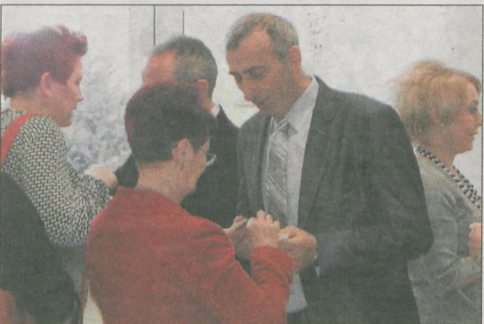
Łamanie się opłatkiem stanowiło jeden z ważniejszych punktów spotkania

Władze Jaraczewa, obecni i byli radni, urzędnicy, sołtysi, księża, a także przedstawiciele poszczególnych organizacji w gminie przybyli na spotkanie oplatkowe z uroczystym obiadem w sali wiejskiej w Rusku, które odbyło się tuż przed sylwestrem.