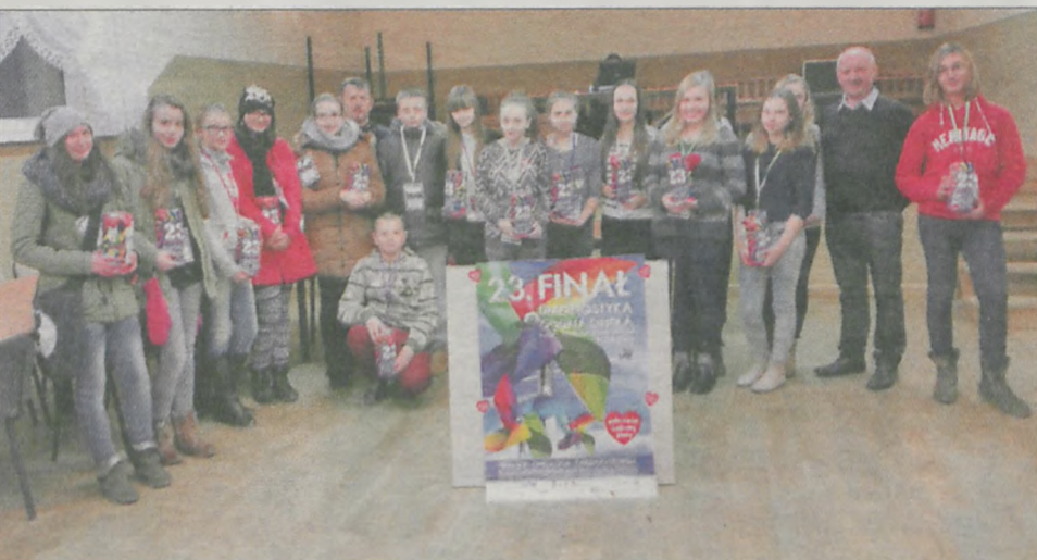
W Chrzanie jak co roku działał dwudziestoosobowy sztab zarejestrowany przez TKKF „Europejczyk”. Oprócz kwesty zorganizowano kilka imprez sportowych m.in. biegi i marsze