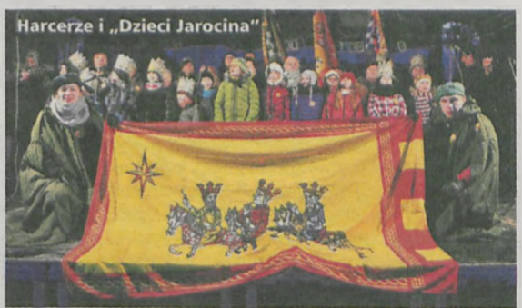
Harcerze i „Dzieci Jarocina”