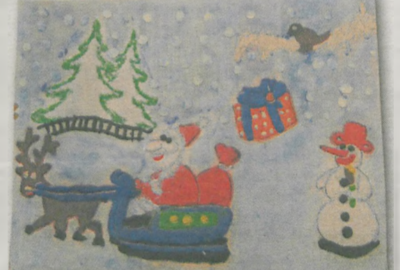
KLAUDIA MATUSZAK 8 lat, Sucha