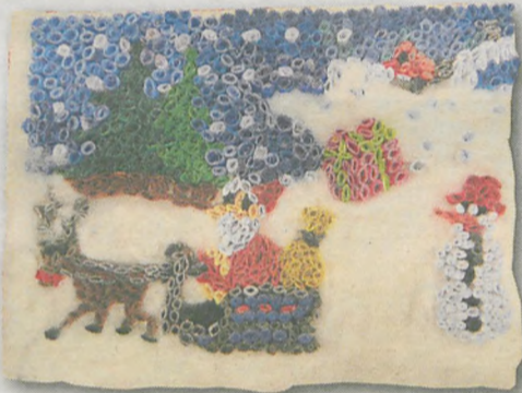
WIKTORIA KRÓL 8 lat, Żerniki