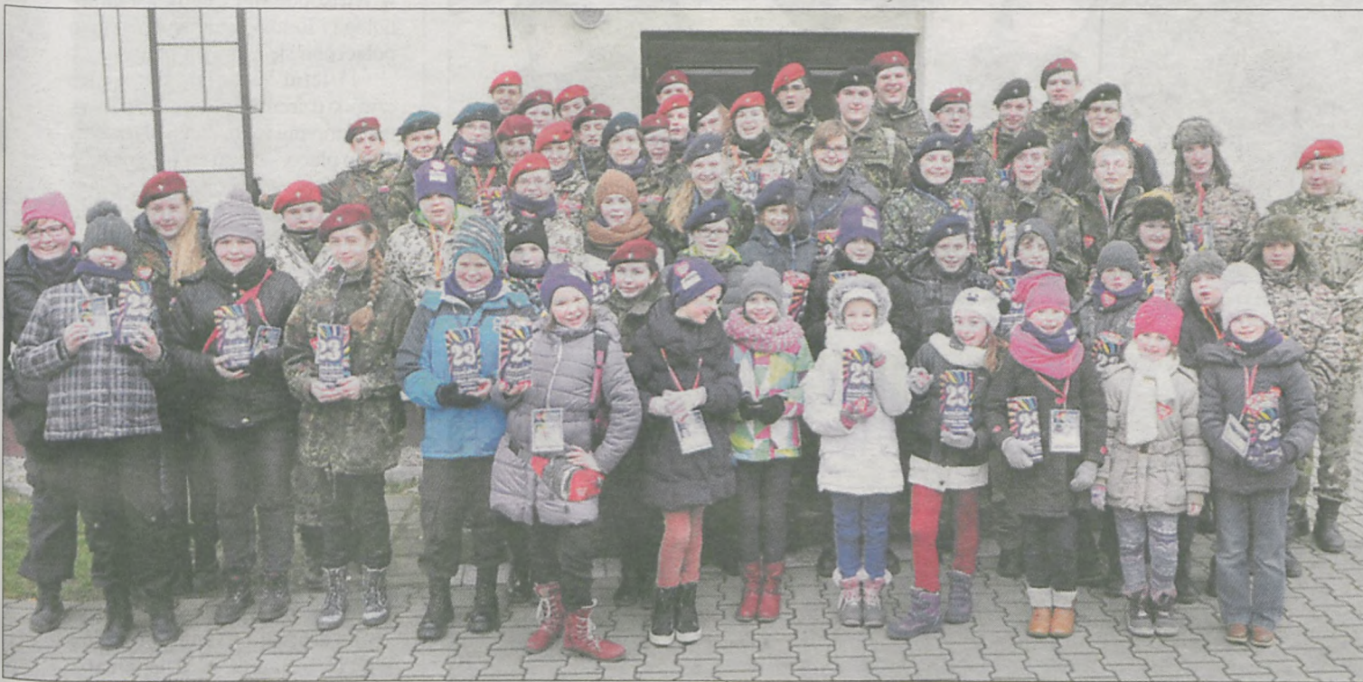
W Jarocinie, jak co roku, działały dwa sztaby. Na zdjęciu członkowie Organizacji Harcerskiej „Rodło”, którzy centrum dowodzenia mieli w pawilonie „ogólniaka”