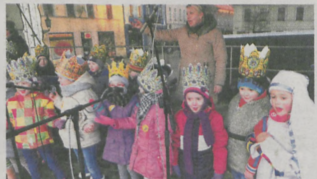
Podczas Czwartego Jarocińskiego Kolędowania zabrzmiały kolędy stare i nowe, czasem w zaskakujących aranżacjach

W czasie plenerowego koncertu kolęd wystąpili: dzieci z jarocińskich przedszkoli „Stokrotka”, „Poziomka”, „Jazgębinka” i „Marcinek”, schola parafialna „Tęczowe Nutko” i „Franciszkowe Skowronki”, uczniowie Niepublicz-