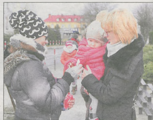
Wolontariusze WOŚP kwestowali przede wszystkim pod kościołami i marketami