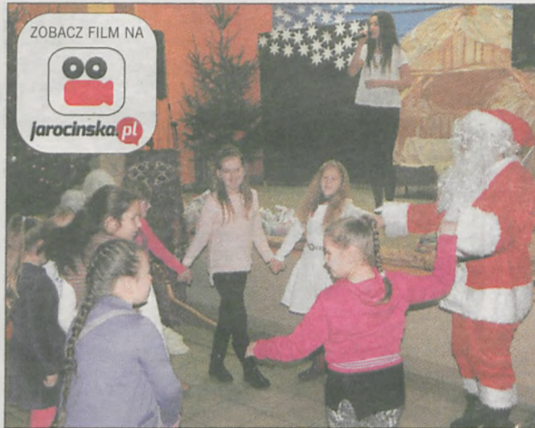
Św. Mikołaj nie tylko rozdawał prezenty, ale też tańczył z dziećmi w rytm kołęd

Koncertem kołęd w wykonaniu zespołu „Złota Jesień” rozpoczęło się mikołajkowe spotkanie zorganizowane przez soltysów Wojciechowa i Łowęcic. Do śpiewania przyłączyli się też dorośli. Następnie do świetlicy wiejskiej wszedł św. Mikołaj, który rozdał najmłodszym niemal sto prezentów.