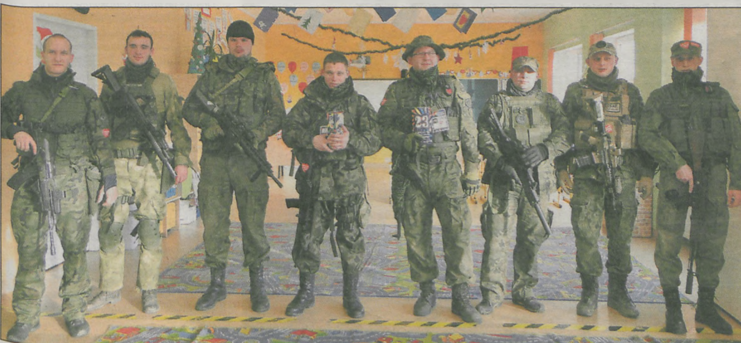
Członkowie Jarocińskiej Formacji Airsoftowej Nighthawks zapewniali, że nie musieli grozić bronią, żeby ludzie chcieli napelnić ich puszki. W sumie zebraли 974,10 zł