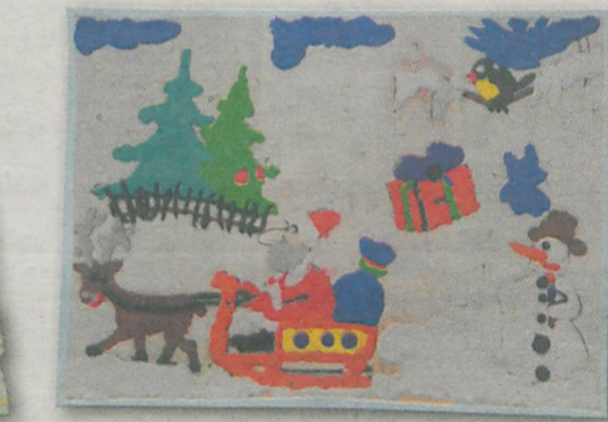
FRANCISZEK HAŁAS 5 lat, Wilkowyja