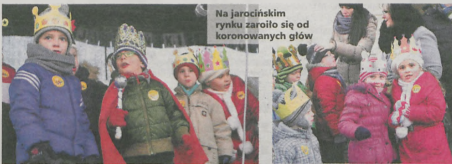
Na jarocińskim rynku zaroilo się od koronowanych głów