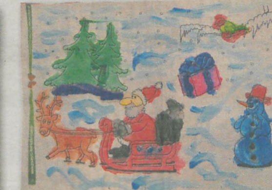
FILIP TOMCZAK 3 lata, Nosków