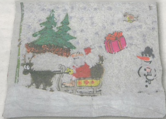
JULIA HUMPA 13 lat, Brzostów