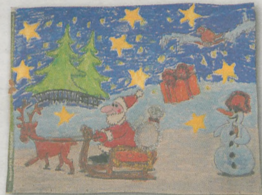
MACIEJ PSYK 7 lat, Lgów