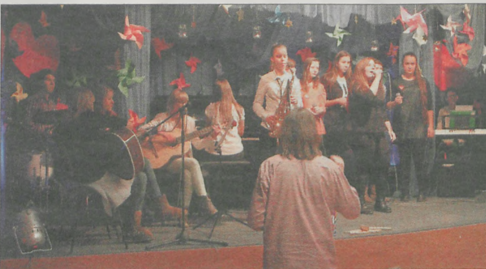
W Kotlinie finał orkiestrowego grania odbył się po raz pierwszy w Domu Kultury. Na scenie zaprezentowali się przedszkolacy, uczniowie, ale również uczestnicy zajęć prowadzonych przez niedawno otwartą placówkę