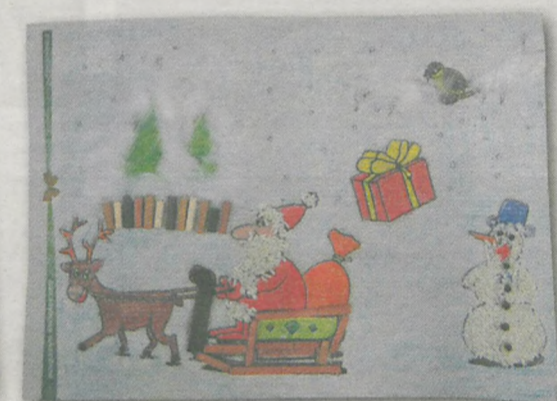
ANTEK ZAWORSKI 6 lat, Wilkowyja