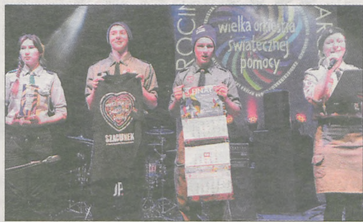
Podczas imprezy w Jarocińskim Ośrodku Kultury odbywały się pokazy strażackie oraz zajęcia prowadzone przez harcerzy