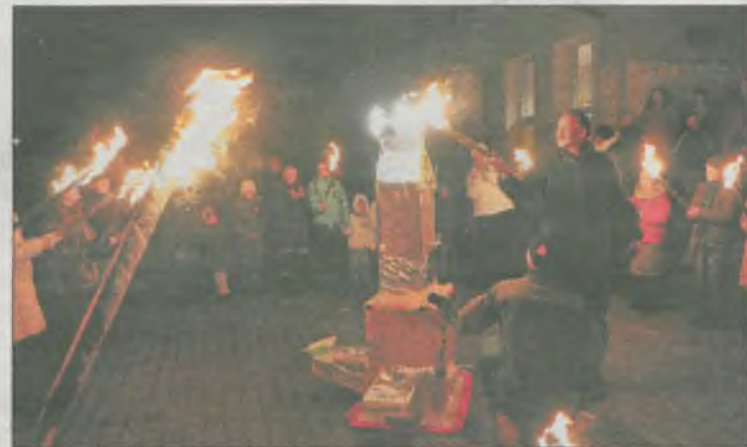
Na placu przed JOK-iem w ramach „światelka do niebo” odpalano świeczki na konstrukcji wykonanej przez harcerzy