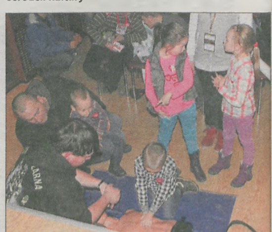
W Nowym Mieście kwestowano, licytowano, ale również uczono zasad pierwszej pomocy. Każdy mógł wykonać resuscytację krążeniowo oddechową pod okiem instruktora