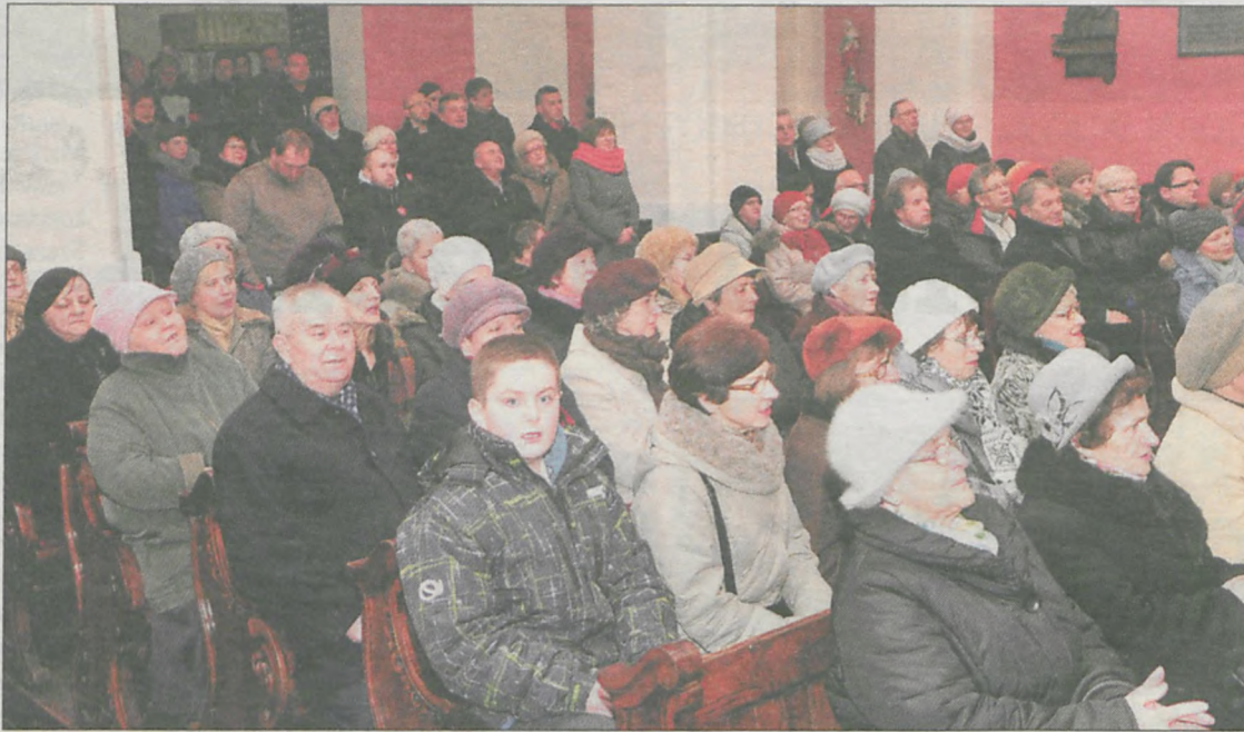
Publiczność długo oklaskiwała śpiewaczkę, a na koniec wspólnie ze wszystkimi muzykami i chórzystami wykonała jedną z kołęd