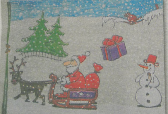
DOROTA SMOLAREK 10 lat, Jarocin