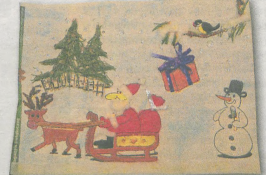
DAWID FRANKOWIAK 6 lat, Wolica Pusta