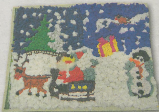
WOJCIECH KRÓL 5 lat, Żerniki