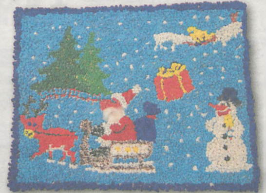
TOBIASZ CHOJNACKI 5 lat, Golina