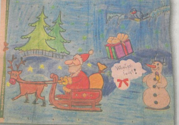
ALEKSANDRA SZYM CZAK 9 lat, Witaszyce