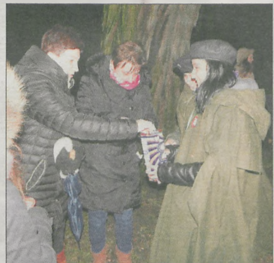
W Jaraczewie kwestowano podczas sobotniego koncertu kolędowego zorganizowanego przez Gminny Ośrodek Kultury