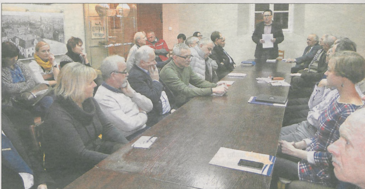
Frekwencja na pierwszym spotkaniu była tak duża, że nie dla wszystkich wystarczyło miejsc przy stole