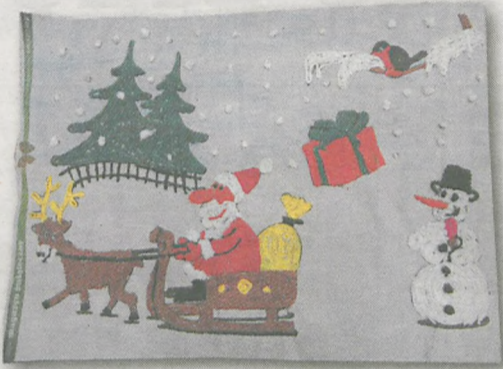
KLAUDIA BŁASZCZYK 10 lat, Nosków