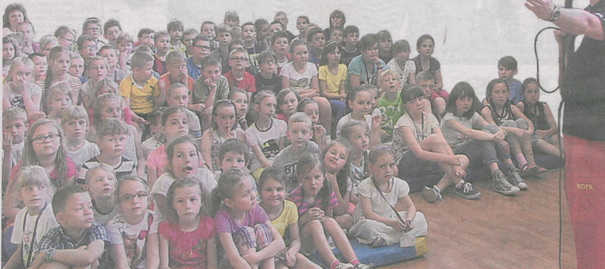
W spotkaniu z ratownikami uczestniczyło kilka klas z jarocińskiej „czwórki”