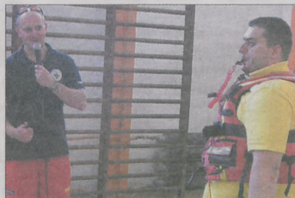
Ratownicy też sami prezentowali działanie sprzętu