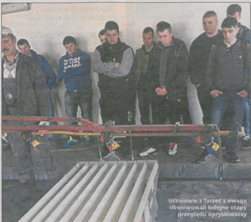
Uczniowie z Tarce z uwagą obserwowali kolejne etapy przeglądu opryskiwaczy