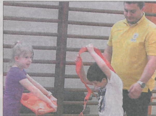
Niesienie pomocy rówieśnikom było jednym z najciekawszych elementów spotkania