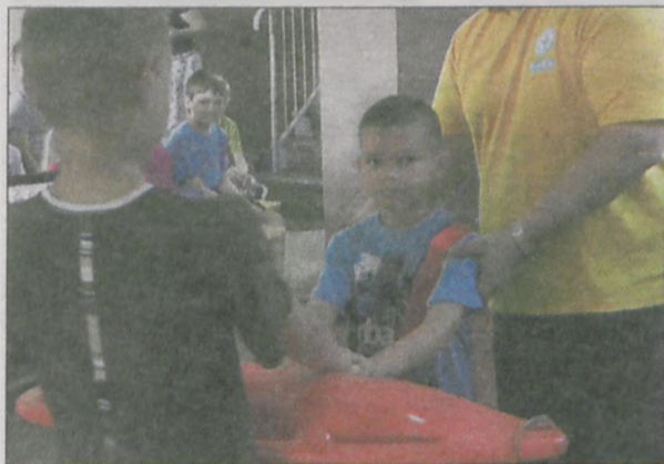
Boja „Pamela” w akcji