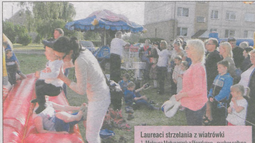
Dzieciom podobały się wszystkie przygotowane przez organizatorów atrakcje