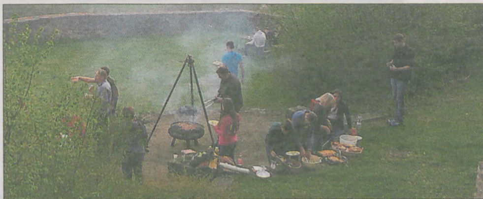
Po całym dniu zajęć była chwila na odpoczynek i degustację pieczonych kielbasek

bajkopisarzami - relacjonuje nauczyciel.