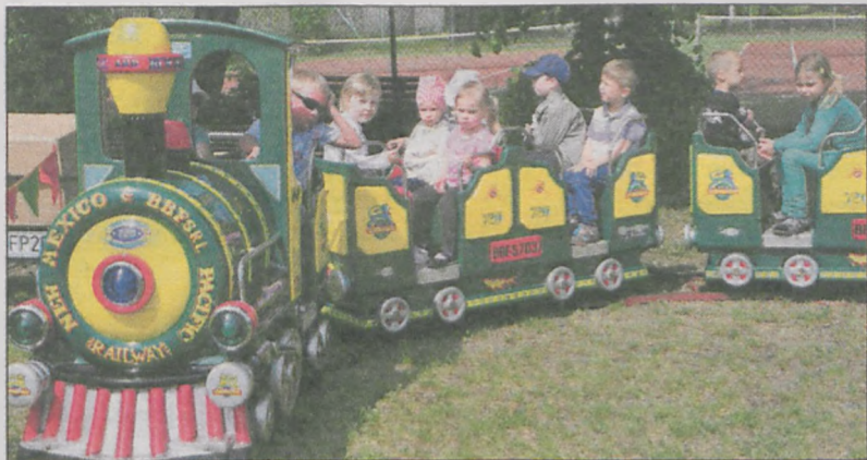
Jedną z atrakcji festynu była kolejka

-rozrywkowa obchodów święta najmłodszych. Atrakcje przygotowały Muzeum Regionalne, Jarociński Ośrodek Kultury i Biblioteka Publiczna Miasta i Gminy Jarocin. Było przedstawienie lalkowe „Księżniczka na ziarnku grochu”, książkowy tor przeszkód i „historyczne” zajęcia plastyczne. Nie zabrakło też słodkich niespodzianek. (ts)