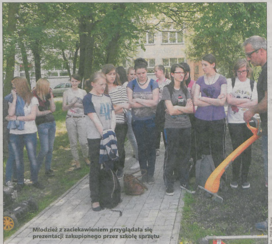
Młodzież z zaciekawieniem przyglądała się prezentacji zakupionego przez szkołę sprzętu