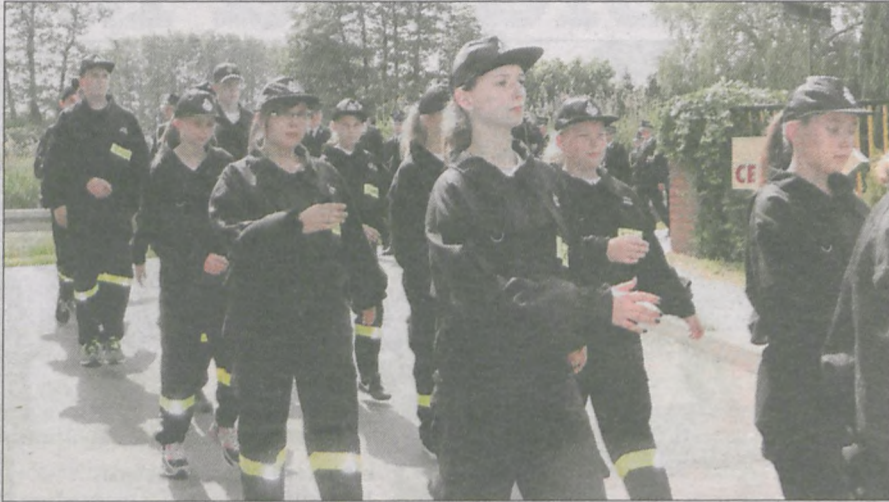
Powiatowe obchody Dnia Strażaka zorganizowano w Żerkowie