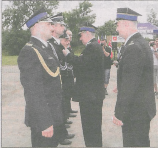
Wręczono odznaki i medale

Ponad 20 odznaczeń, awanse na wyższe stopnie, dyplomy uznania, gratulacje i życzenia - tak wyglądały obchody Powiatowego Dnia Strażaka w Żerkowie.