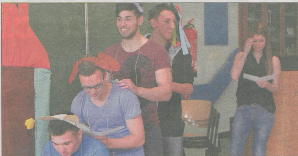
Występy teatralne dostarczyły wszystkim - zarówno występującym na scenie, jak i publiczności - wiele radości

Uczestnicy projektu mieli też możliwość podziwiania krajobrazów południowej Hesji, które zrobiły na wszystkich duże wrażenie. - Gospodarze zorganizowali dla nas również wycieczkę do Kassel, gdzie długie lata żyli i tworzyli bracia Grimm. W związku z tym mieliśmy okazję zwiedzić znajdujące się tam muzeum poświęcone tym znanym na całym świecie twórcom. Jedną z atrakcji wieczoru było wyjście do teatru kukielkowego w Steinau - miasteczko, które także związane jest z niemieckimi