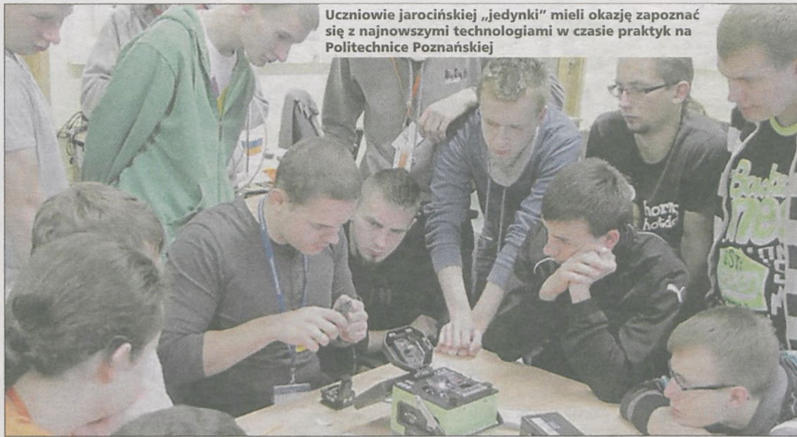
Uczniowie jarocińskiej „jedyki” mieli okazję zapoznać się z najnowszymi technologiami w czasie praktyk na Politechnice Poznańskiej