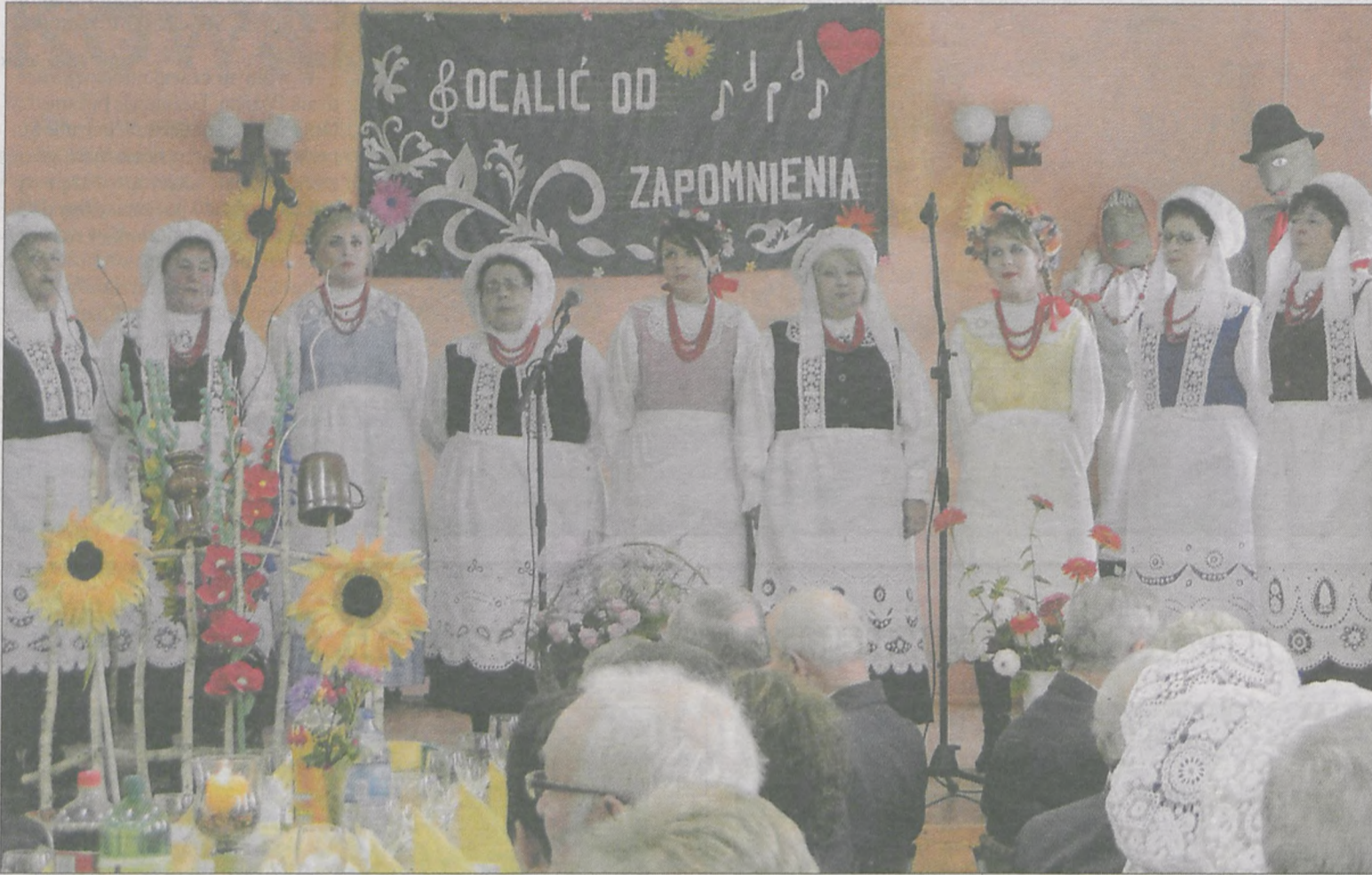
Z kolejnych przeglądów kultury ludowej „Dąbrowianki” wracają z nagrodami