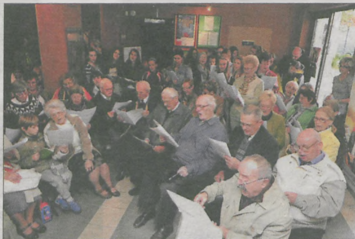
Na „Wielkopolskim Śpiewaniu” w holu kina spotkało się kilka pokoleń jarocinianków