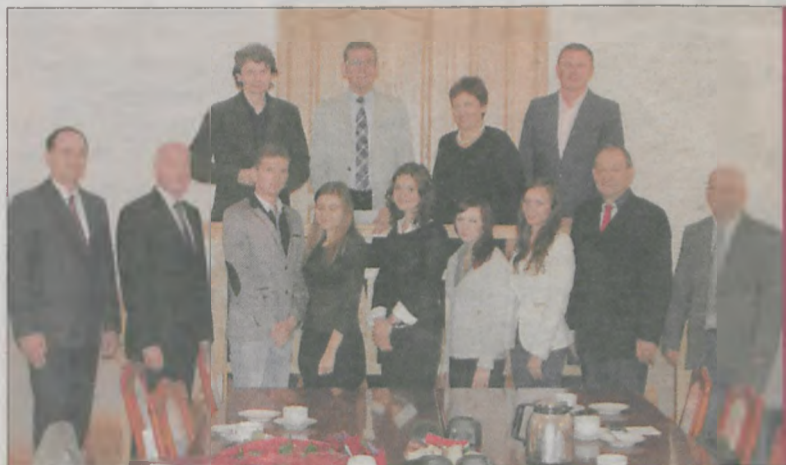
Najlepsi maturzyści powiatu jarocińskiego zostali nagrodzeni przez starostę