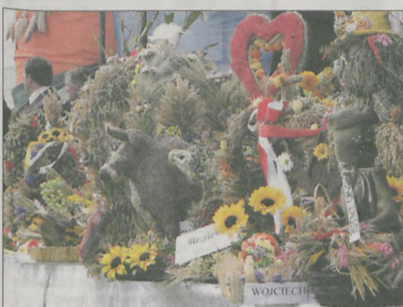
Delegacje z poszczególnych wsi przekazały gospodarzom gminnych dożynek pamiątkowe figurki