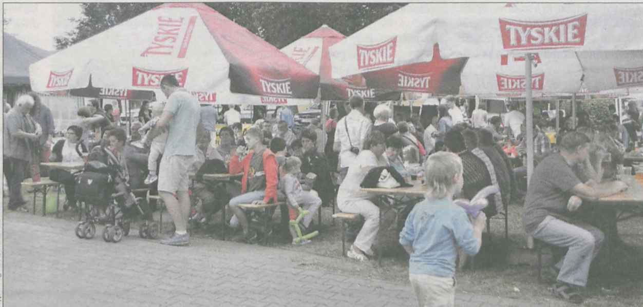
Znalezienie wolnego miejsca graniczyło z cudem. - W następnym roku przyda się więcej stołów i ławek - komentowali organizatorzy