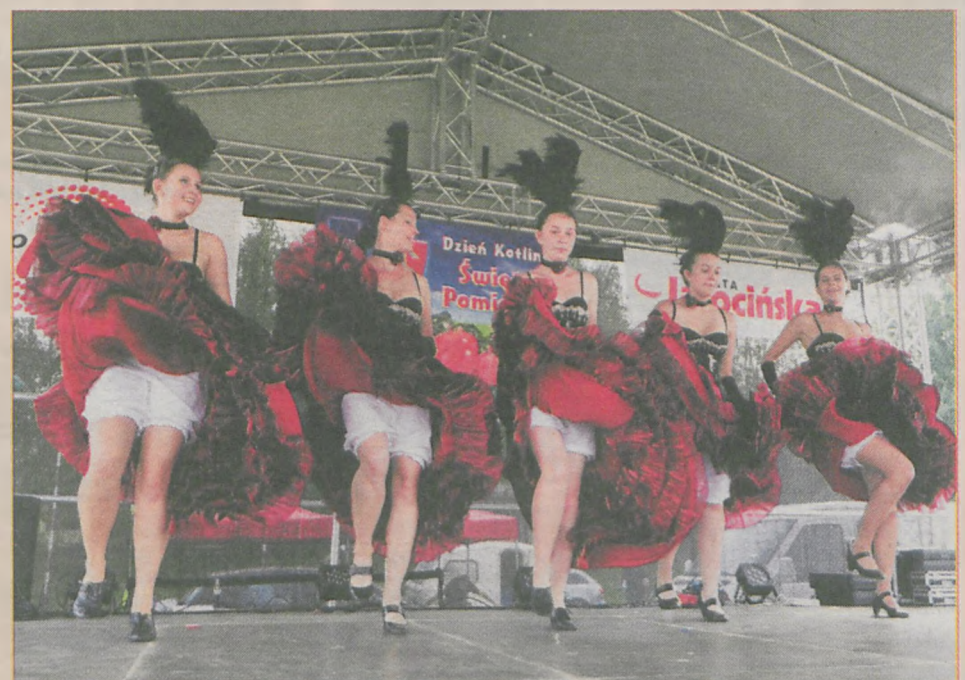
Na scenie zaprezentował się m.in. kabaret „Babiniec”