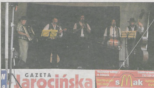
Kapela „Wyrzynarka” cieszyła publiczność znanymi i lubianymi piosenkami ludowymi