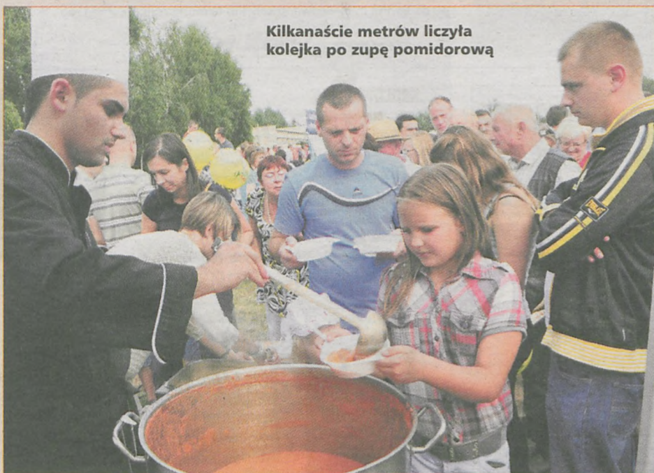
Kilkanaście metrów liczyła kolejka po zupę pomidorową

GAZETY JAROCIŃSKIEJ nr 36 (325) 6 września 2013 r. DODATEK BEZPŁATNY | ISSN 1896-8104