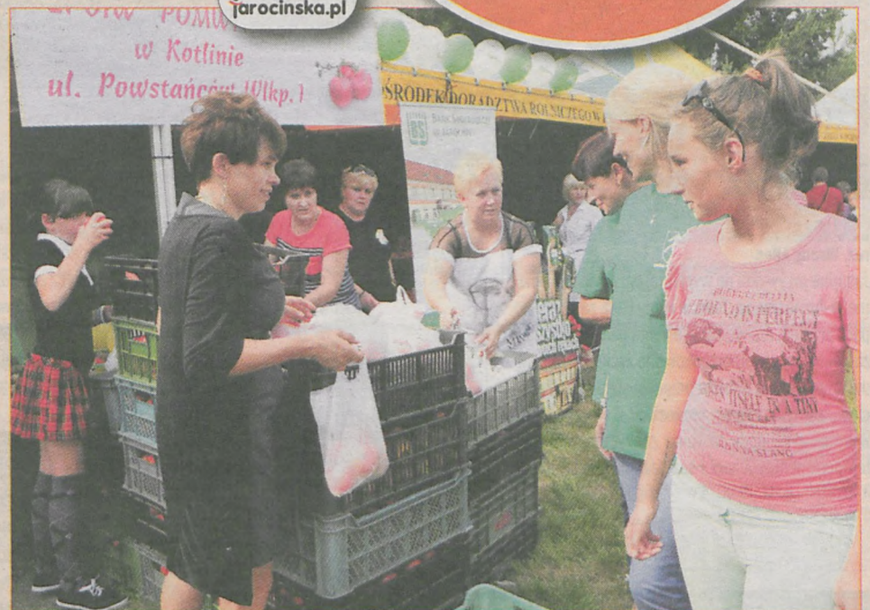
Grupa producentów „Pomwitrus” rozdała tonę pomidorów

Zjedzono 100 litrów zupy pomidorowej, rozdano 1.000 kg pomidora i zużyto 2.500 jednorazowych naczyń. Tak w statystykach wyglądał Dzień Kotlina - Święto Pomidora.