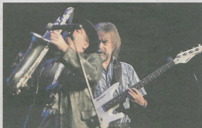
Artyści z zespołu „The Colors” kazali publiczności długo na siebie czekać. Plenerowy koncert na polanie rozpoczął się z ponad 20-minutowym poślizgiem. W trakcie koncertu publiczność przekonała się jednak, że warto było czekać na ten występ