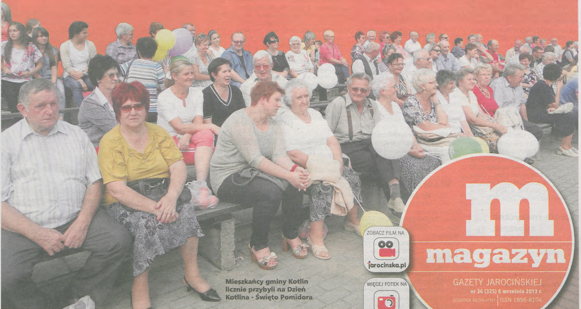
Mieszkańcy gminy Kotlin licznie przybyli na Dzień Kotlina - Święto Pomidora