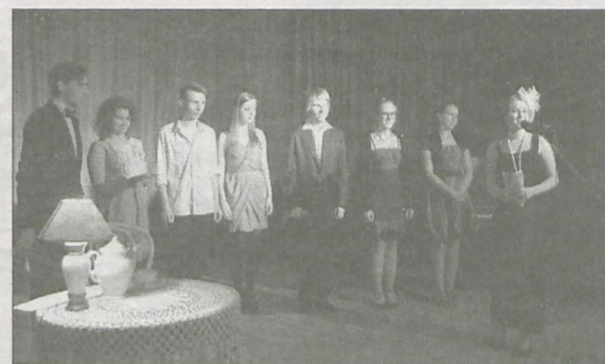
Absolwenci Liceum Ogólnokształcącego im. Tadeusza Kościuszki w Jarocinie doskonale wczuli się w atmosferę dawnych kabaretów