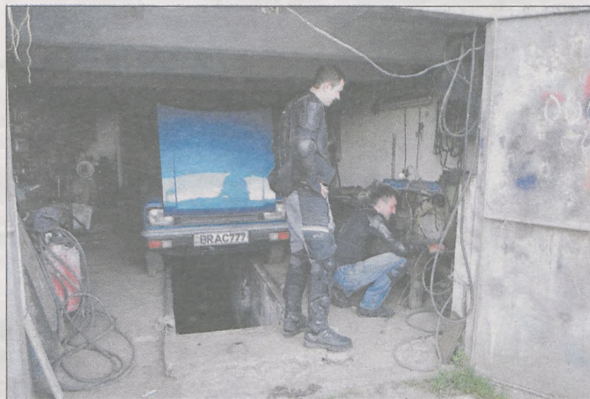
Jednego z chłopaków na granicy mołdawsko-ukraińskiej dopadł pech. Pod naporem bagażu (jednoślady z załadunkiem ważyły ok. 300 kg) złamała się nóżka od motocykla. W niewielkiej miejscowości znaleźli przydomowy warsztat samochodowy, w którym pospawali uszkodzony element. Przy okazji podziwiali remontowanego w warsztacie moskwicza