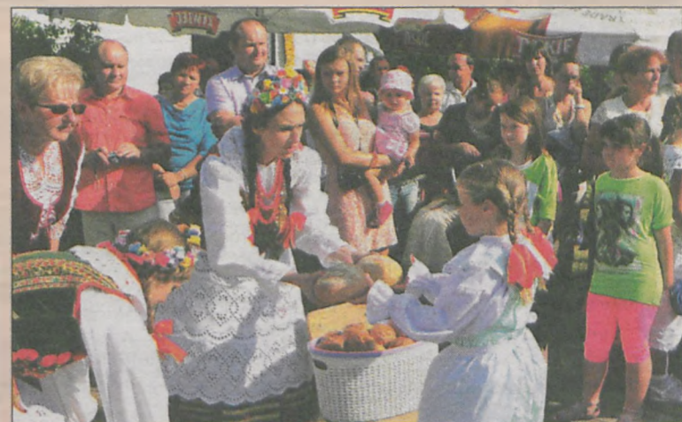
Wszyscy uczestnicy dożynek otrzymali po małym bochenku chleba, które rozdawały dzieci ze „Snutek”