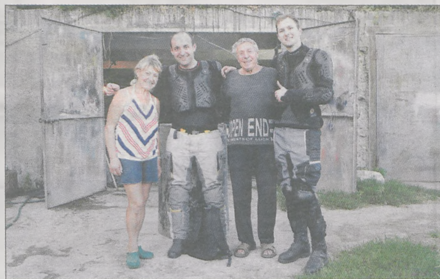
Właściciel warsztatu nie chciał nic za spawanie. Mało tego, zaprosił motocyklistów na obiad, a jego żona zaproponowała im nocleg. Musieli odmówić - przez usterkę i tak stracili dużo czasu. Ale takich życzliwych gestów ze strony Ukraińców i Mołdawian było dużo więcej