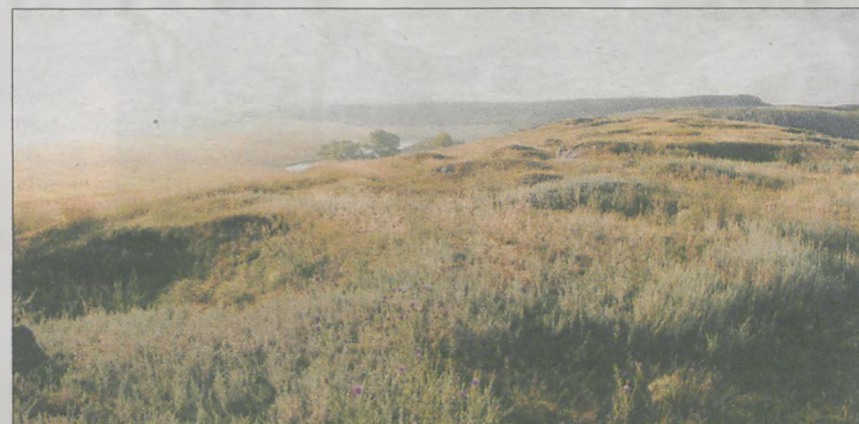
Pokonywali codziennie jak najdłuższe odcinki. Jechali, dopóki wystarczyło sił. Spali na łąkach, pod lasem albo na wzgórzu, takim jak to na zdjęciu. Niektóre rejony, zwłaszcza w obrębie Karpat, obfitowały w bajeczne krajobrazy