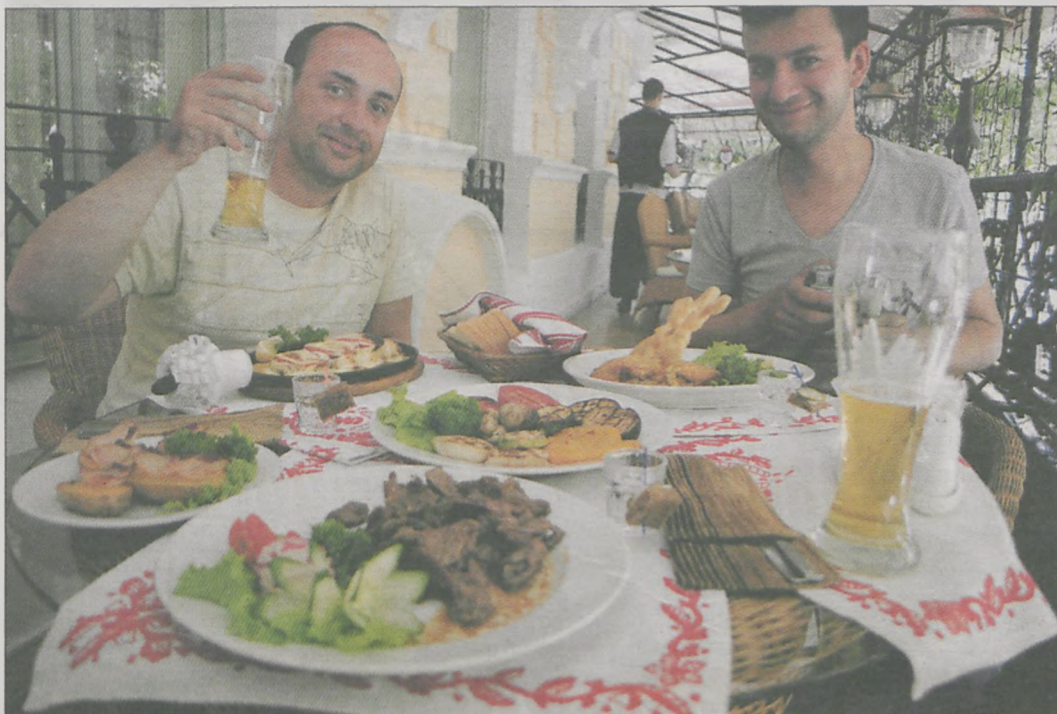
Jedyny obiad w restauracji zjedli w Odessie. Nie wyszło najtaniej, bo za konkretny posiłek trzeba było zapłacić ok. 80 zł. W ogóle ceny za wschodnią granicą nie są tak niskie, jak mogłoby się wydawać. Nawet paliwo nie jest dużo tańsze, litr kosztuje ok. 5 zł