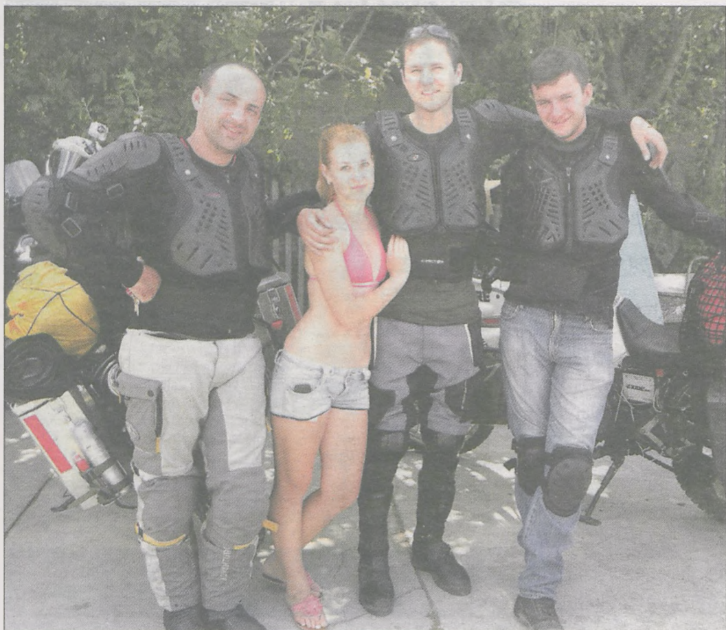
Nad Morzem Czarnym, w miejscowości Czernomorskoje motocykliści poznali lokalną młodzież. W oko wpadła im zwłaszcza jedna z Ukrainek. Spędzili tam dwa dni, pogoda dopisała. Woda w morzu była jednak zbyt zimna, by można się było wykąpać

4.000 KILOMETRÓW W DZIEWIĘĆ DNI NA MOTORACH