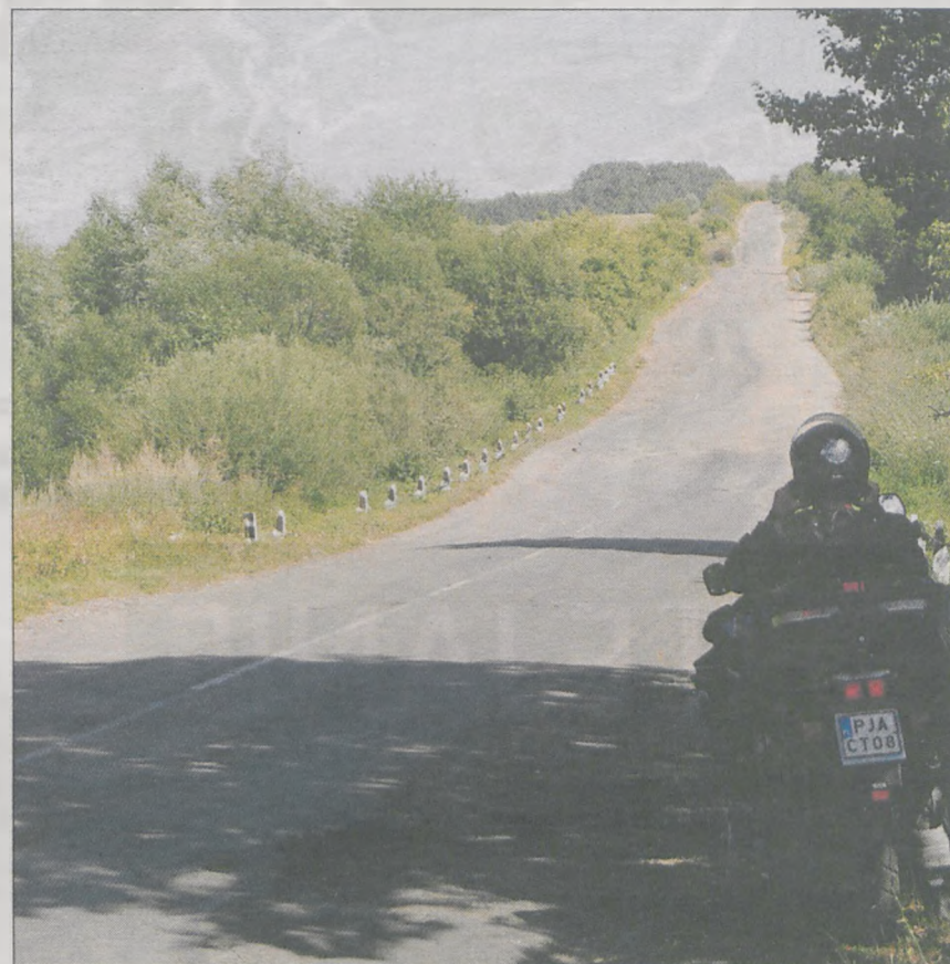
Zdarzało się, że kilkadziesiąt kilometrów trzeba było jechać drogami szutrowymi. To znacznie spowalniało podróż