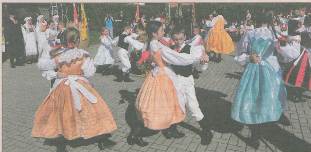
Część obrzędową rozpoczęły „Snutki”, które obtańczyły wieniec dożynkowy