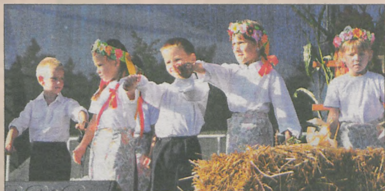
Uczniowie Niepublicznej Szkoły Podstawowej i Przedszkola w Prusach zaprezentowali „Abecadło o chlebie”