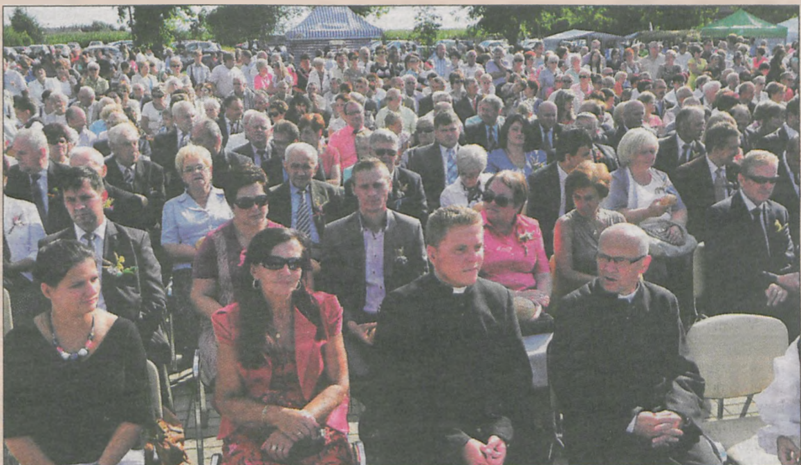
Dożynki w Zakrzewie zgromadziły prawdziwe tłumy. Dla wielu nie wystarczyło miejsc siedzących