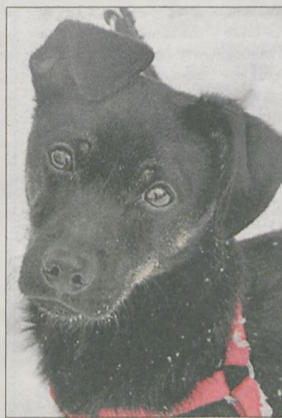
BAKAR Roczny, wykastrowany piesek. Choć może sprawiać wrażenie groźnego, to jest bardzo łagodny i lubi towarzystwo ludzi