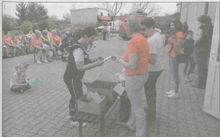
Wśród uczestników rajdu rozlosowano nagrody, głównie książki

RAJD „ODJAZDOWY BIBLIOTEKARZ” W JARACZEWIE