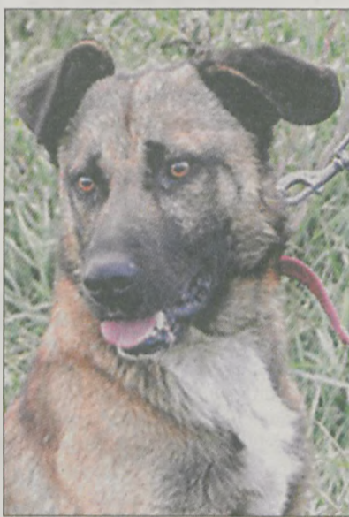
OTTO Posłuszny i spokojny, ładnie chodzi na smyczy. Uwielbia dzieci, ale nie przepada za kotami

telefonu 663/735-974 oraz za pośrednictwem e-maila: schronisko_radlin@op.pl lub stron: www.facebook.com/schronisko_radlin oraz www.schroniskoradlin.webs.com. (kg)