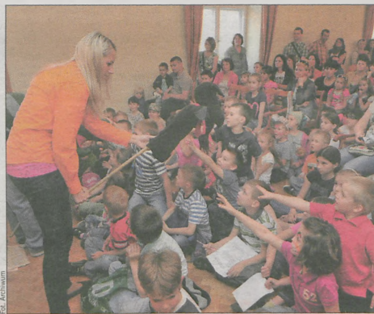
W zeszłym roku tematem przewodnim „Nocy Muzeów” w Jarocinie były zwierzęta. Sala sesyjna ratusza stała się miejscem spotkania z teatrem kukielkowym

Bezpłatne zwiedzanie wystaw i darmowe pokazy filmów dla dzieci - to główne atrakcje tegorocznej „Nocy Muzeów”. W Śmiełowie wszystko będzie się koncentrowało wokół prezentacji rękopisu „Pana Tadeusza” Adama Mickiewicza wraz z zabytkową szkatułą, udostępnionym przez Zakład Narodowy im. Ossolińskich we Wrocławiu, a w Jarocinie tematem przewodnim będą filmy animowane.