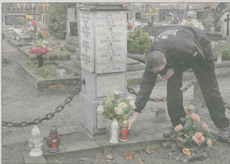
Młodzież z jarocińskiej „trójki” zapaliła znicze w miejscach pamięci ofiar katyńskich