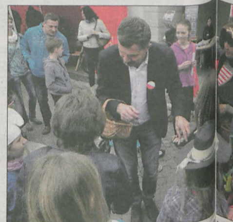
Z okazji Dnia Flagi na rynku burmistrz rozdawał przybory w kolorze biało-czerwonym. W niebo poleciały balony narodowych, a uczestnicy „żakinady” ułożyli z dwukolorowych kartek