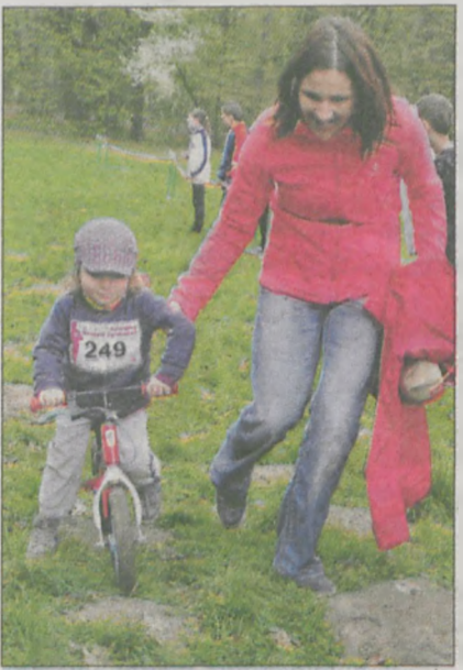
Antosiowi pomagała mama i rower