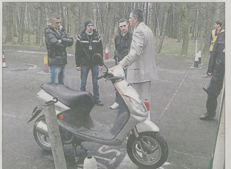
Awansem do finału wojewódzkiego zakończył się udział uczniów jarocińskiej „dwójki” w Ogólnopolskim Młodzieżowym Turnieju Motoryzacyjnym dla Szkół Ponadgimnazjalnych