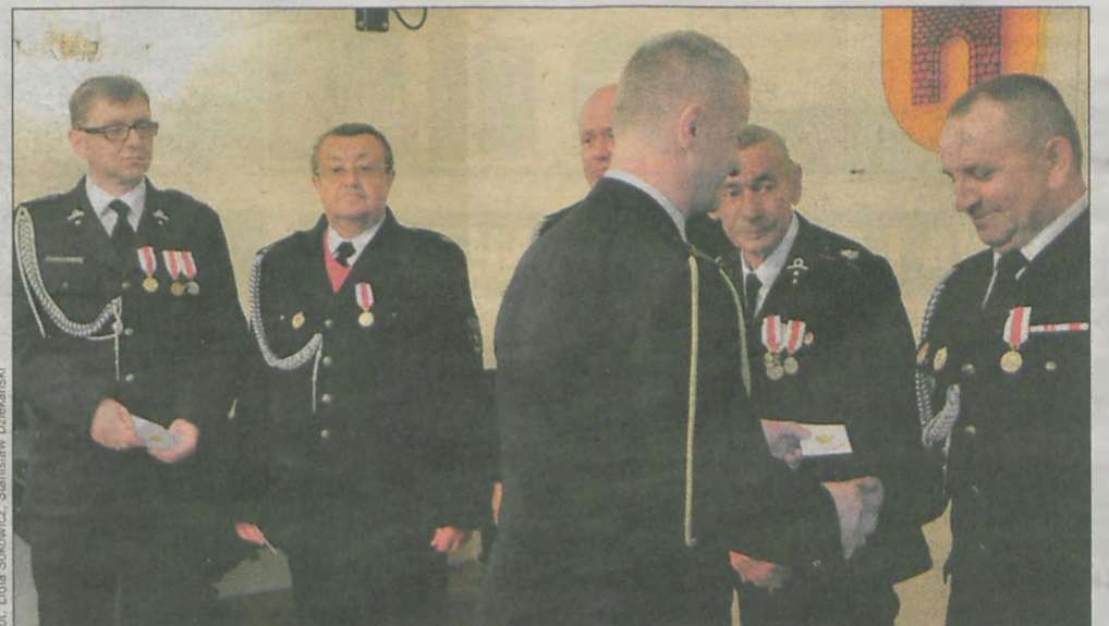
Z okazji Dnia Strażaka w ratuszu wręczono kilkadziesiąt odznaczeń, dyplomów i listów gratulacyjnych