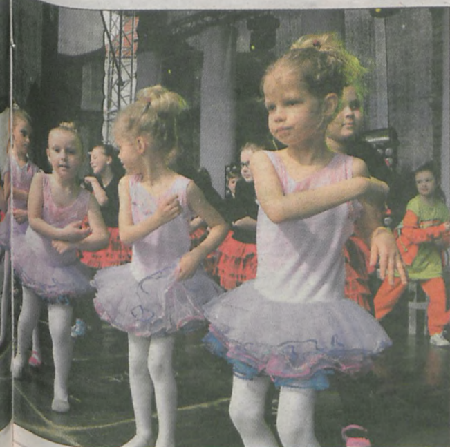
Scena w ostatnim dniu także należała przede wszystkim do bardzo młodych wykonawców