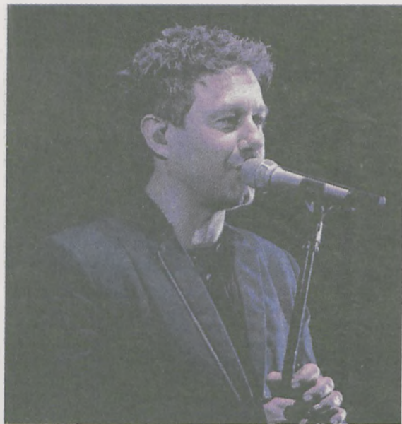
Na koncercie kończącym czterodniowe Dni Jarocina wystąpił Andrzej Piaseczny z zespołem

W tym roku powrócono do tradycji obchodzenia Dni Jarocina w maju. Przez cztery dni na scenie ustawionej w centrum miasta prezentowali się wykonawcy reprezentujący różne gatunki muzyczne: hip-hop, disco polo, rock i pop. Występowali zarówno profesjonalści, jak i amatorzy. Sześć zespołów rywalizowało o udział w konkursie młodych kapel, który odbędzie w lipcu w ramach festiwalu rockowego. Jarociński Ośrodek Kultury, będący głównym organizatorem „dni miasta”, pomyślał także o atrakcjach dla różnych grup wiekowych - od dzieci po seniorów.