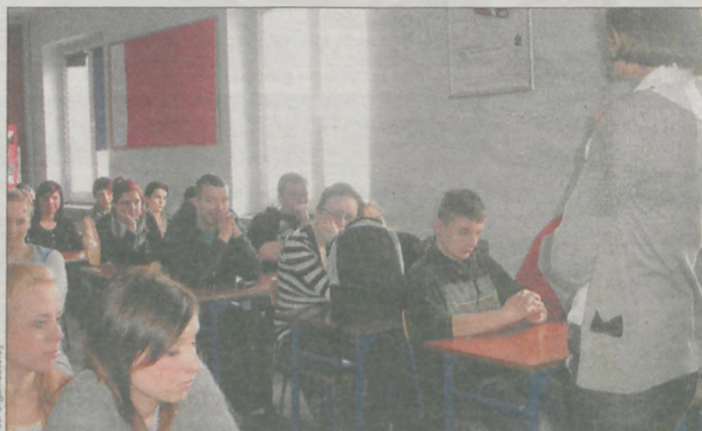
Uczestnikami szkolenia było 118 uczniów ostatnich klas szkoły zawodowej

jarocinska.pl ▶ KAŻDEGO DNIA NOWE INFORMACJE