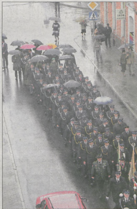
W strugach deszczu strażacy wraz z pocztami sztandarowymi przeszli najpierw do kościoła Chrystusa Króla, a później na jarociński rynek