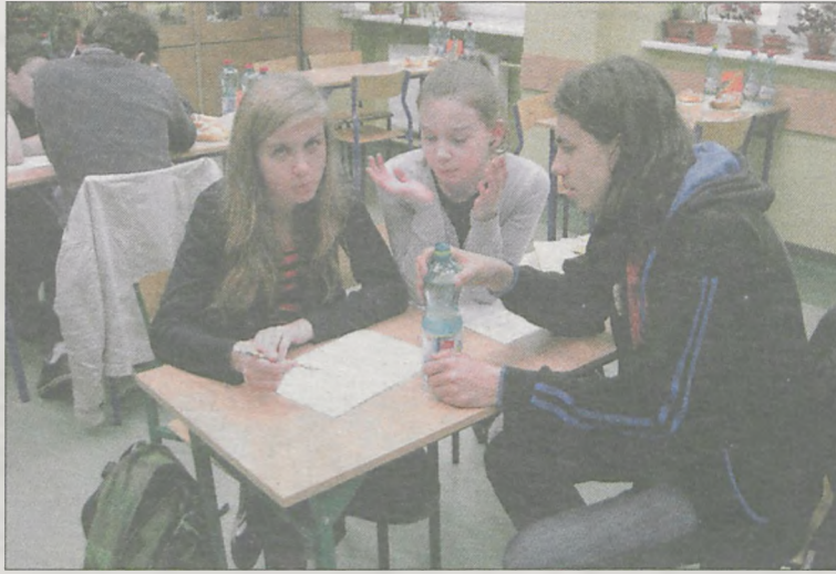
Pytania konkursowe dostarczyło Nadleśnictwo Jarocin

zespołów z Polski spotka się w maju na Krajowym Finale w Szkole Głównej Gospodarstwa Wiejskiego w Warszawie. Zwycięzcy we wrześniu w Portugalii będą rywalizować z laureatami z innych krajów europejskich, między innymi z Estonii, Czech, Cypru, Belgii, Austrii, Niemiec, Finlandii, Litwy, Grecji, Węgier.