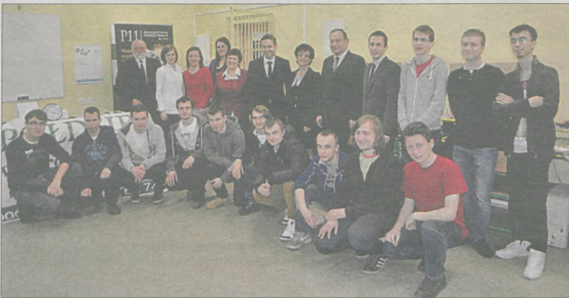
Konkurs w tym roku objął swym zasięgiem trzy powiaty

W Zespole Szkół Ponadgimnazjalnych nr 1 w Jarocinie odbyła się VI edycja Konkursu Informatycznego. Po raz pierwszy rywalizacja objęła swym zasięgiem placówki z powiatów sąsiadujących, zyskując rangę regionalną. W zmaganiach wzięło udział 42 uczniów ze szkół ponadgimnazjalnych Krotoszyna, Pleszewa i Jarocina.