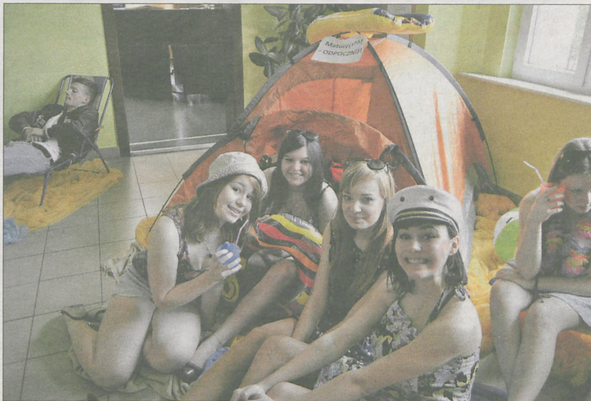
Maturzyści z „jedynek” w oryginalny sposób pożegnali się ze szkołą

Plaża, leżaki, kapelusze, słoneczne okulary i kolorowe sukienki dziewczyn - w takiej scenarii maturzyści z jarocińskiej „jedynek” postanowili odpocząć po 3 latach wyłożonej pracy i w oryginalny sposób pożegnać się z nauką w szkole.