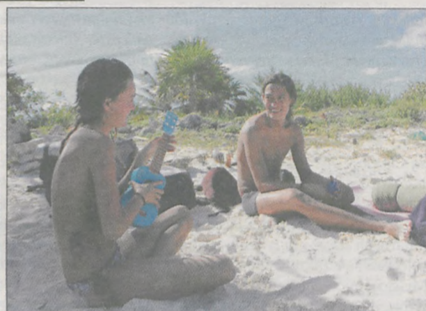
Na jednej z plaż w okolicach Tulum, gdzie wcześniej zatrzymaliśmy się na noc