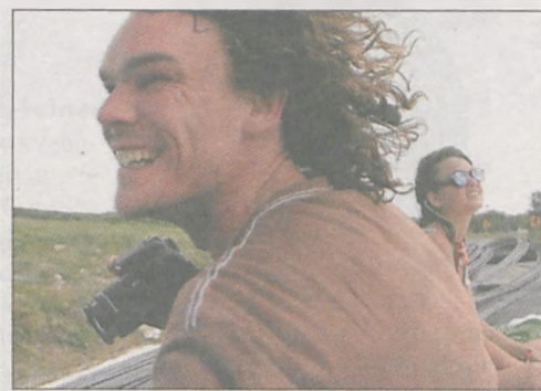
Kuzyn na otwartej pacy autostopu