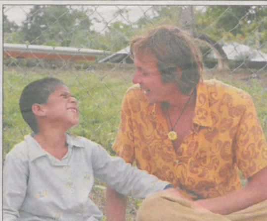
W małej wiosce przy dżungli, gdzie robiliśmy zapasy wody i prowiantu, naszym odmiennym wyglądem najbardziej zainteresowane były dzieci