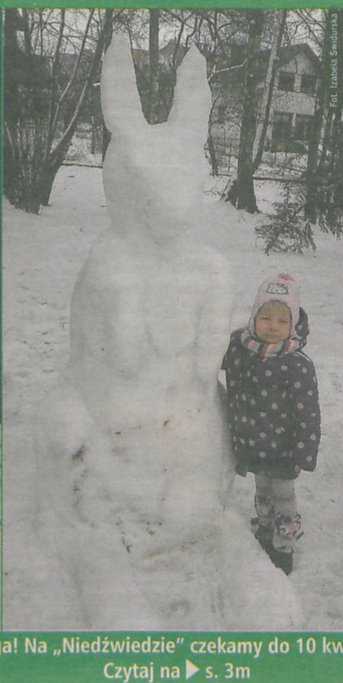
Fot. Izabela Świdulska