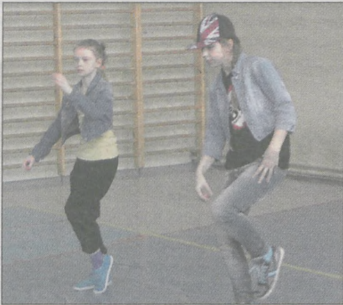
Uczniowie m.in. śpiewali, tańczyli i przeprowadzali doświadczenia

Uczestnicy śpiewali piosenki z repertuaru popularnych polskich wykonawców. Były pokazy tańca hip-hop. Uczniowie zaprezentowali swoje zdolności plastyczne i sportowe. Przedstawili również przykłady ciekawych doświadczeń przyrodniczych. W pokazie talentów wzięło udział 33 uczniów. Publiczność nagradzała wykonawców gromkimi oklaskami, a rada rodziców ufundowała dla nich drobne nagrody. (akf)