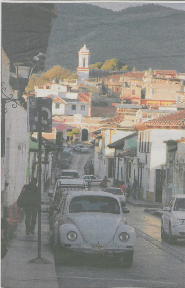
Uliczka w Palenque