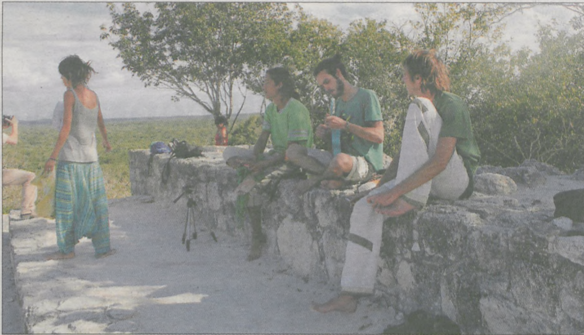
Szczyt piramidy w Calacmul