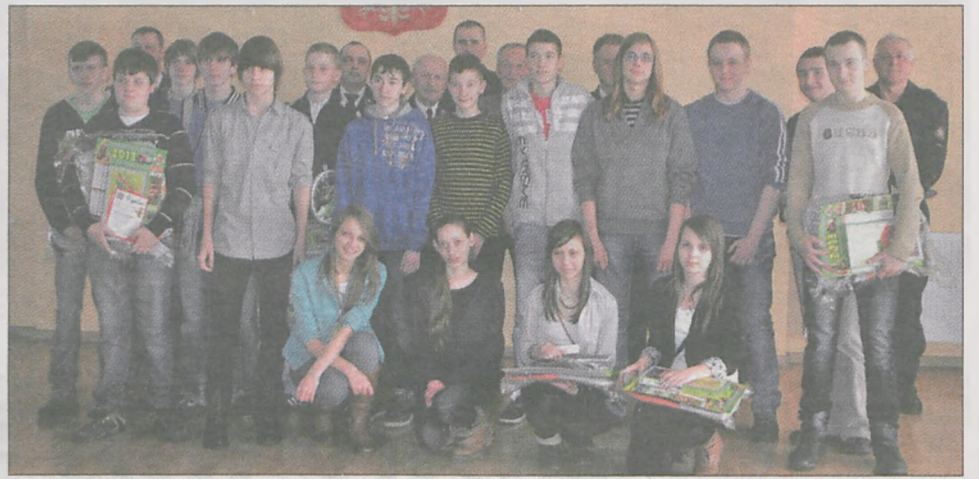
(era) Gimnazjaliści do wspólnego zdjęcia stanęli z organizatorami i jury konkursu

Najliczniejszą grupę stanowili uczniowie gimnazjów - 17 osób. Młodzi pożarnicy rozwiązywali test. Najlepsi będą reprezentowali nasz teren w zmaganiach wojewódzkich, które odbędą się w Ostrowie Wielkopolskim. Laureaci konkursu otrzymali mp4, słuchawki stereofoniczne, piłki, zestawy do badmintonu i tenisa stołowego, plecaki, gry planszowe oraz czujki dymu. Na upominki wydano około 2.000 zł. Dla pozostałych uczestników konkursu przygotowano pamiątkowe dyplomy.