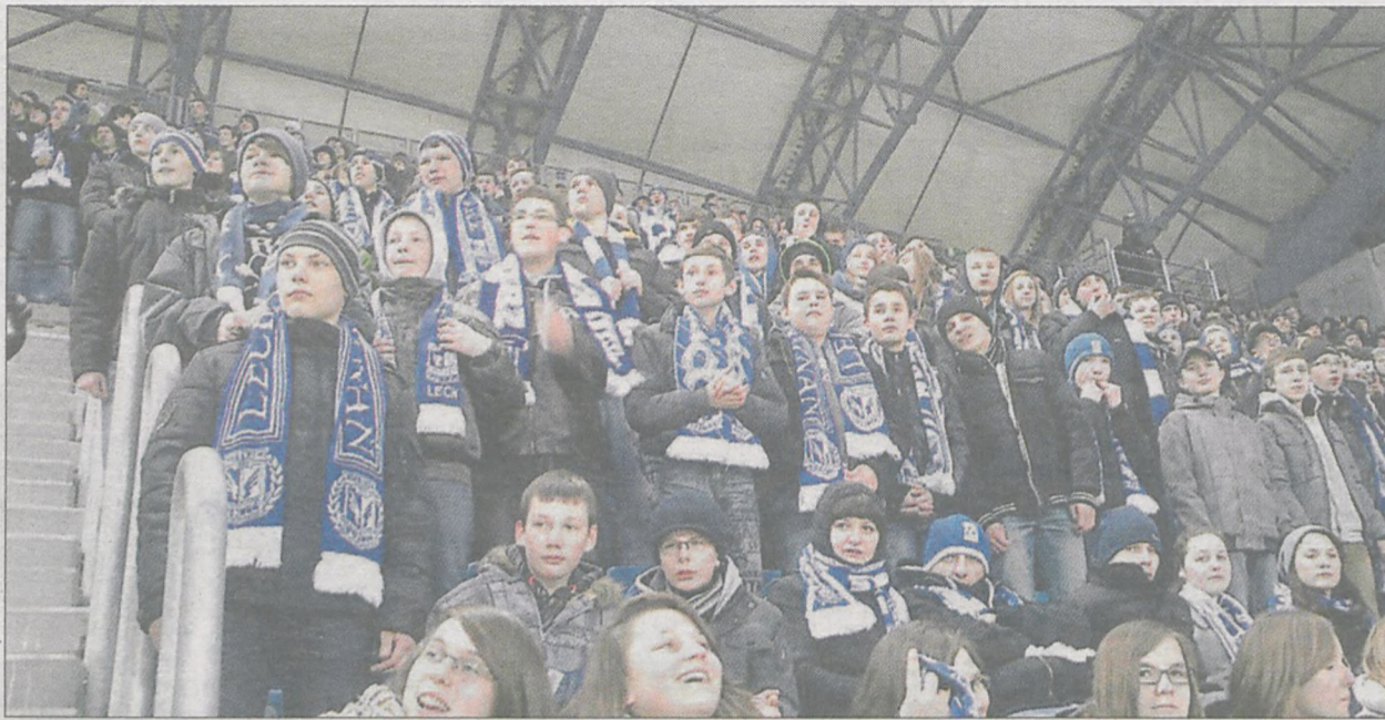
Zdaniem gimnazjalistów pozytywnych wrażeń nie zakłóciło nawet przenikliwe zimno. - Może tylko trochę rozczarował bezbramkowy remis Kolejorza - komentuje jeden z żerkowskich kibiców