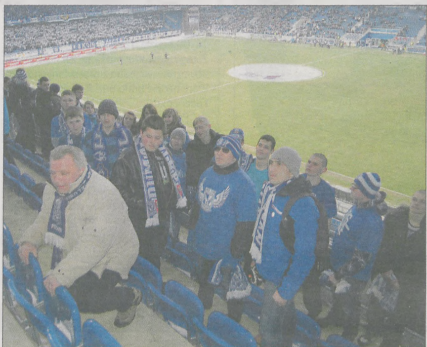
Gimnazjaliści mogli za darmo obejrzeć mecz piłkarski ekstraklasy