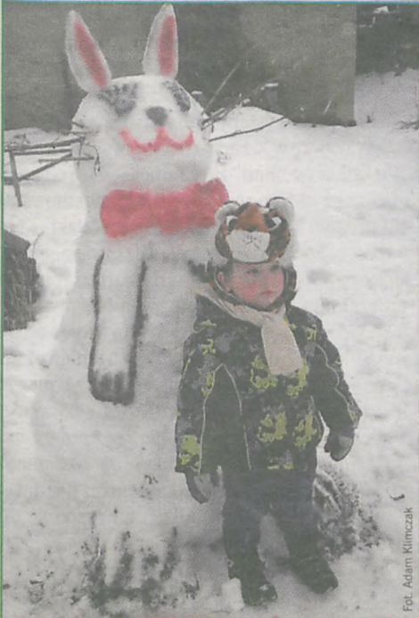
Fot. Adam Klimczak