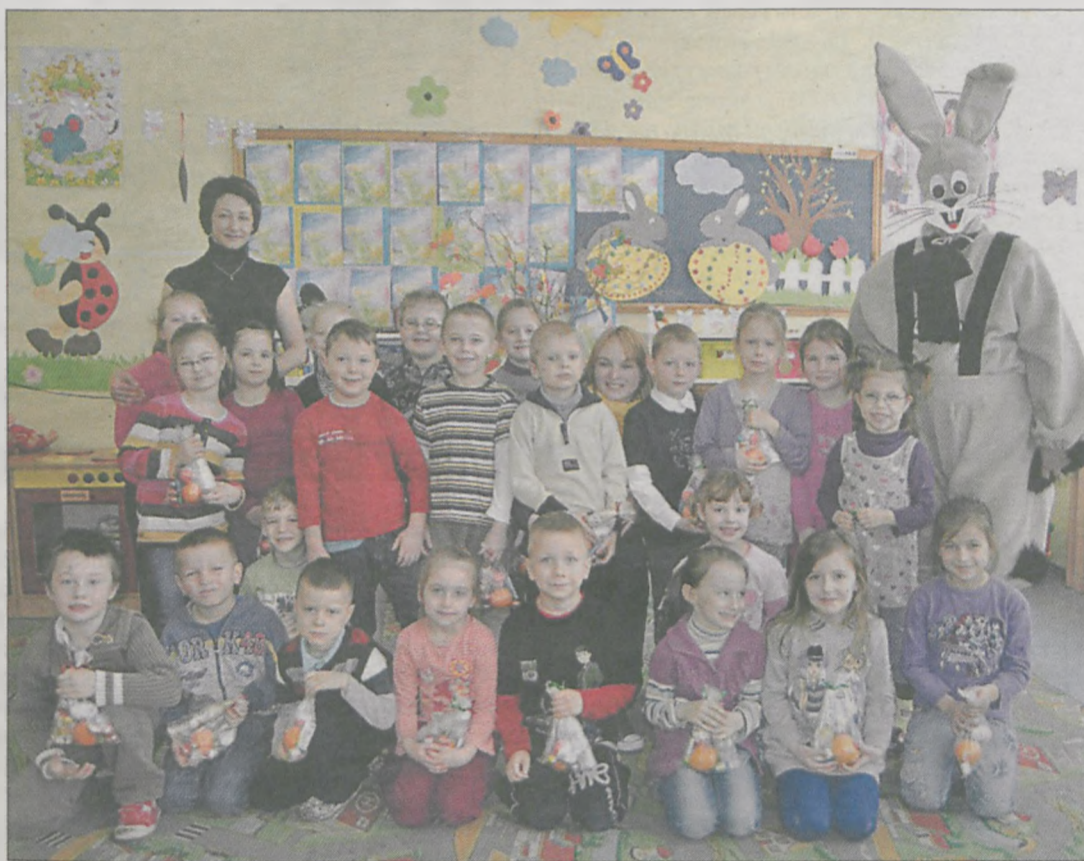
Dzieci chętnie się fotografowały wielkanocnym gościem