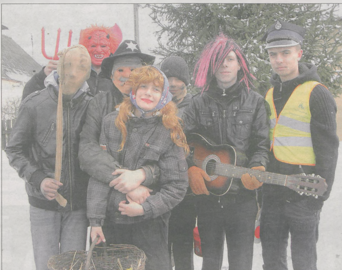
Młodzi mieszkańcy Wolicy Koziej mimo zimy zadbali o wielkanocną tradycję