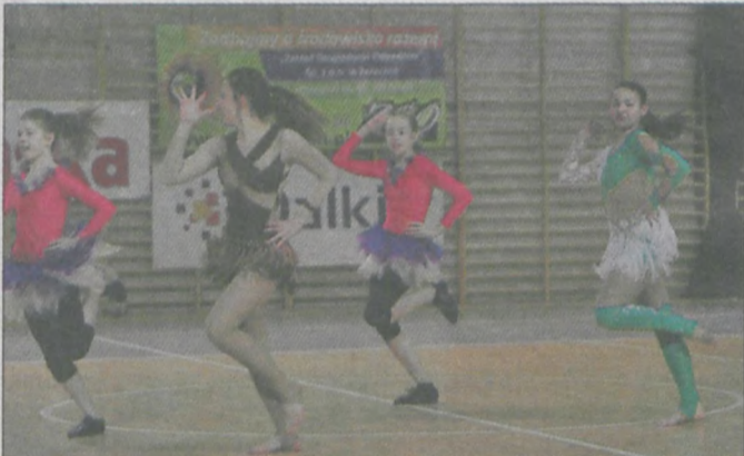
Turniej w Dwa Ognie uświetniły występy taneczne. Kilka pokazów zaprezentowała Szkoła Tańca JAST