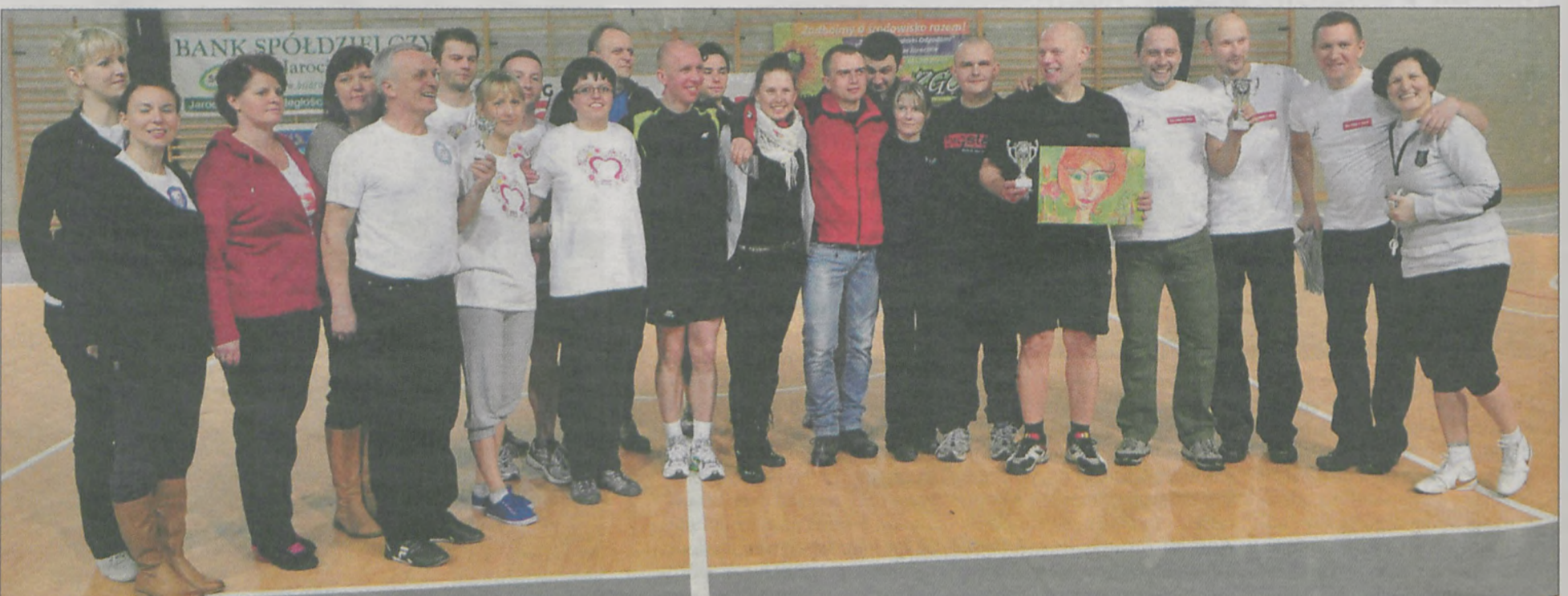
Wspólne zdjęcie drużyn, które wzięły udział w Turnieju w Dwa Ognie