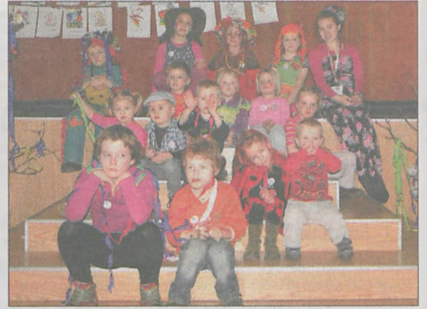
Autorzy kolorowanek z Nowego Miasta