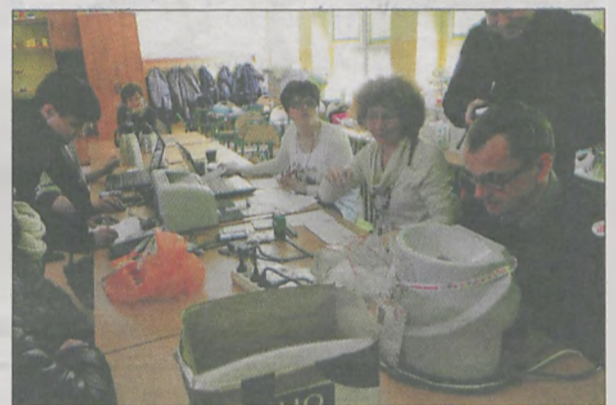
Sztab Wesołych Ogrodników. 12 godzin ciężkiej pracy