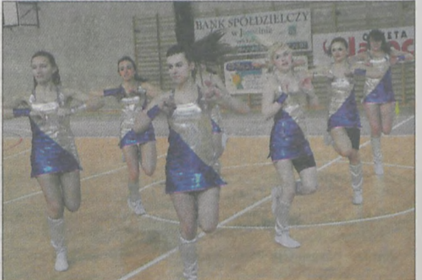
Grupa aerobiku z Zespołu Szkół Ponadgimnazjalnych nr 2