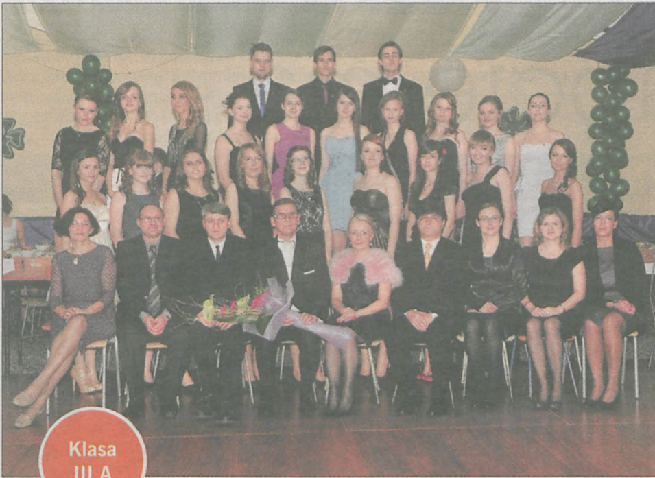
Klasa III A