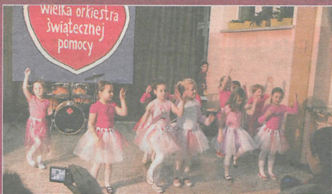
Sztab WOŚP działający w Gimnazjum w Kotlinie oprócz kwesty zorganizował także imprezę. Były występy uczniów i licytacje