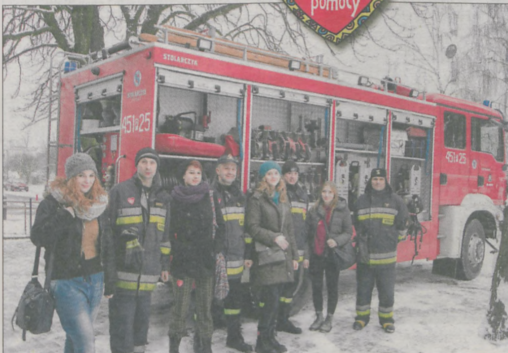
Na rzecz orkiestry w Jarocinie działa nie tylko młodzież, ale również fryzjerzy i strażacy