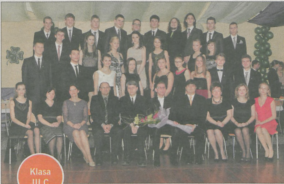
Klasa III C