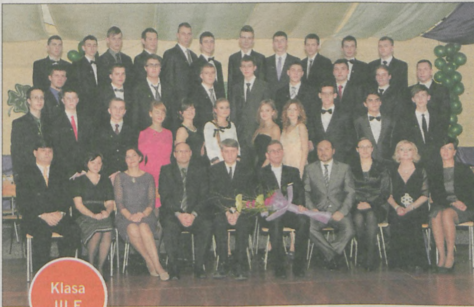
Klasa III E