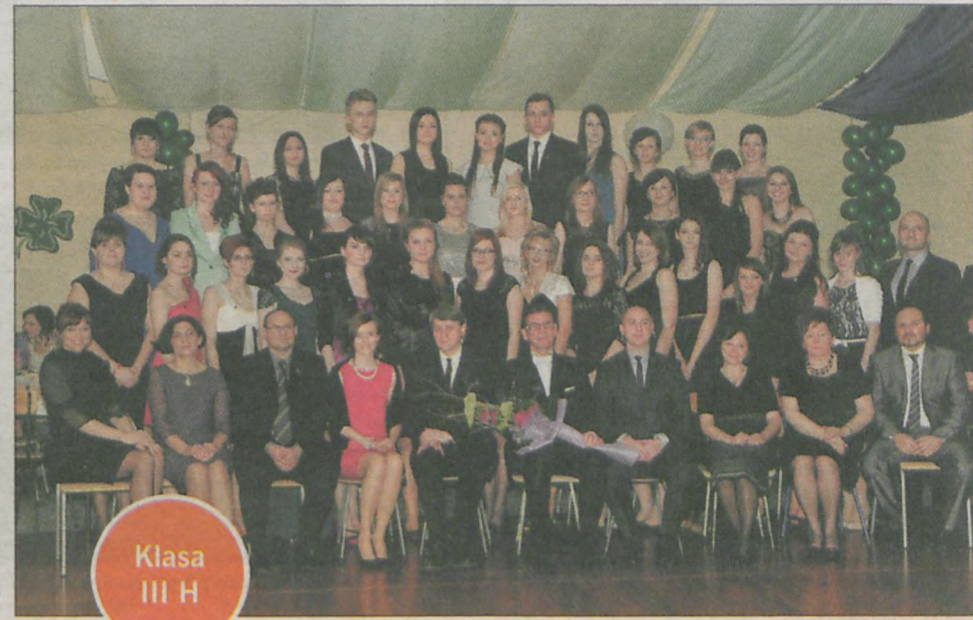
Klasa III H