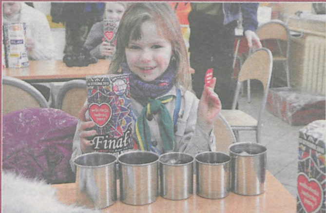
W mroźny dzień wolontariusze mogli liczyć na kubek gorącej herbaty