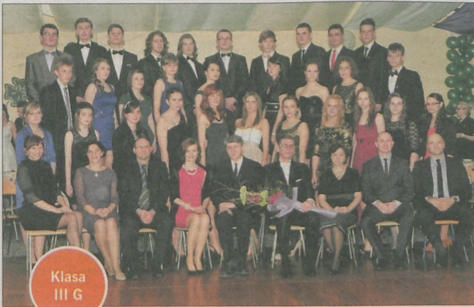
Klasa III G