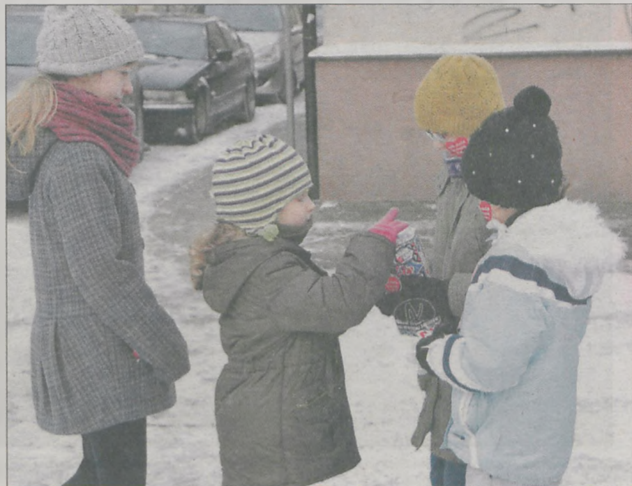
Kwestowano przede wszystkim pod kościołami