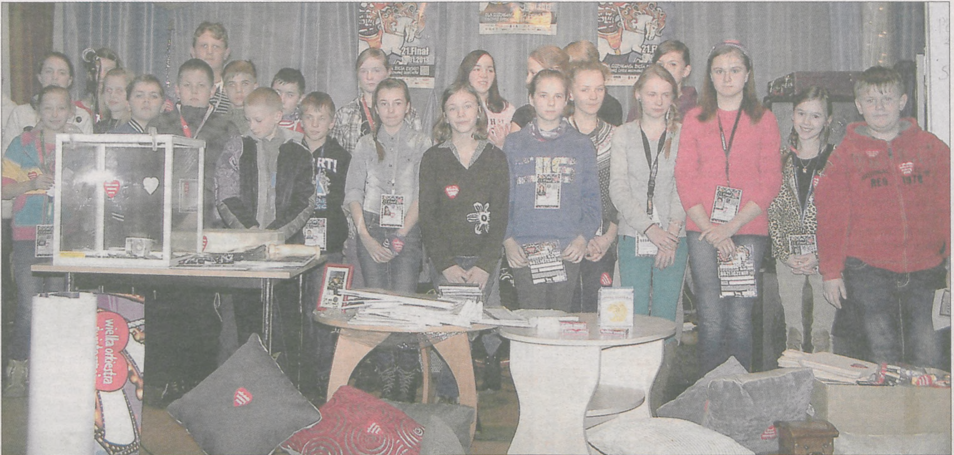
Sztab w Nowym Mieście liczył 30 wolontariuszy, którzy z kwesty ulicznej zebrali 5.929,91 zł. Z licytacji różnych przedmiotów uzyskano 1.245,56 zł