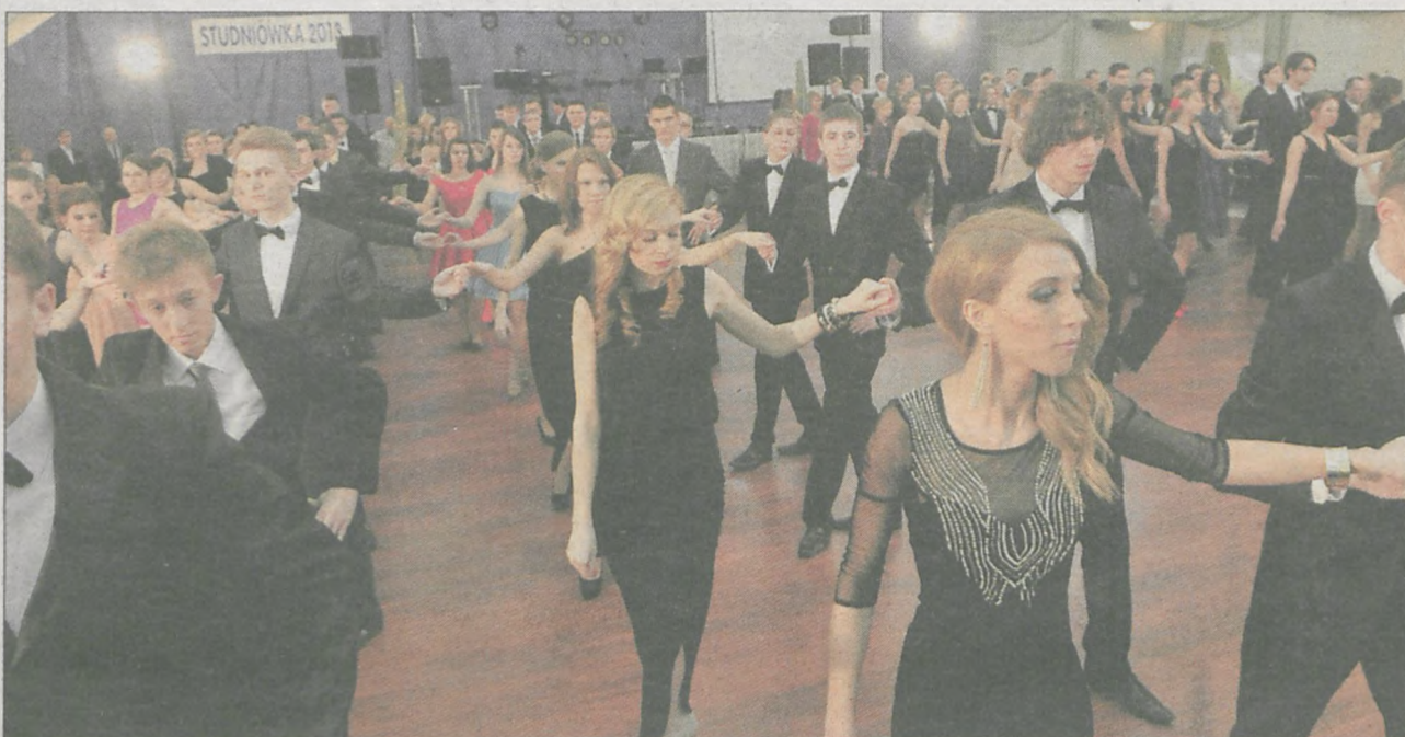
Bal rozpoczął się tradycyjnym polonezem