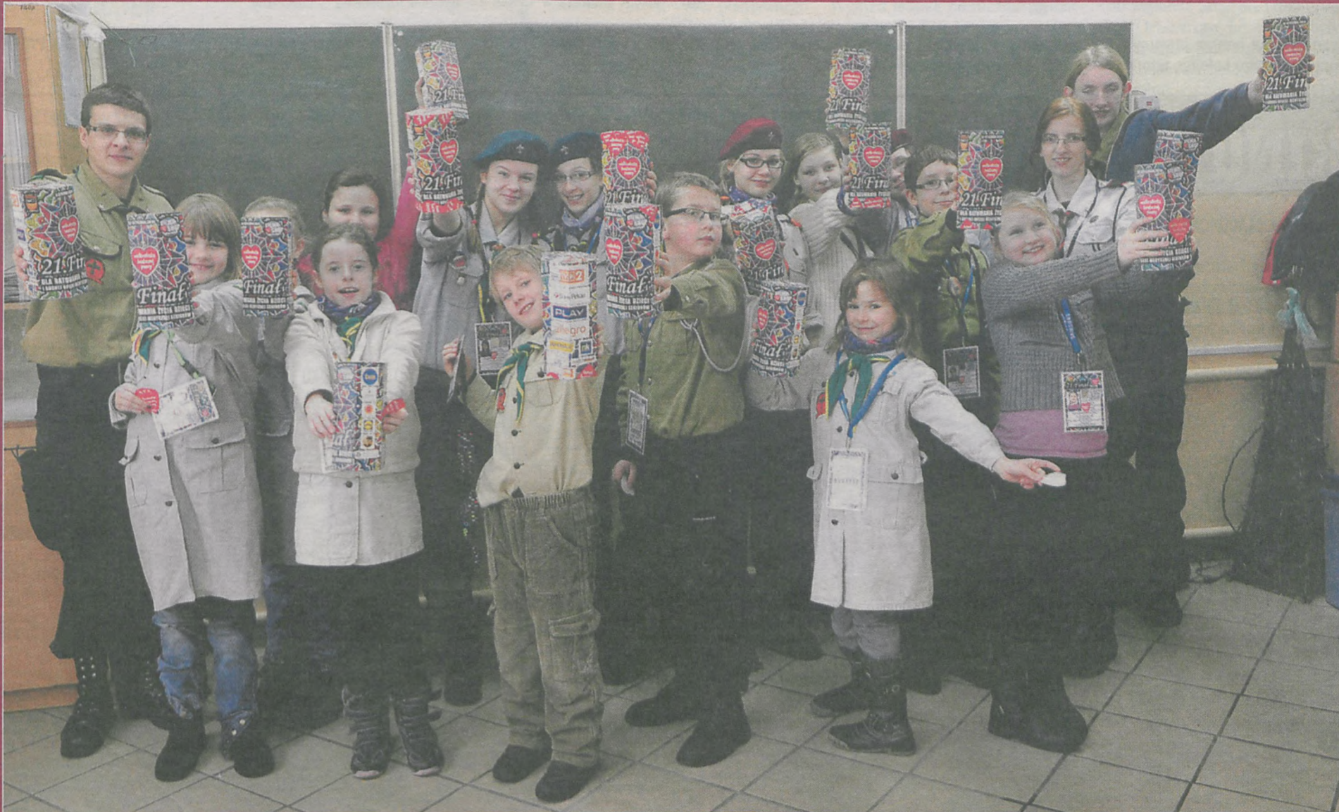
Jak co roku sztab Organizacji Harcerskiej „Rodło” mieścił się w pomieszczeniach jarocińskiego ogólniaka