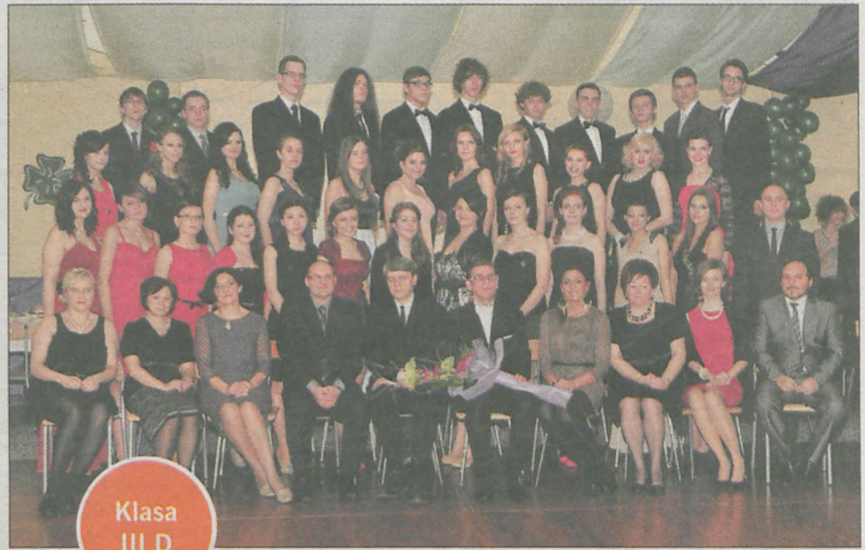
Klasa III D