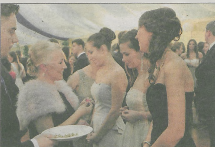
Jeszcze tylko symboliczna koniczynka i można się było bawić do białego rana

Balem studniówkowym maturzystów z jarocińskiego ogólniaka i szkoły w Tarcach został zainaugurowany okres studniówek na Ziemi Jarocińskiej.