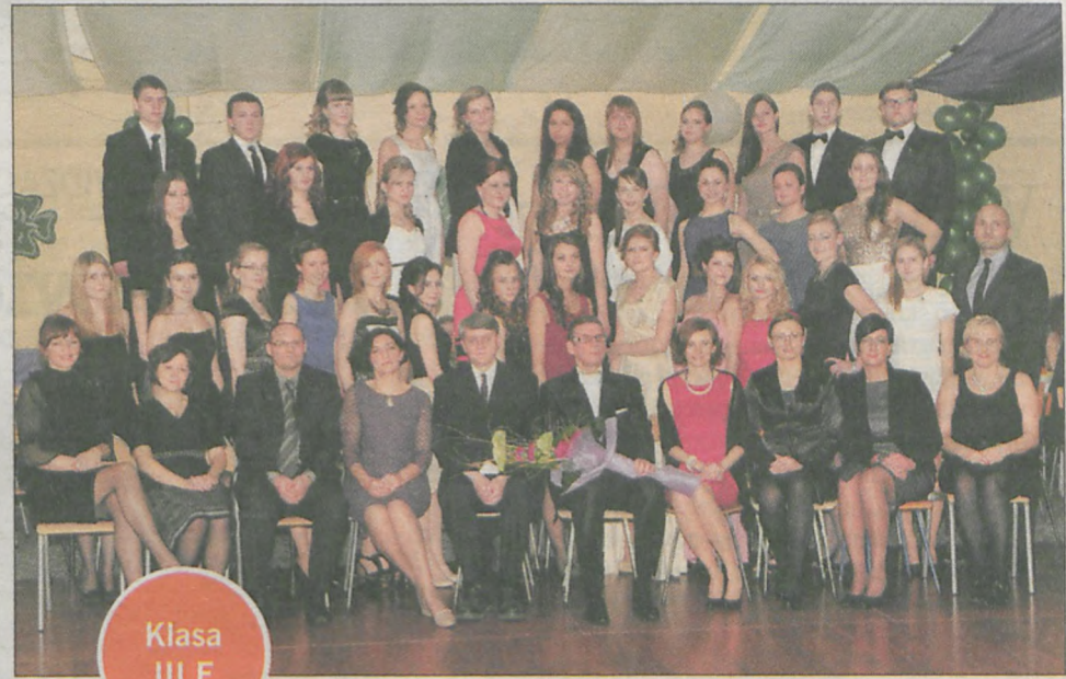
Klasa III F