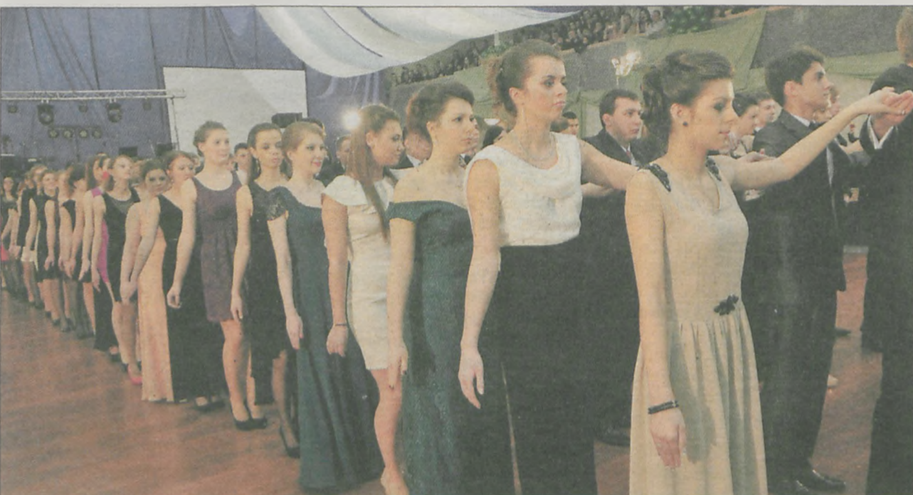
Dziewczęta wybrały na ten pierwszy ważny bal w życiu najpiękniejsze kreacje