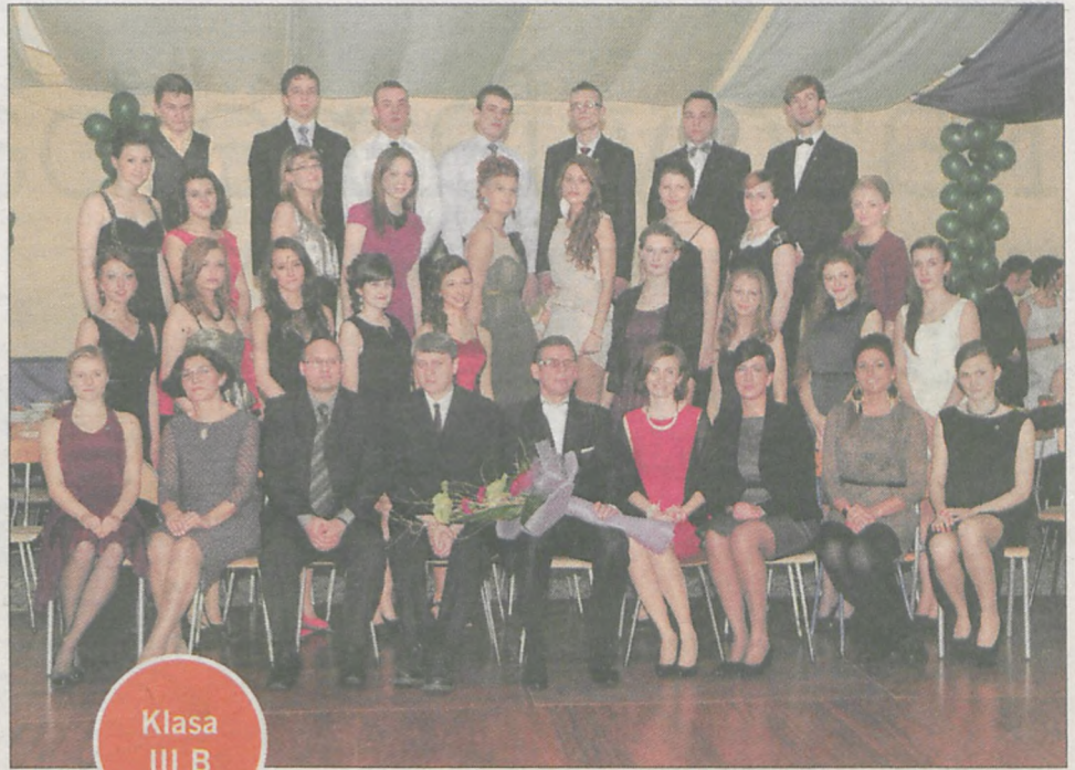
Klasa III B