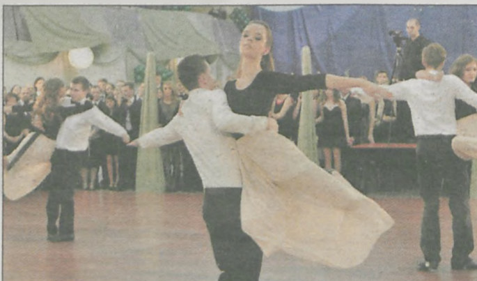
Kilka miesięcy trwały przygotowania - ale było warto - walc zatańczony przez maturzystów zrobił wrażenie na wszystkich