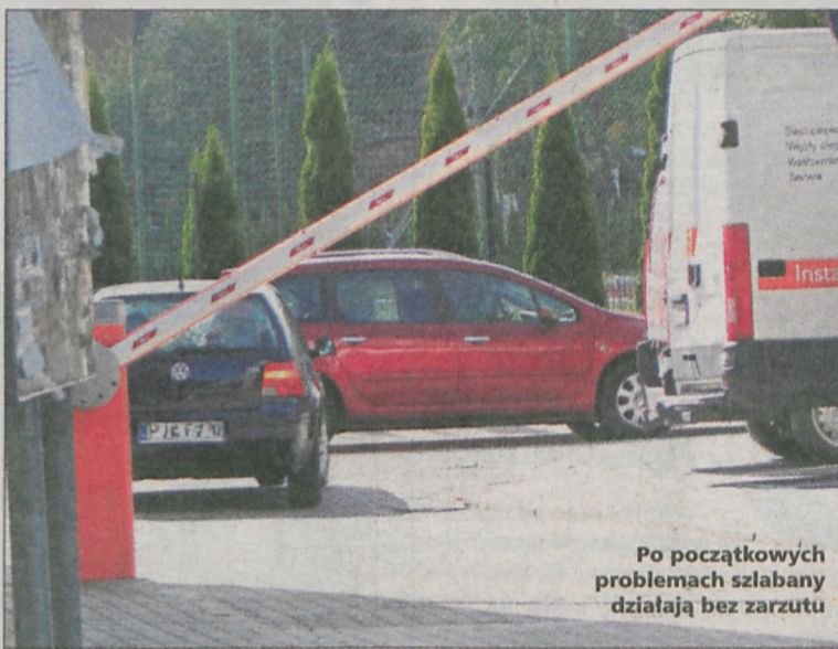
Po początkowych problemach szlabany działają bez zarzutu

zamontowania szlabanów, nie mogą wjeżdżać na teren osiedla. Prezes Niewiadomski, prezes spółdzielni twierdzi, że tego problemu nie da się rozwiązać. - W Polsce jest konkurencja na rynku i firm świadczących usługi kurierskie jest kilkanaście. Do tego mają niezliczoną ilość pojazdów, w związku z tym nie ma możliwości udostępnienia im wjazdu na osiedle. Kurier musi zaparkować poza osiedlem i zanieść paczkę. A to, że straci 5 czy 10 minut więcej - trudno. Przykro mi - tłumaczy.