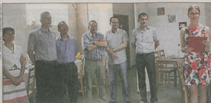
Inauguracja działalności Jarocińskiej Spółdzielni Socjalnej odbyła się w restauracji „Pasja” prowadzonej przez inną spółdzielnię socjalną, która jako pierwsza w Jarocinie ruszyła przed kilkoma tygodniami

Pracownicy spółdzielni zajmować się będą przede wszystkim porządkowaniem terenów zielonych, pomieszczeń w blokach, myciem okien na klatkach schodowych oraz utrzymywaniem czystości na osiedlach podległych jarocińskiej spółdzielni mieszkaniowej. Świadczyć też będą usługi dla osób indywidualnych. W przyszłości zamierzają poszerzyć swoją działalność między innymi o usługi kurierskie. (ann)