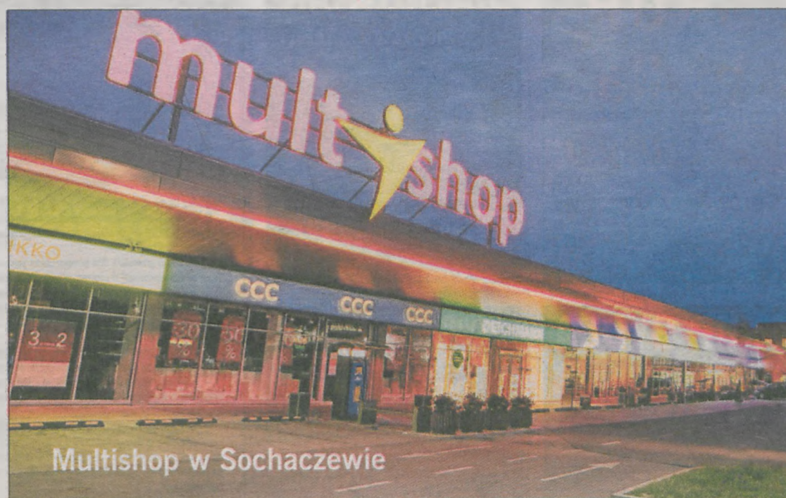
Multishop w Sochaczewie

się z przystawionego „rynku” do profesjonalnie zorganizowanych centrów handlowych. Trudno walczyć z tym trendem. Oczywiście kwestią jest brak odpowiedniej ilości miejsc parkingowych w centrach miast, które powstały setki lat temu i nie były przewidziane dla ruchu samochodowego. Jest to rzecz praktycznie nie do zmiany i borykają się z tym wszystkie miasta na świecie.