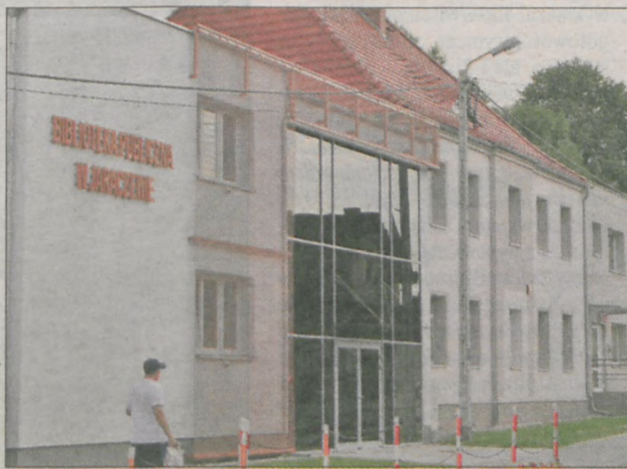
Jaraczewska biblioteka zyskała nowoczesny wygląd

telnia wyposażona została w sofę i fotele. Powstało pomieszczenie do organizacji spotkań, a także hall, w którym są toalety również dla niepełnosprawnych. - Wybudowano też pomieszczenie socjalne dla pracowników, którzy do tej pory nie mieli takiego miejsca. Tam jest też szyb windowy - wymienia dyrektorka.