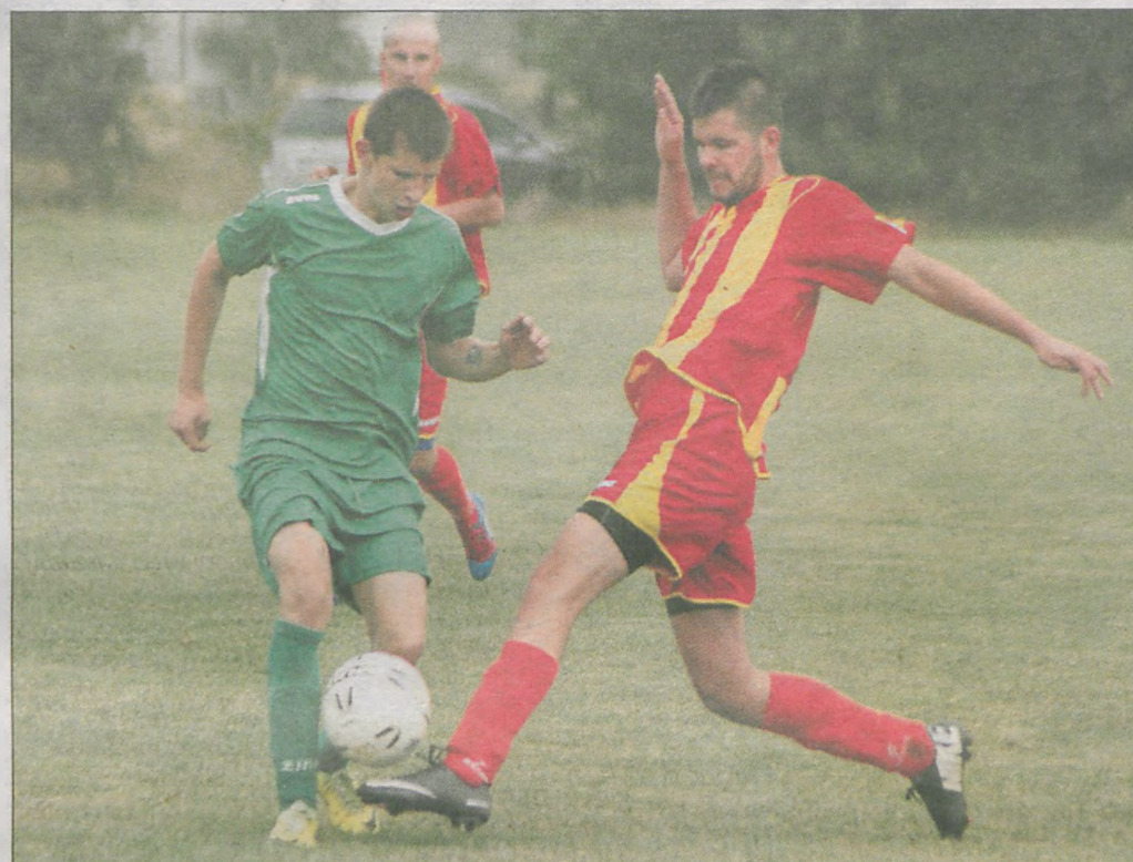
GKS Żerków na inaugurację pokonał spadkowicza z okręgówki - Żaki Taczanów