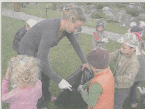
Dzieci z Niepublicznego Przedszkola „Tęcza” w Radlinie podczas sprzątania