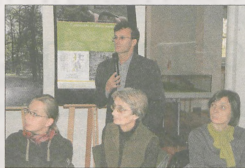
O boćkach opowiadał z ogromnym zapalem ornitolog i lider Południowowielkopolskiej grupy OTOP