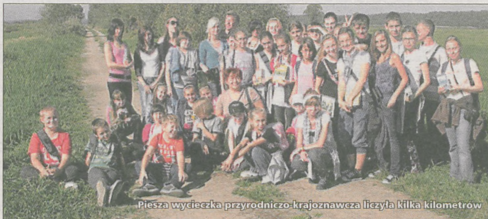
Pieszna wycieczka przyrodniczo-krajoznawcza liczyła kilka kilometrów

Dni Ptaków to wydarzenie, w którym może wziąć udział każdy, dlatego z roku na rok liczba osób zainteresowanych taką formą spędzenia czasu wolnego stale wzrasta. Jaraczewskie łąki są miejscem, gdzie można zaobserwować wiele gatunków ptaków, zwłaszcza dość dużych, co dla początkujących, młodych ornitologów jest bardzo ciekawe.