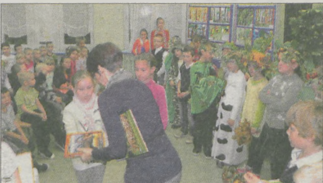
Wręczenie nagród za wyróżnione w konkursie plastycznym prace

Do programu włączają się głównie placówki oświatowe, samorządy, instytucje, przeróżne organizacje oraz firmy. Jednak jej głównymi beneficjentami są najmłodszy uczestnicy, przedszkolaki oraz uczniowie szkół podstawowych, gimnazjalnych i ponadgimnazjalnych (i bardzo dobrze). Dla przykładu w VIII edycji Święta Drzewa w 2010 roku przy szerokim udziale społecznym posadzono ponad 43 000 drzew! Przy okazji zebrano również 265 ton makulatury! W programie uczestniczyło ponad 43 000 osób! W tym roku program Święta Drzewa został objęty Patronatem Ministra Środowiska, Ministra Edukacji Narodowej, Prezydenta m. st. Warszawy. W naszej okolicy wydarzenie wsparło Starostwo Powiatowe w Jarocinie. Akcja została włączona w Kampanię Miliarda Drzew dla Planety pod patronatem UNEP (ONZ) oraz Międzynarodowego Roku Lasów. Święto drzewa i związane z jego obchodami wspólne sadzenie drzew to chyba jedyny z najbardziej sensownych sposobów przeciwdziałania zmianom klimatycznym. Trzeba podkreślić, że partnerem strategicznym programu są Lasy Państwowe.