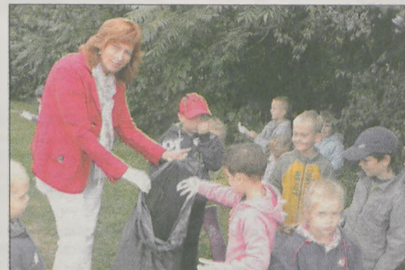
W Publicznym Przedszkolu nr 6 Jarzębinka w Jarocinie