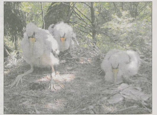
Piskląta bociana czarnego - gniazdo zlokalizowane w Szczonowie (leśnictwo Rozmarynow)

Praktycznie wszystkie boćki czarne znakowane w Południowej Wielkopolsce w latach 2003-2011 otrzymują dodatkowo specjalne, białe obrączki plastikowe na goleń, z wyraźnym kodem literowo-cyfrowym. Białe obrączki są możliwe do odczytania z daleka lunetą, co zrewolucjonizowało badania nad wędrówkami tego gatunku w porównaniu ze standardowymi obrączkami metalowymi, których numer z daleka odczytać jest skrajnie trudno.