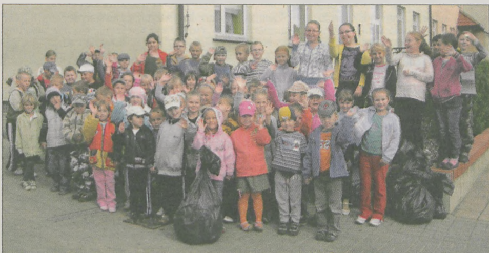
Niepubliczny Zespół Szkół w Łuszczanowie. Finał akcji przy budynku szkolnym