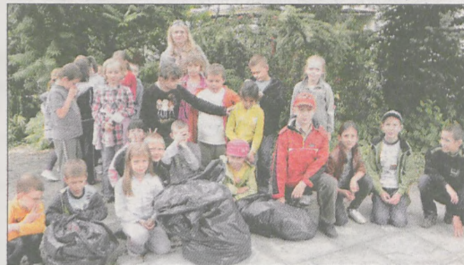
Najmłodszy uczestnicy - kolejna grupa ze szkoły w Bachorzewie k. Jarocina