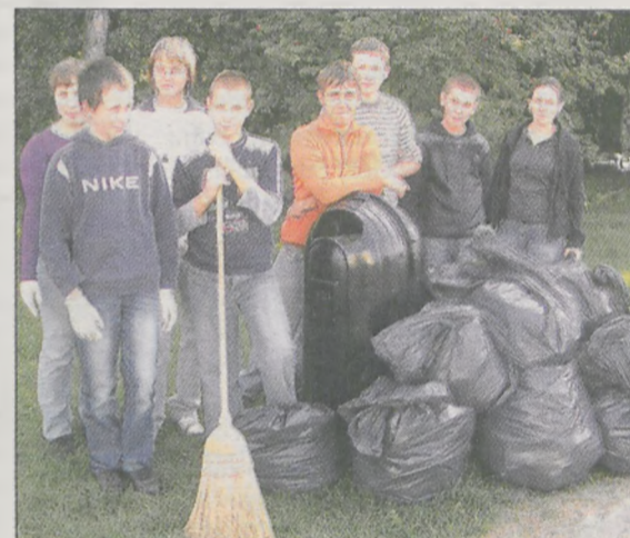
Okolice parku nieopodal szkoły. Dzielni uczestnicy akcji z Zespołu Szkół Specjalnych przy ul. Szubianki w Jarocinie