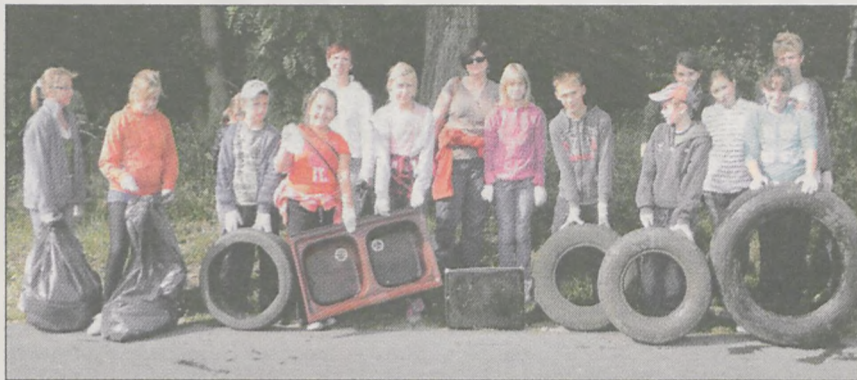
Uczniowie ze szkoły w Bachorzewie. Miejsce - nowo otwarta trasa do Wilkowyi, a tu tyle śmieci