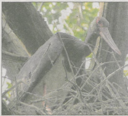
Dorosły bocian czarny z Czeszewa (22.06.11)