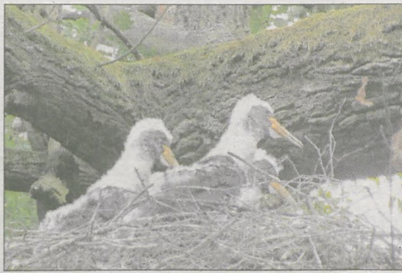
Młode bociany czarne - gniazdo w Czeszewie (23.06.11)