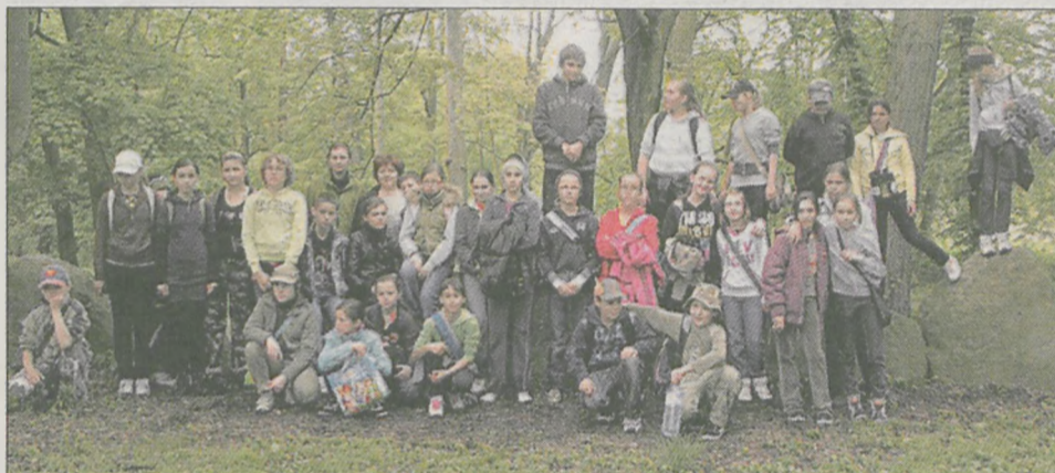
Jaraczewo. Uczniowie biorący udział w akcji porządkowania