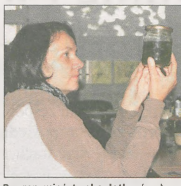
By zrozumieć, trzeba dotknąć - płazy w „realu”