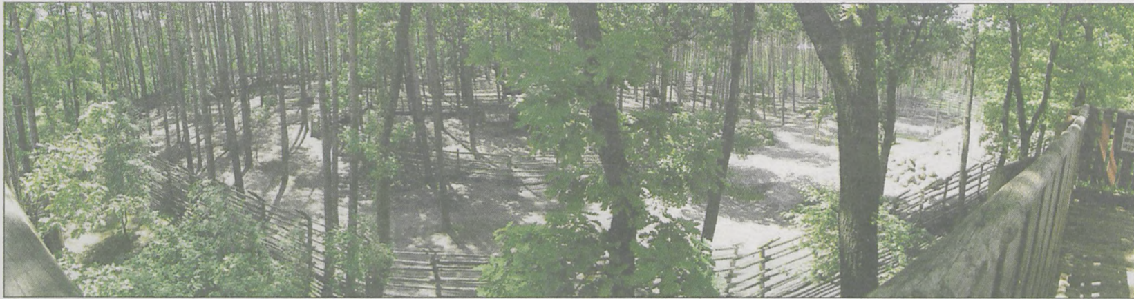
Infrastruktura Ośrodka Edukacji Leśnej w Grodziecu