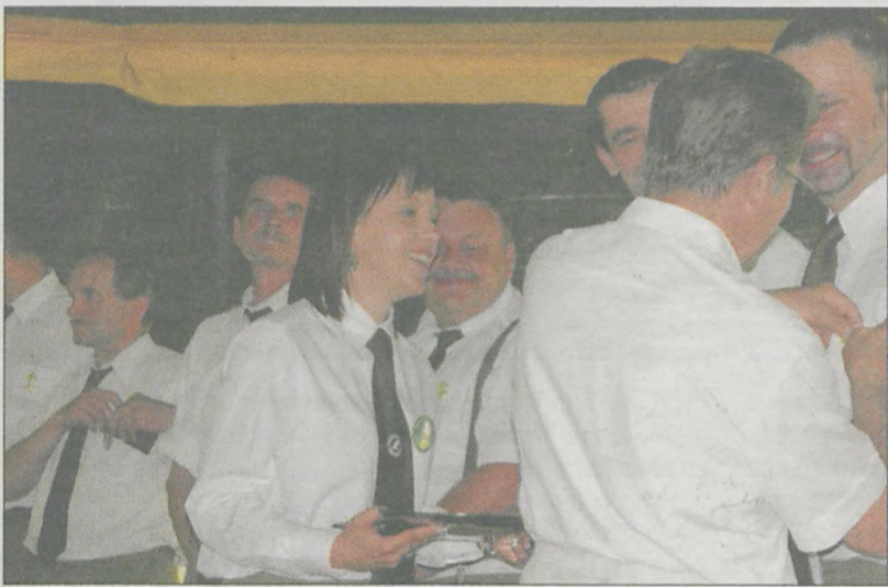
Wręczenie odznaczeń SITLiD

11 czerwca na terenie Nadleśnictwa Grodziec został zorganizowany „Dzień Leśnika i Drzewiarza”. Organizatorami tegorocznej imprezy były: Zarząd Oddziału SITLiD w Kaliszu oraz gospodarz wydarzenia - Nadleśnictwo Grodziec.