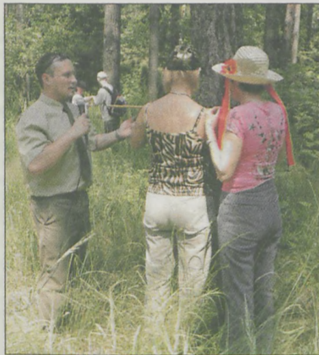
Pomiary pierśnicy drzew