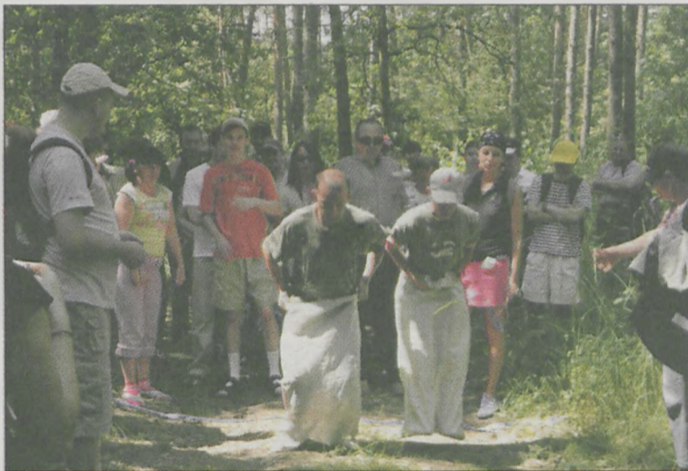
Skoki w workach