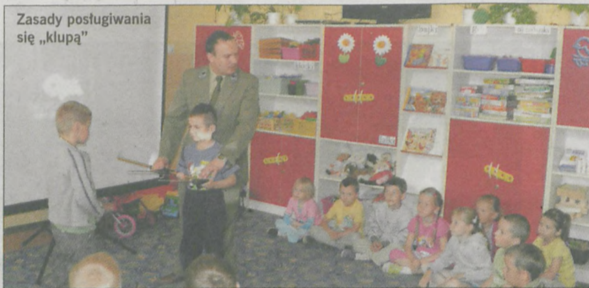
Zasady posługiwania się „klupą”

przedwakacyjnym spotkaniu u maluchów i starszaków, jakie miało miejsce w Radlinie.