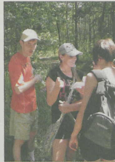
Muzyczne leśne studio nagrań w terenie

30 czerwca Środowiskowy Dom Samopomocy przy Miejsko-Gminnym Ośrodku Pomocy Społecznej w Jarocinie zorganizował V Integracyjne Podchody Leśne, które w tym roku odbyły się pod hasłem „Ruszaj z nami przyjacielu”. Nadleśnictwo Jarocin objęło patronat nad imprezą. Uczestnikami spotkania było ponad 70 podopiecznych ośrodków wsparcia, środowiskowych domów samopomocy i warsztatów terapii zajęciowej nie tylko z powiatu jarocińskiego. Gościliśmy w lesie także przedstawicieli Środowisko-