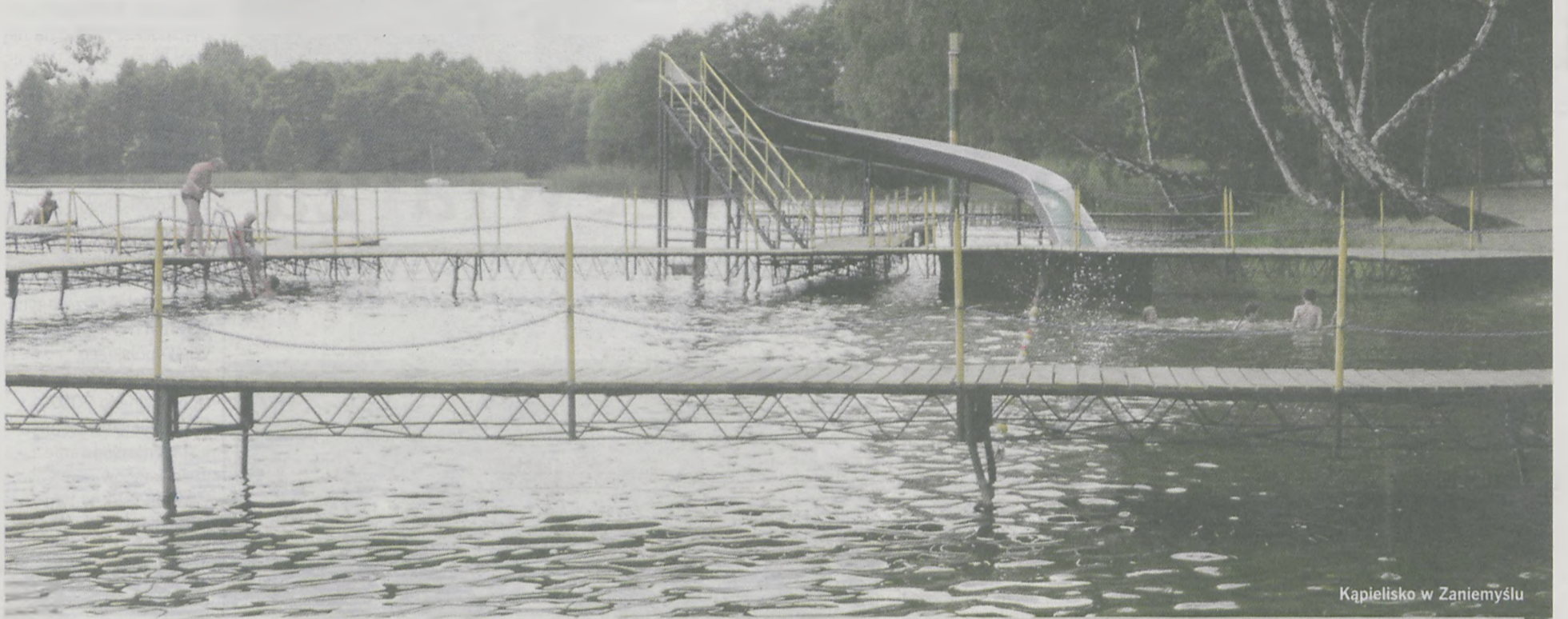
Kąpielisko w Zaniemięszlu

Wszystkich chcących korzystać z uroków letnich kąpeli oraz atrakcji wodnych - zapraszamy do serwisu informacyjnego przedstawiającego przydatność wody w kąpieliskach na terenie Polski.