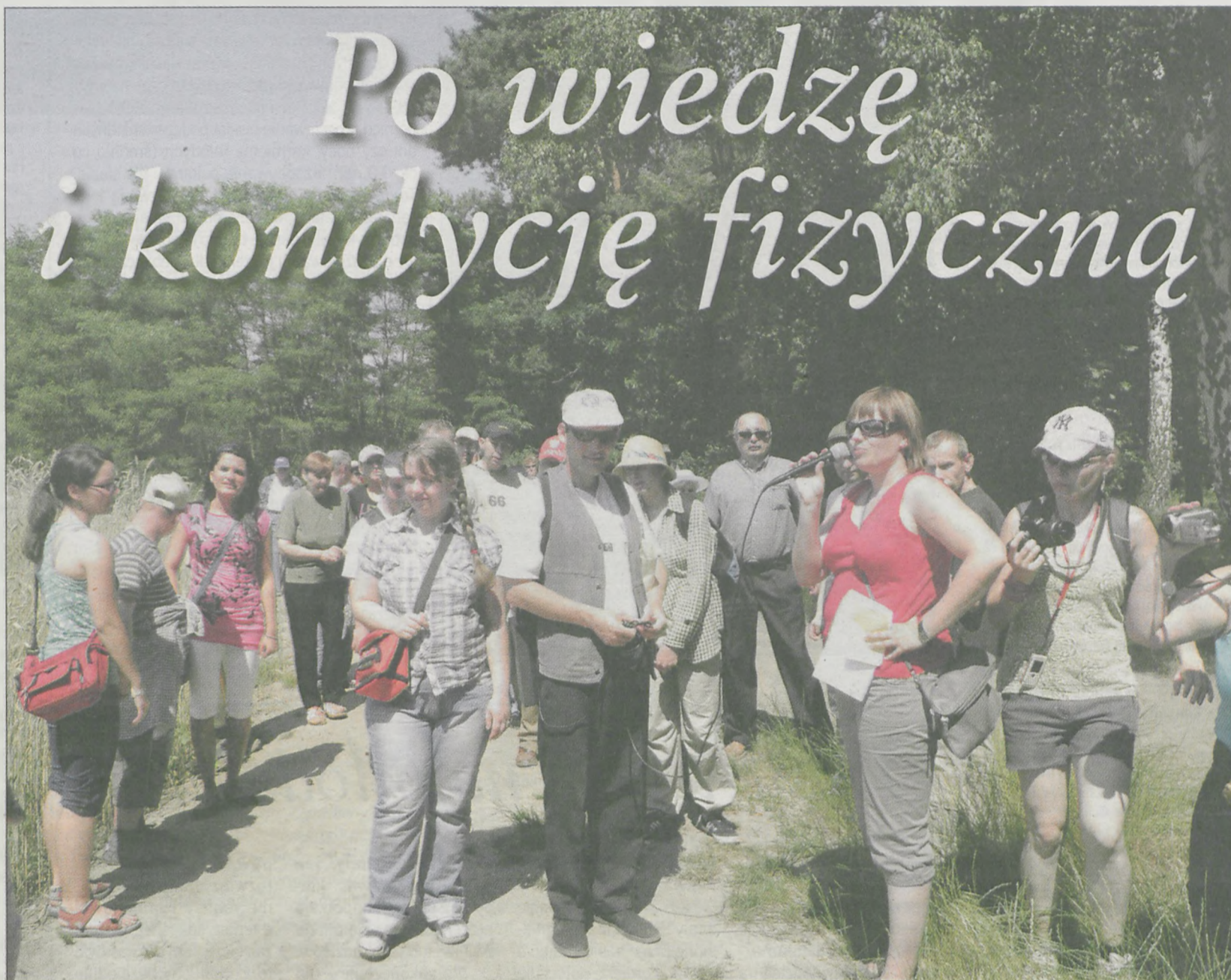
Pierwsza z konkurencji - adres z leśnych materiałów

lipiec/sierpień „Czysty Las” - finał ogólnopolskiego konkursu dla dzieci i młodzieży, Regionalna Dyrekcja Lasów Państwowych w Poznaniu oraz Towarzystwo Przyjaciół Lasu 2-12 sierpnia - XII Szkoła Letnia Zoo dla licealistów, studentów i pracowników Zoo, Fundacja Biblioteka Ekologiczna Regionalne Centrum Edukacji Ekologicznej w Poznaniu 10 sierpnia - Dzień Przewodników i Ratowników Górskich 12 sierpnia - Międzynarodowy Dzień Młodzieży (ONZ) 14 sierpnia - Dzień Energetyka (Polska) Oprac. J. W.