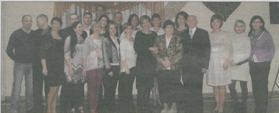
Na pamiątkę spotkania wszyscy stanęli do zdjęcia, a później długo opowiadali o tym, co wydarzyło się przez minionych 19 lat i wspólnie się bawili

Podziękowania dla wszystkich zespołów, które wystąpiły na koncercie charytatywnym dla Nikodema, przybyłej publiczności, wolontariuszom i organizatorom: Cooltura Jarocin oraz Jarocińskiemu Ośrodkowi Kultury.