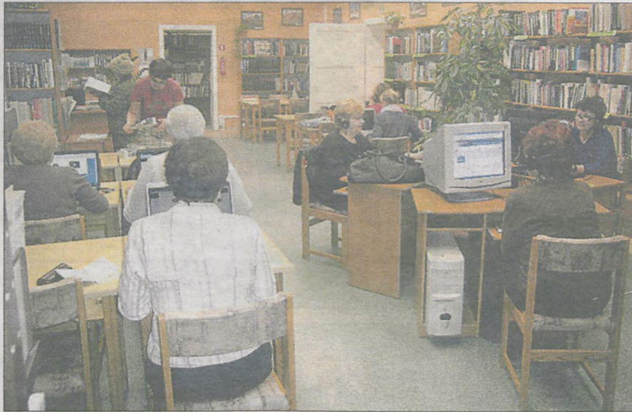
Każdy pracuje sam i sam narzuca sobie tempo nauki oraz monitoruje swoje postępy