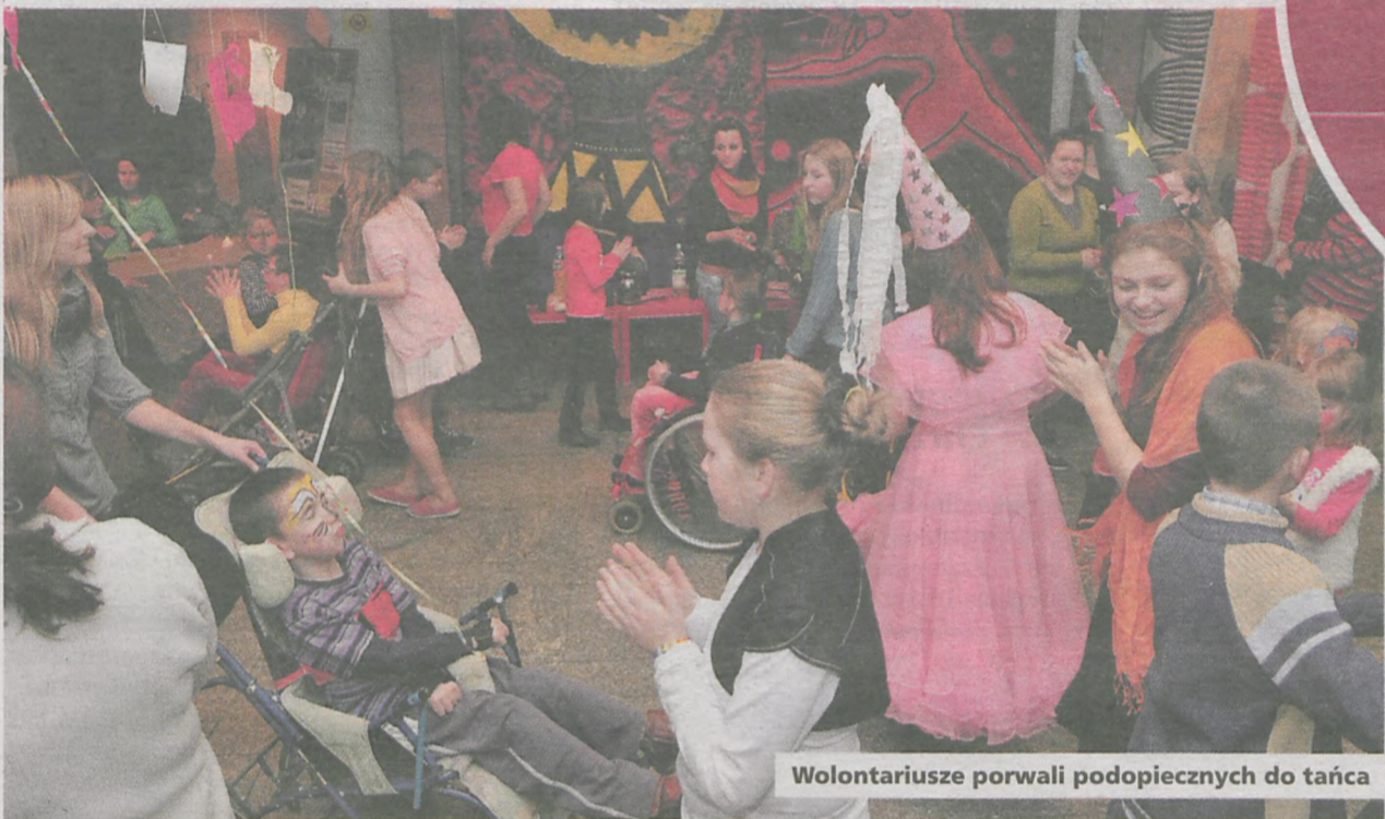
Wolontariusze porwali podopiecznych do tańca