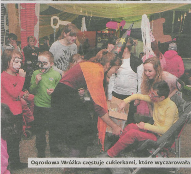
Ogrodowa Wróżka częstuje cukierkami, które wyczarowała