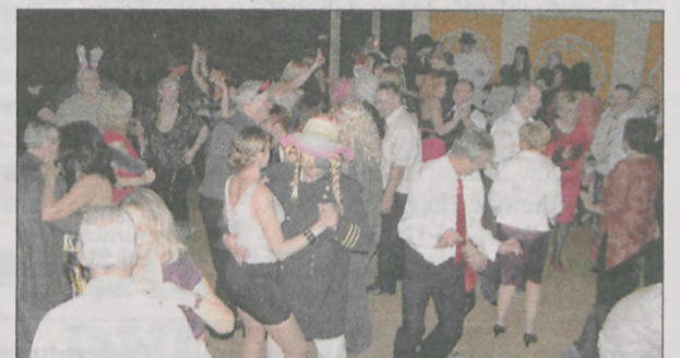
Po imprezie deklarowano chęć udziału w następnych organizowanych przez zarząd powiatowy Forum Związków Zawodowych