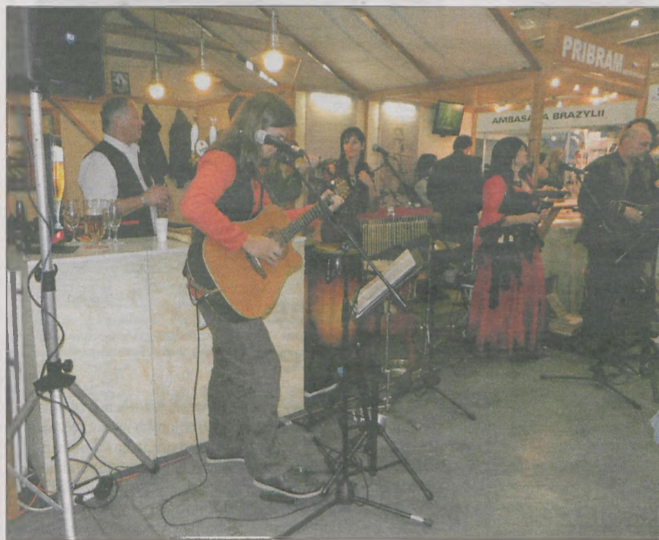
Uczestnicy „Tour-salonu” w różny sposób przyciągali zwiedzających do swoich stoisk