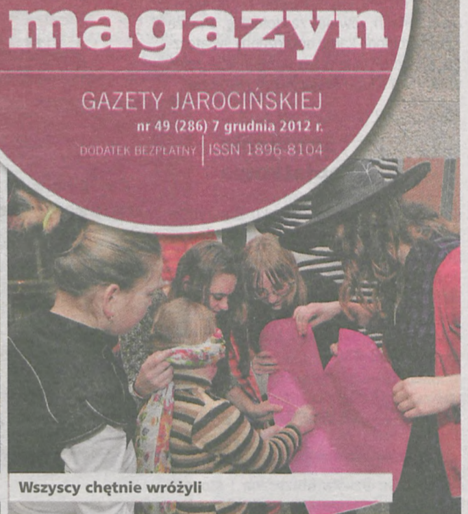
Wszyscy chętnie wróżyli