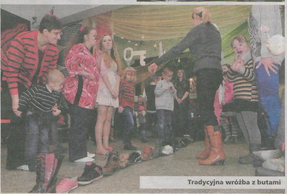
Tradycyjna wróżba z butami