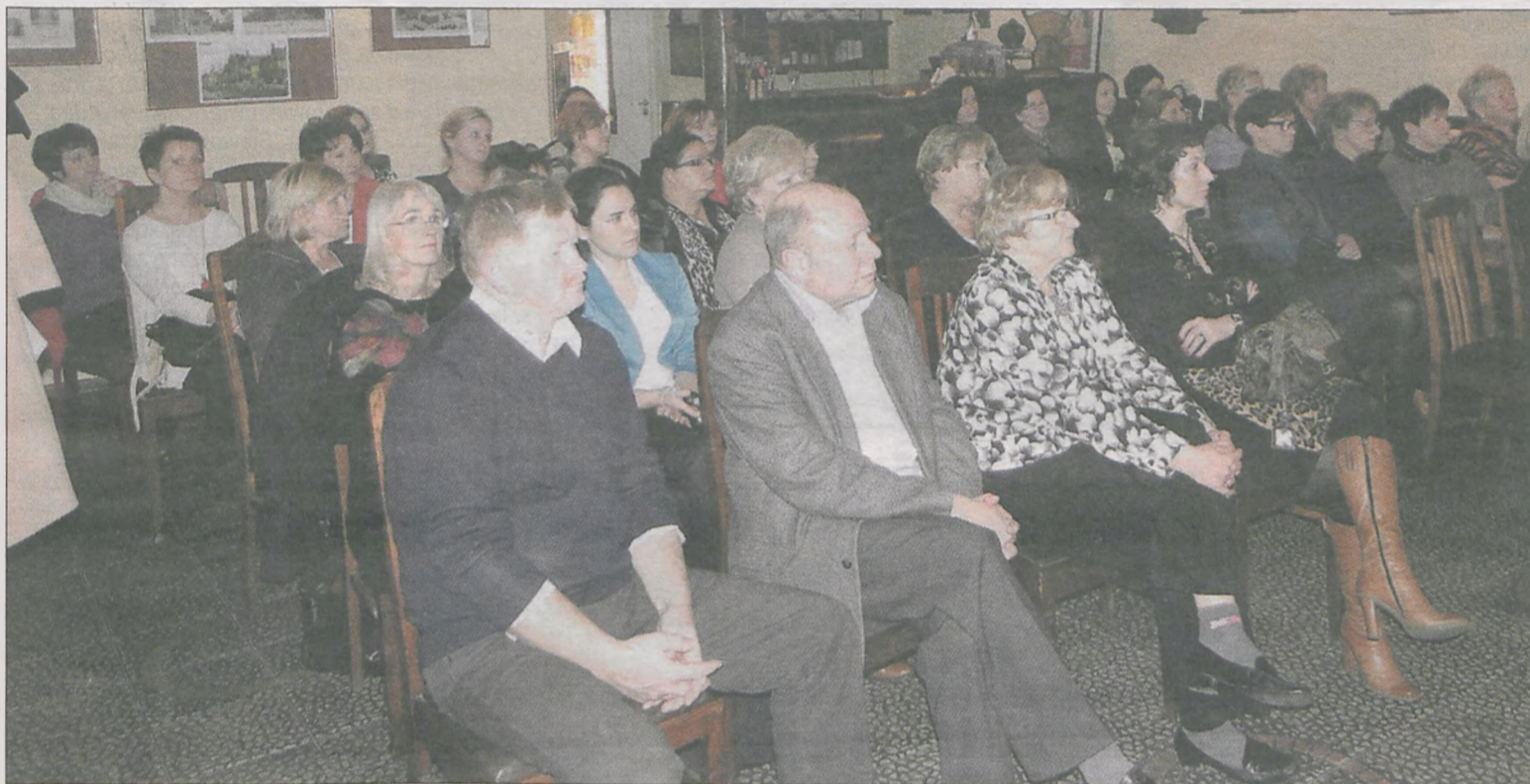
O sukcesji, przekazywaniu wiedzy, doświadczeń, uprawnień i praw własności rozmawiano podczas spotkania zorganizowanego przez jarociński klub BPW