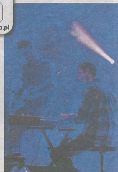
„Waglewski Fisz Emade” - łączący w sobie dwa pokolenia muzyków - zagral w Jarocinie w ramach projektu „(dla) Więzi”, który ma pomagać w osiągnięciu porozumienia międzypokoleniowego