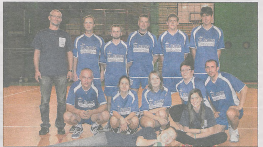
Zwycięska drużyna siatkarska Inspektorii Sióstr Salezjanek Salos z Dobieszczyzny