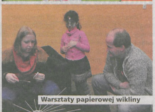
Warsztaty papierowej wikliny