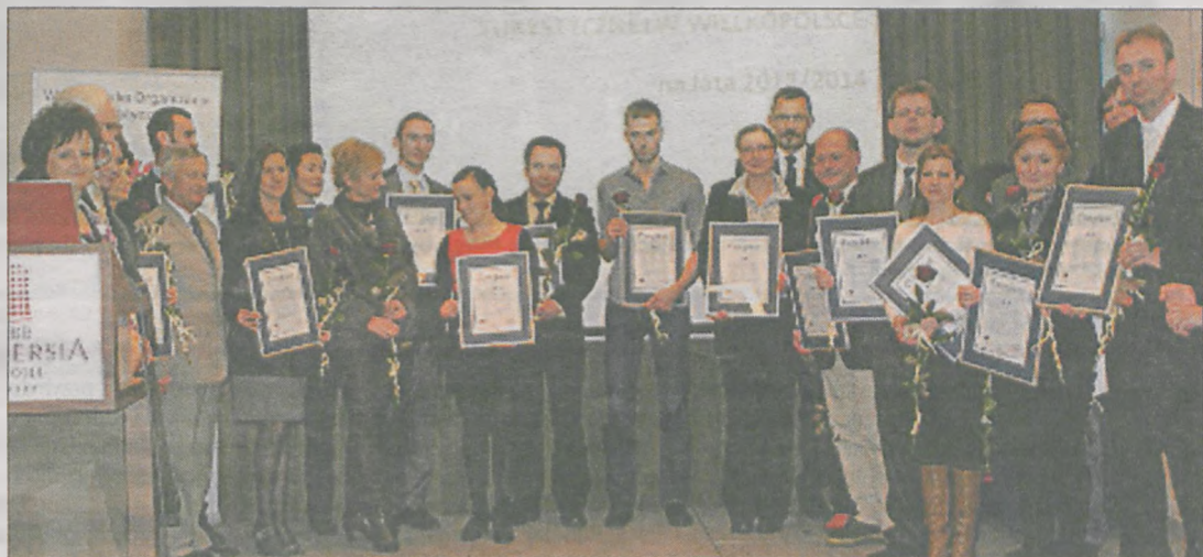
Wręczenie certyfikatów odbyło się w Poznaniu

► Certyfikacja jest przeprowadzana, aby zapewnić odpowiednią jakość obsługi turystów oraz stworzyć krajową sieć standaryzowanych jednostek informacji turystycznej współpracujących na poziomie lokalnym, regionalnym i krajowym. Przeprowadzana jest na zasadzie dobrowolności, na podstawie zgłoszeń nadsyłanych przez centra turystyczne.