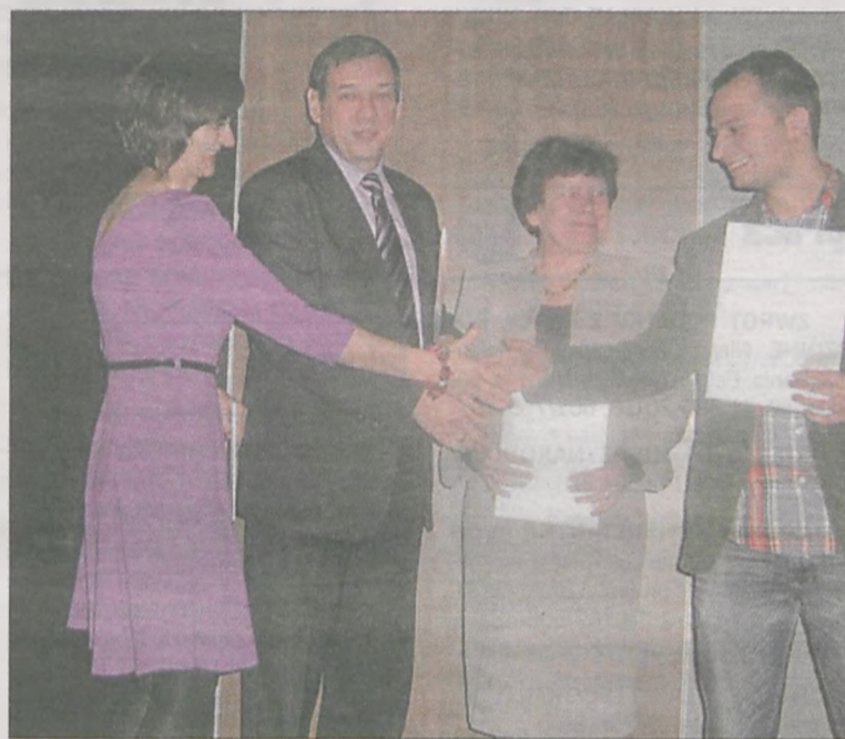
Nagrody wręczono na III Regionalnej Konferencji Bibliotek, która odbyła się w Poznaniu