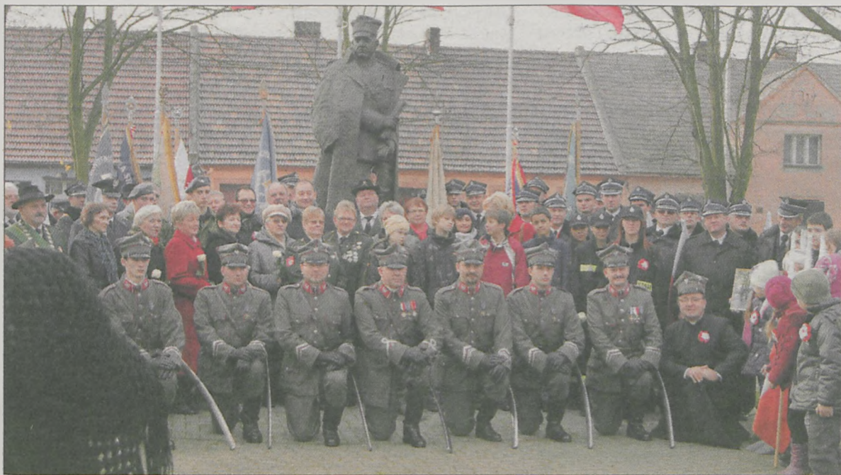
Pamiątkowe zdjęcie uczestników uroczystości