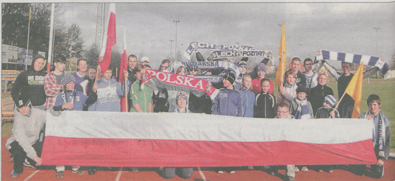
47 „kółek” zrobili na jarocińskim stadionie uczniowie, nauczyciele, maratończycy i biegacze z TKKF Trucht Wspólny Dom Jarocin