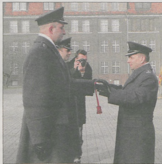
► Na pamiątkę pobytu w Jarocinie ustępujący dowódca otrzymał m.in. obraz olejny i szablę