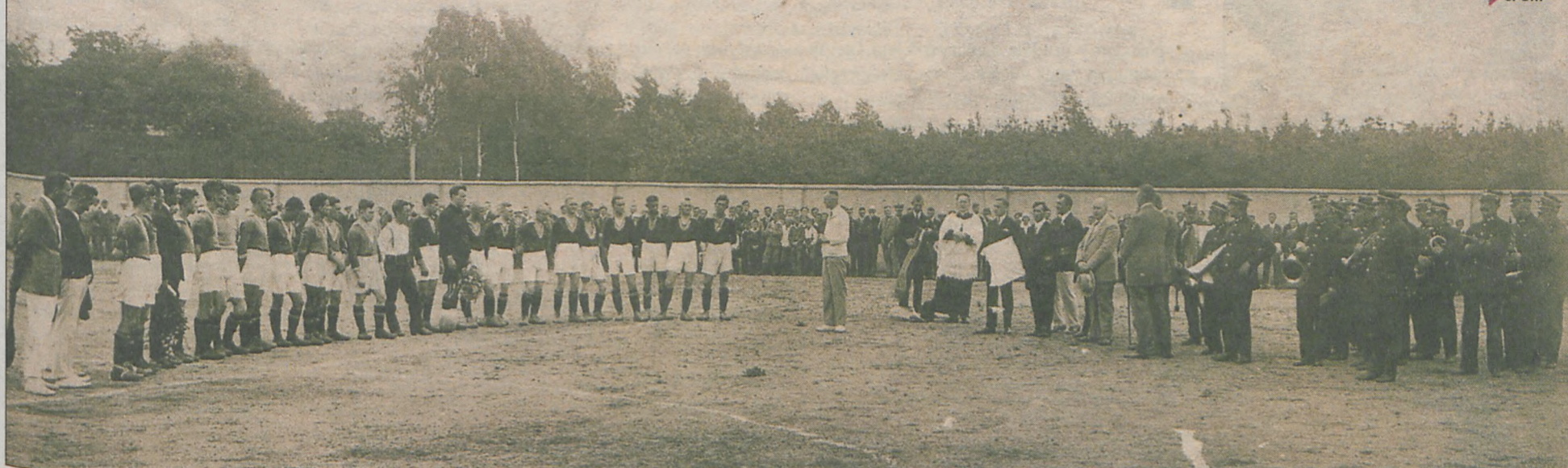
Poświęcenie boiska przy koszarach w Jarocinie. 29 czerwca 1927 r.