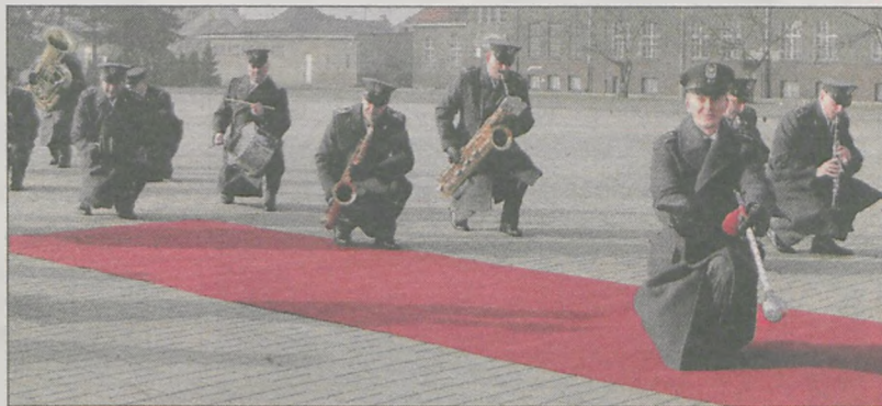
Uroczystość na placu koszarowym zakończyła się defiladą z krótkim koncertem w wykonaniu orkiestry wojskowej sił powietrznych