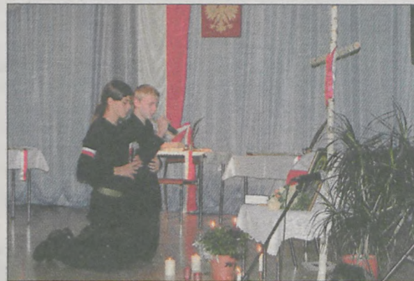
Z niepodległościowym programem wystąpili uczniowie z Zespołu Szkół w Nowym Mieście

Radni, sołtysi, delegacje OSP, szkół i organizacji działających w gminie, wśród nich kombatancki oraz harcerze, uczcili Święto Niepodległości.