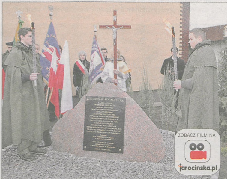
Na ul. ks. Rymarkiewicza odsłonięto obelisk upamiętniający duchownego