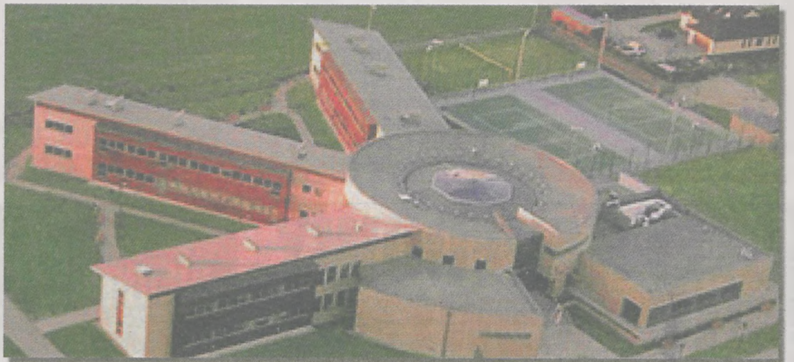
Nowy budynek dydaktyczny WWSSE w Środzie Wlkp.