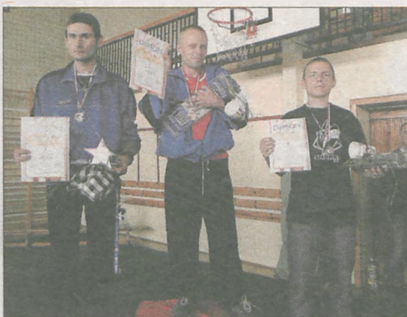
Dla najlepszych w klasyfikacji indywidualnej oprócz dyplomów i nagród były pamiątkowe medale