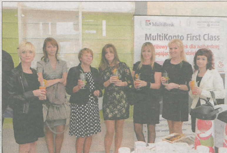
Pielęgniarki mają zaplecze z pełnym wyposażeniem kuchni, z ekspresem do kawy, kostkarką do lodu

tel. (62) 740-02-60 czynny w drugi i czwarty czwartek miesiąca, w godz. 17.00 - 19.00 ośrodek zdrowia w Rusku