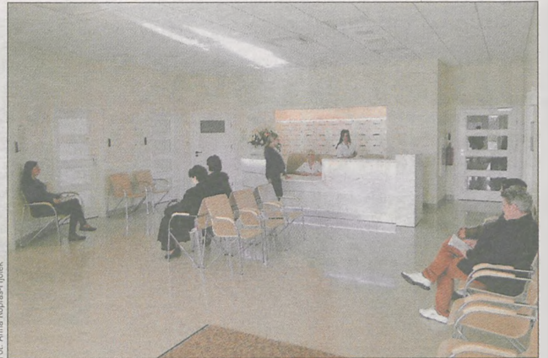
W podłogach obszernych, jasnych holi odbijają się światła