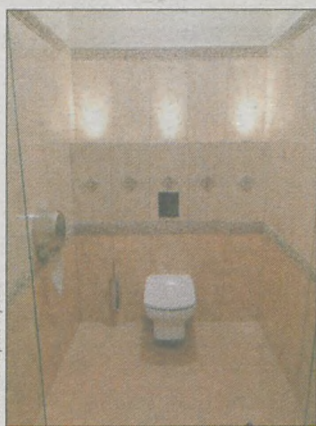
Szerokie, wygodne toalety...

▶ - Goście byli mile zaskoczeni, że wszystko jest na narodowy fundusz zdrowia - przyznaje lek. med. Andrzej Pajdowski. - Są światła, piękne meble, klimatyzacja i wkrótce rozbrzmi relaksacyjna muzyka.