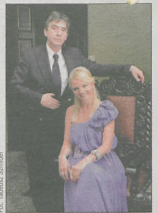
Zaproszeni goście mieli okazję wysłuchać koncertu Izabeli Kopeć