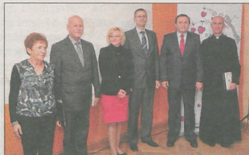
Certyfikaty wręczyli młodym ludziom członkowie komisji