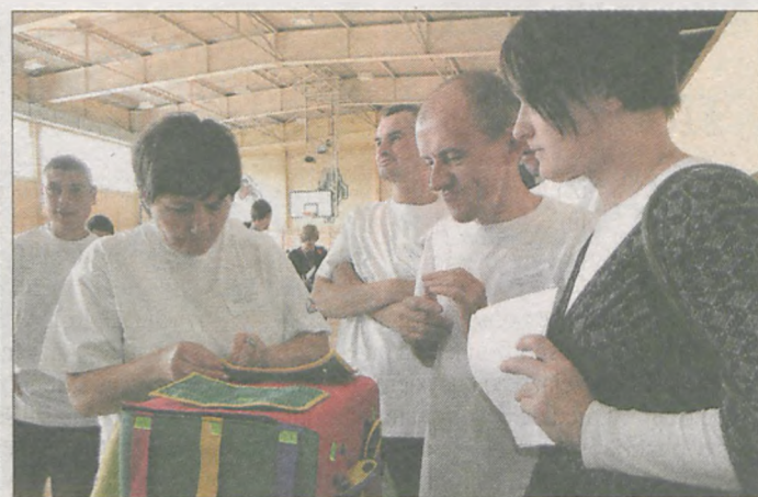
Po raz pierwszy zawodnicy musieli spróbować swoich sił w zmaganiach manualnych na kostce edukacyjnej