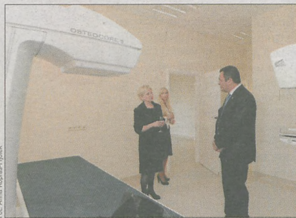
W gabinetach postawiono nowoczesne sprzęty