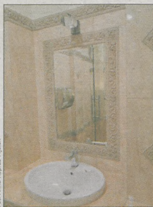
...i w każdej łazience możliwość regulowania światel