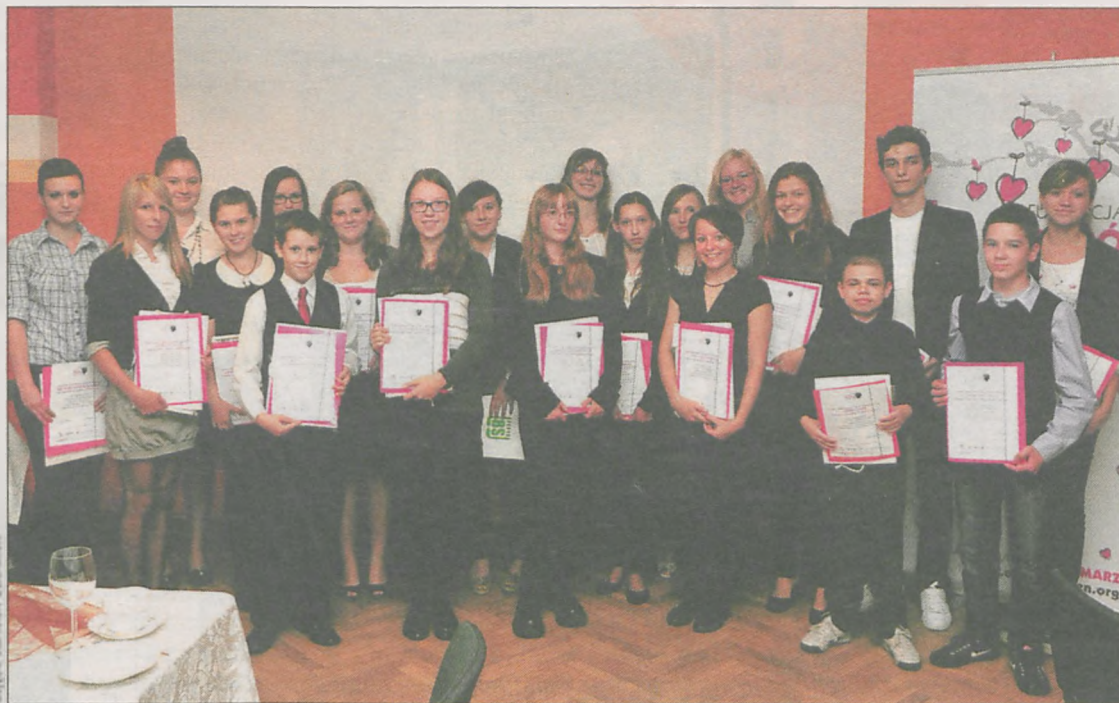
Od 100 do 250 zł będą co miesiąc otrzymywali stypendyści Fundacji „Ogród Marzeń”