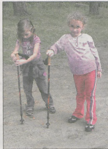
Nordic walking jest dobry dla małych... i dużych