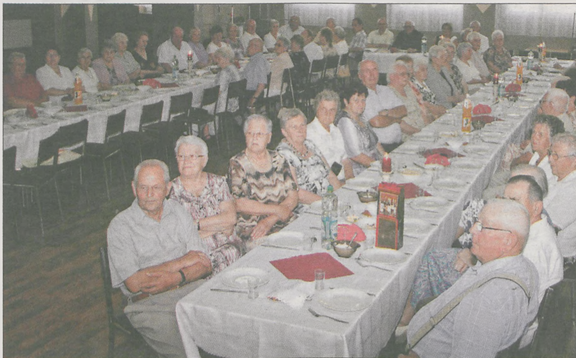
W Dniu Seniora w Golinie brało udział ponad 50 mieszkańców

Ponad 50 osób brało udział w Dniu Seniora przygotowanym przez golińskie stowarzyszenie Koła Gospodyń Wiejskich „Gospośia” w sali OSP.