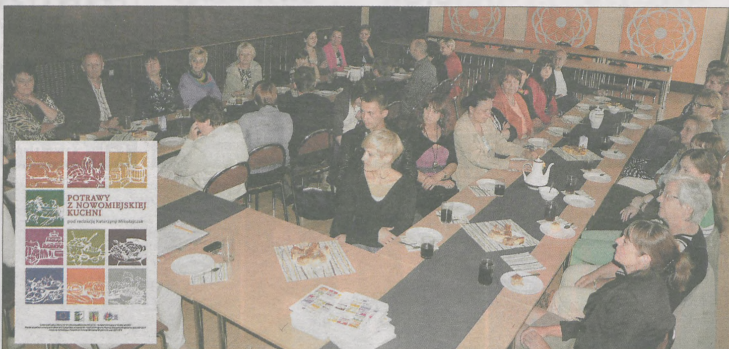
W spotkaniu wzięli udział m.in. autorzy przepisów