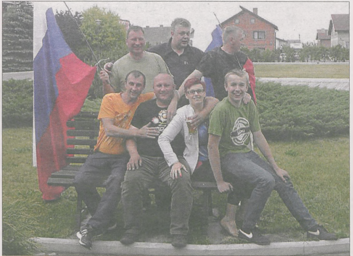
Rosjanie bardzo szybko znaleźli wspólny język z mieszkańcami Golin

Kilku Rosjan, którzy przyjechali na EURO, zatrzymało się na nocleg w hotelu w Golinie. Nie uszło tu uwadze mieszkańców wsi.