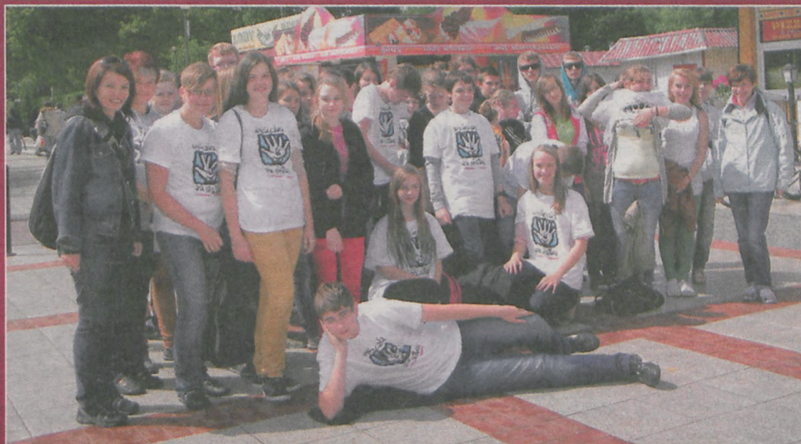
Na promenadzie w Świnoujściu