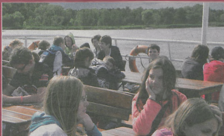
Rejs po Świnie