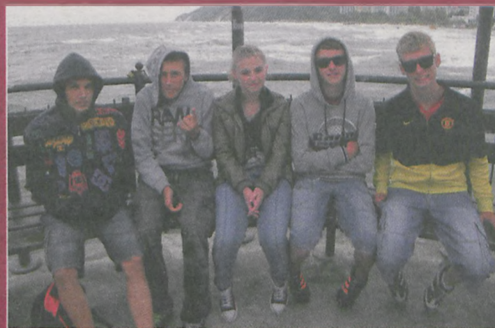
Na moło w Międzyzdrojach