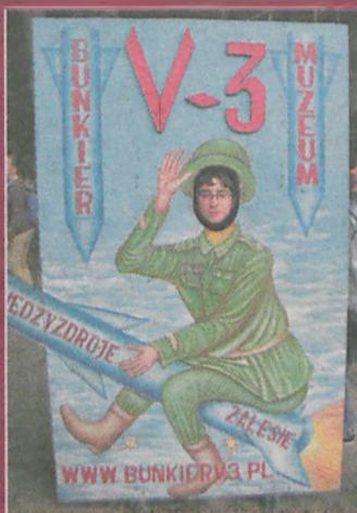
No to lecimy :-)