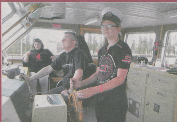
Za sterami statku