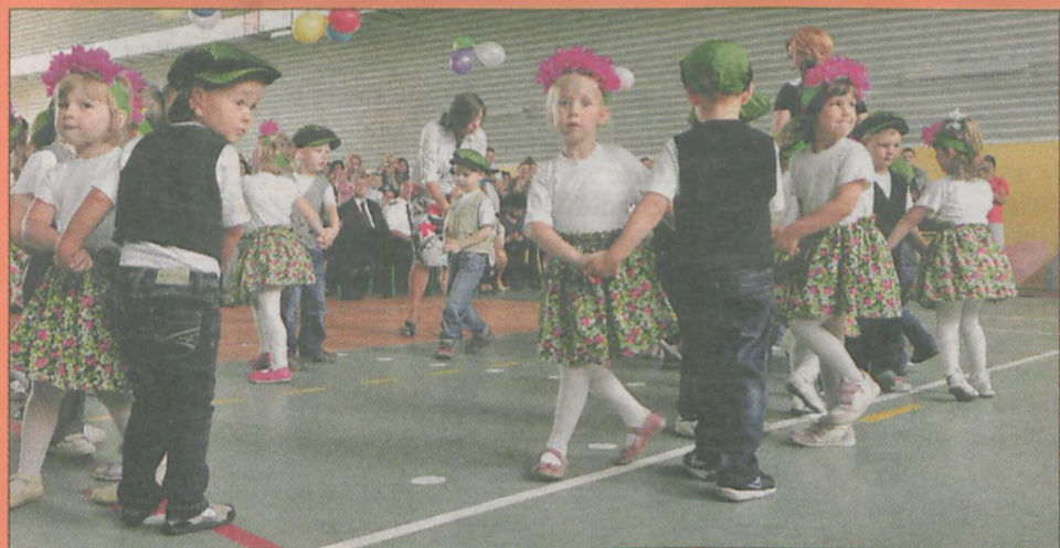
W programie artystycznym najpierw wystąpił osobno każdy z oddziałów, a na koniec wszyscy zatańczyli wspólnie