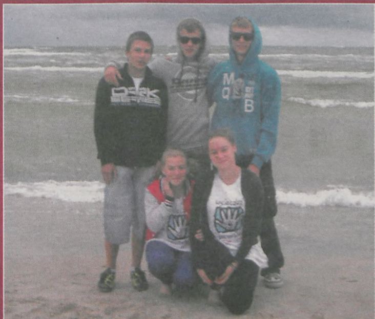
Pamiątkowe zdjęcie na tle morza