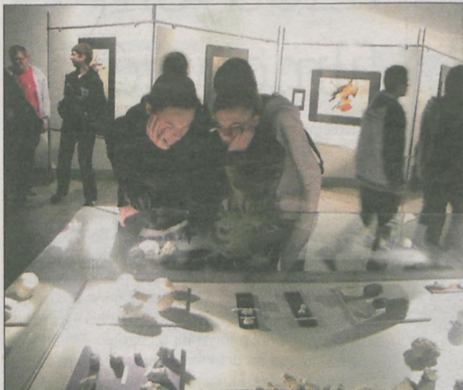
W muzeum w Międzyzdrojach