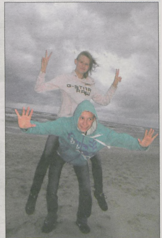
Humor nam dopisuje