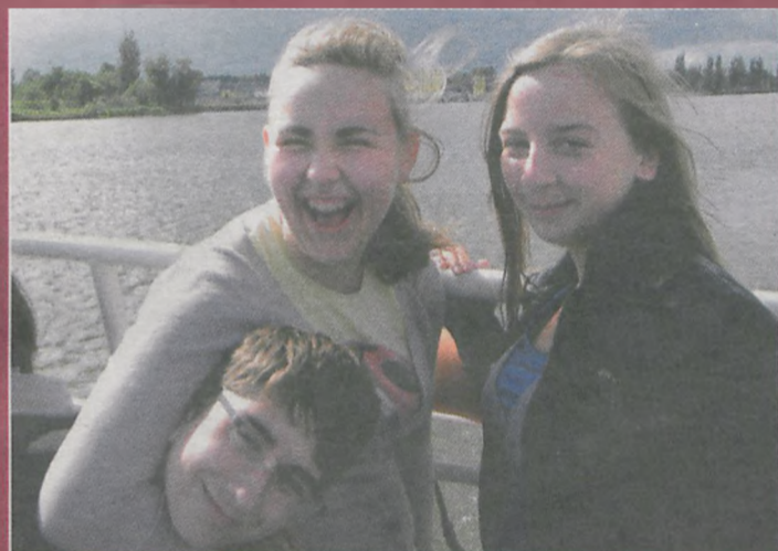
Podczas rejsu po Świnie