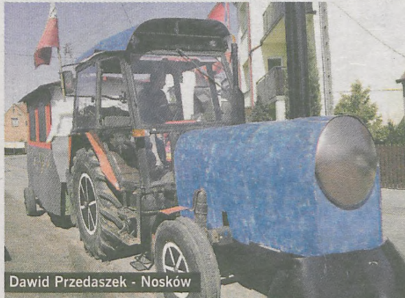
Dawid Przedaszek - Nosków