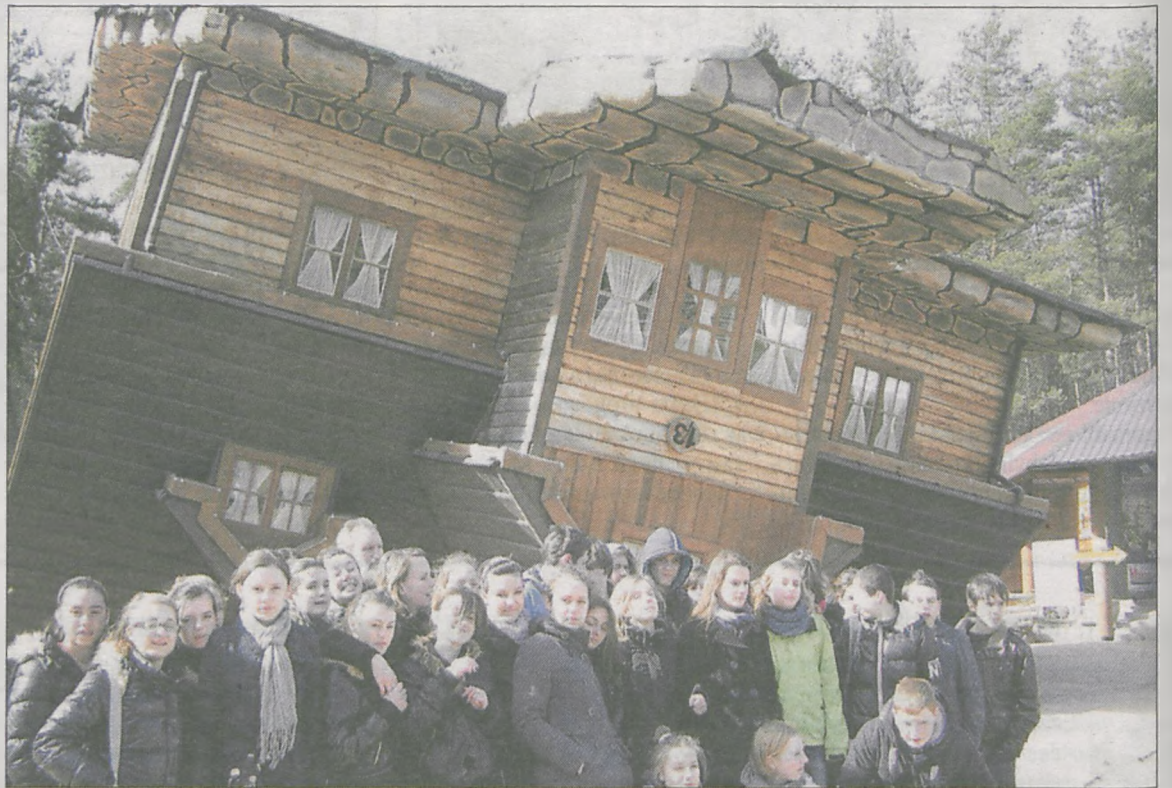
Jedną z atrakcji, którą zobaczyli uczniowie, był dom do góry nogami, w Szymbarku, na Pomorzu