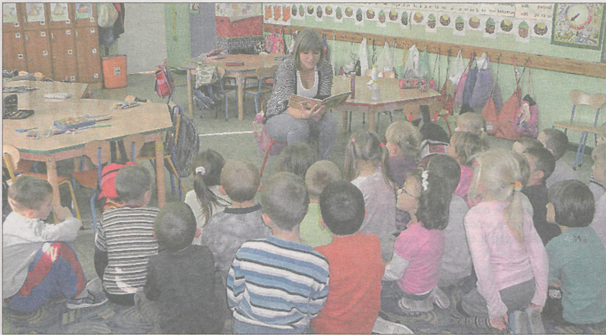
W akcjach głośnego czytania wzięły udział do tej pory prawie 4 tysiące dzieci

Do tej pory jarocińskie bibliotekarki zorganizowały wiele akcji mających na celu przyciągnięcie czytelników i wypromowanie książki. Były to m.in.: „Zaczytane lato”, czytanie na plaży, „Noc detektywów”, „Czytające szkoły”, „Czytające przedszkola”, „Czytanie na pomarańczowym dywanie”, „Zaczytane przerwy”, „Spotkania z bajeczką”, „Spotkania z lekturą”, „Misiolandia”, „Złap żółwia za nogi”, „Przyjaciele naszych bajek”. Wspólnie z bibliotekami w powiecie - Jaraczewem, Kotlinem i Żerkowem - organizowane są obchody Dnia Głośnego Czytania, Ogólnopolskiego Tygodnia Czytania Dzieciom. Wszystkie akcje łączone są z zabawą.