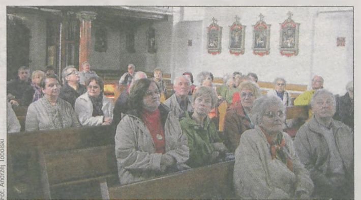
Na trasie wyjazdowego spotkania jarocińskich regionalistów znalazły się dwa kościoły

Panie z KGW w Sławoszewie przygotowały dla uczestników wyjazdu obiad i kawę. Oprac. (akf)