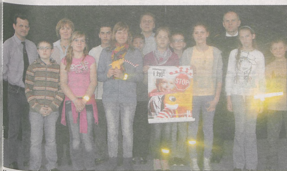
Uczniowie wzięli udział m.in. w zabawach edukacyjnych, które promowały bezpieczne pokonywanie przejazdów kolejowych

Kolejna akcja z cyklu „Bezpieczny przejazd - Zatrzymaj się i Żyj!” na terenie gminy Nowe Miasto odbyła się w Szkole Podstawowej w Boguszynie.