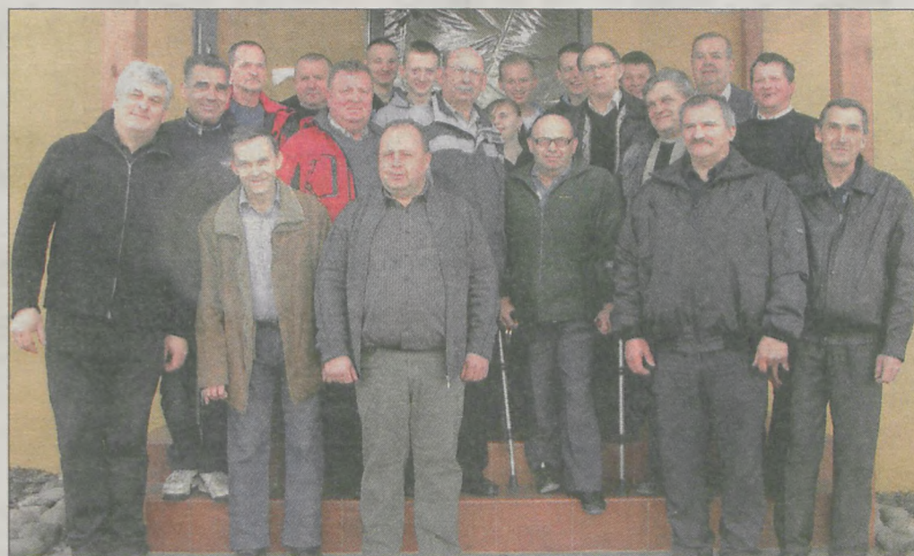
Kto otrzyma Puchar Prezesa Zarządu Gminnego OSP w Nowym Mieście, okaże się na początku maja