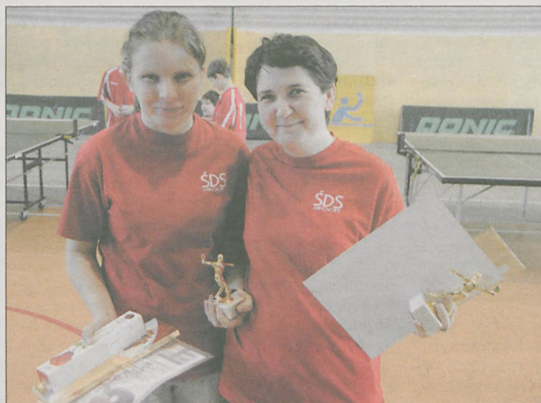
Nagrodami za sportowe sukcesy były statuetki, dyplomy oraz słodczyce