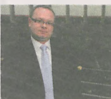
Krzysztof Kłosowski POSEŁ NA SEJM RP