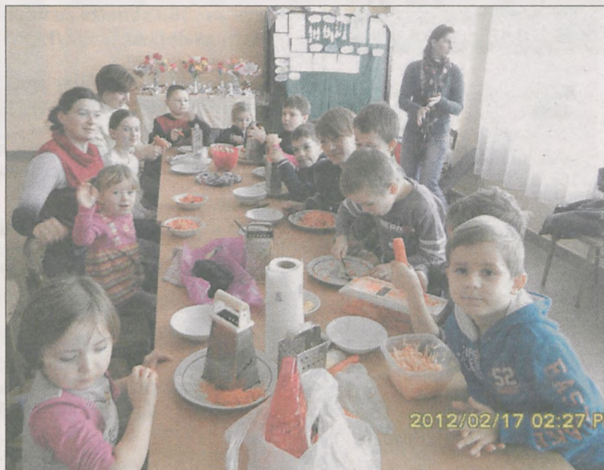
Dzieci ze Strzyżewka wzięły udział w akcji „Zdrowa żywność”