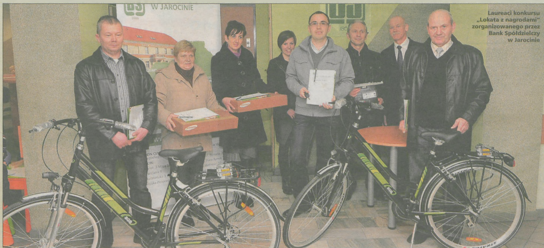
Laureaci konkursu „Lokata z nagrodami” zorganizowanego przez Bank Spółdzielczy w Jarocinie