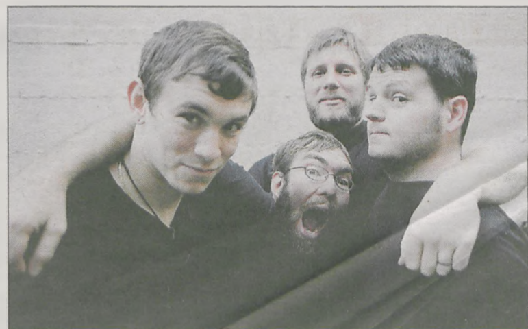
Pierwszym zagranicznym zespołem, który zagra w lipcu na festiwalu, jest amerykańskie Against Me!

Internet: www.ticketpro.pl, www.ebilet.pl, www.go-ahead.pl Punkty sprzedaży: Centrum Informacji Miejskiej, Carton Shop, Gazeta Cafe, Rock Long Luck (w Poznaniu) oraz Jarociński Ośrodek Kultury