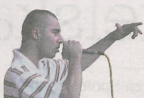
Sigma ARTYSTA JAROCIŃSKIEJ SCENY HIP-HOP