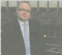
Krzysztof Kłosowski POSEŁ NA SEJM RP