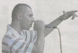
Sigma ARTYSTA JAROCINSKIEJ SCENY HIP-HOP