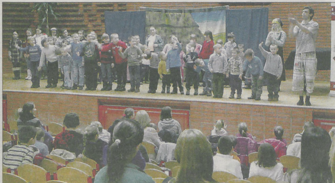
Przedstawienie „Jaś i drzewo fasolowe” wystawione zostało na scenie auli żerkowskiego gimnazjum. Obejrzało je ponad 150 dzieci. Spektaklowi towarzyszyły miniwarsztaty teatralne