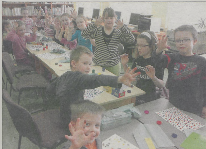
Przy malowaniu palcami wszyscy świetnie się bawili