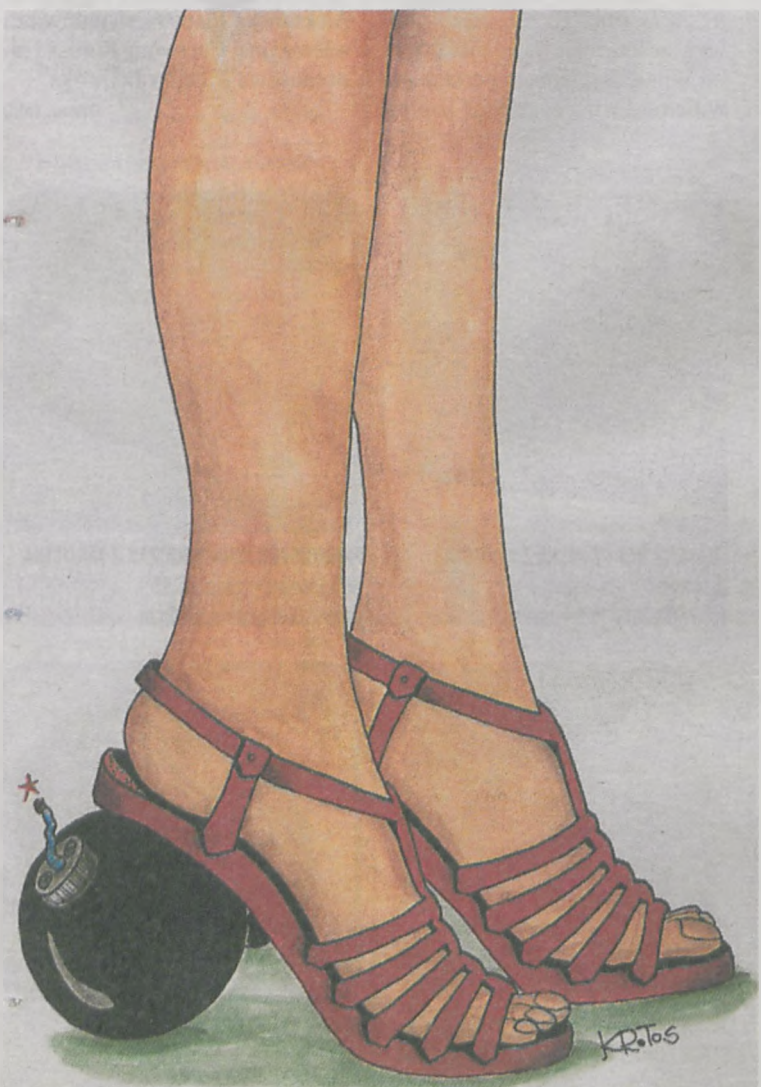
Wyróżniony rysunek Tadeusza Krotosa