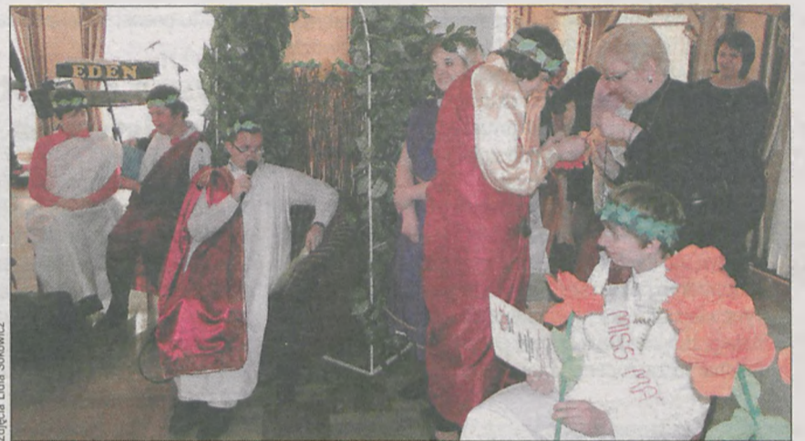
Aby zostać miss kandydatki musiały wykazać się różnymi umiejętnościami. Jedna wykonała wieniec z kwiatów dla „Cezara”

Zabawę rozpoczęto od konkursu na miss. Kandydatki reprezentujące każdą z placówek musiały wykazać się m.in. umiejętnościami wykonywania makijażu, tworzenia kompozycji kwiatowych oraz rozpoznawania smaków. Rywalizacja zakończyła się przyznaniem wszystkim szarf z tytułami miss. Na rzymskiej uczcie u Cezara nie brakowało niczego, również jadła. (ls)