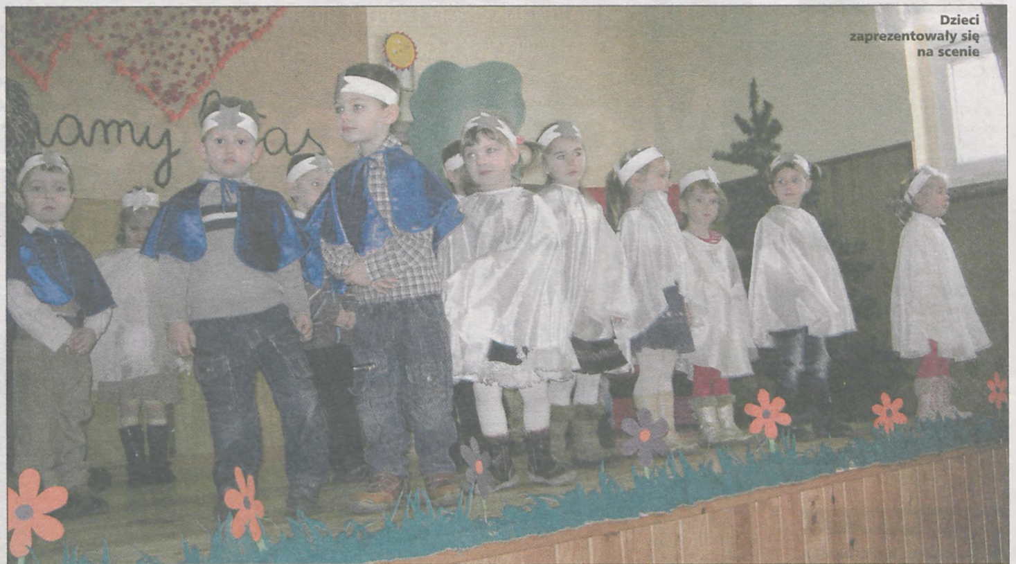
Dzieci zaprezentowały się na scenie