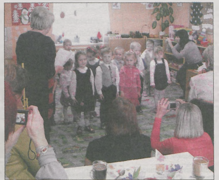
Podczas przerwy w zabawie udało się wszystkim ustawić do pamiątkowego zdjęcia