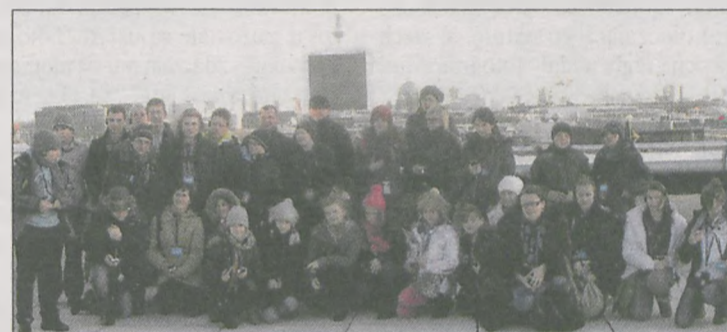
Zdjęcie grupy na dachu budynku niemieckiego parlamentu

Barwne przebranie było jedynym warunkiem wejścia na bal. Wszystkie dzieci bawiły się doskonale i już zadeklarowały, że pojawią się na zabawie w przyszłym roku. (era)