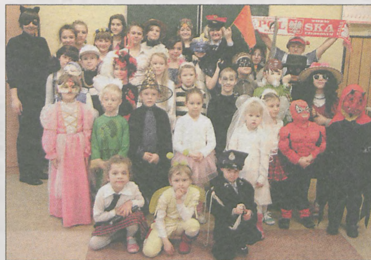
Wspólne zdjęcia uczestników zabawy karnawałowej w Szkole Podstawowej w Magnuszewicach