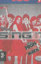
Disney SIGN IT High School Musical 3

PELNA OFERTA GIER W SKLEPACH ITECOM PROMOCJA TRWA DO WYCZERPANIA ZAPASÓW