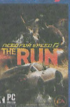
NFS: The Run