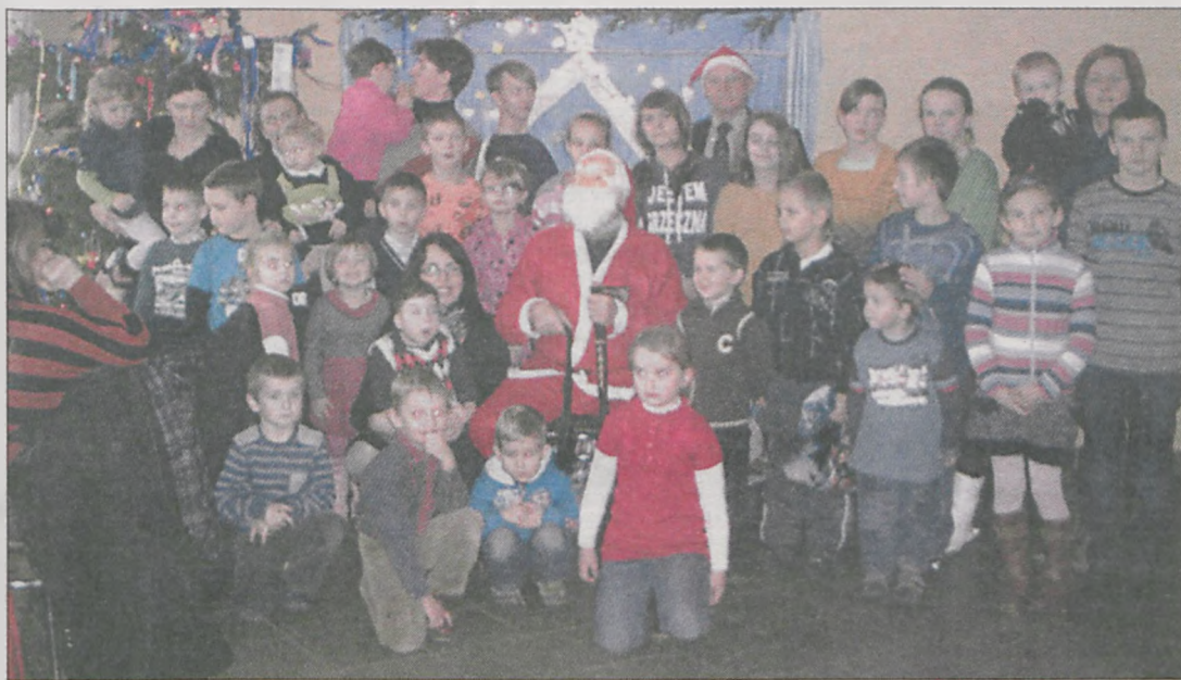
Na koniec było pamiątkowe zdjęcie ze św. Mikołajem