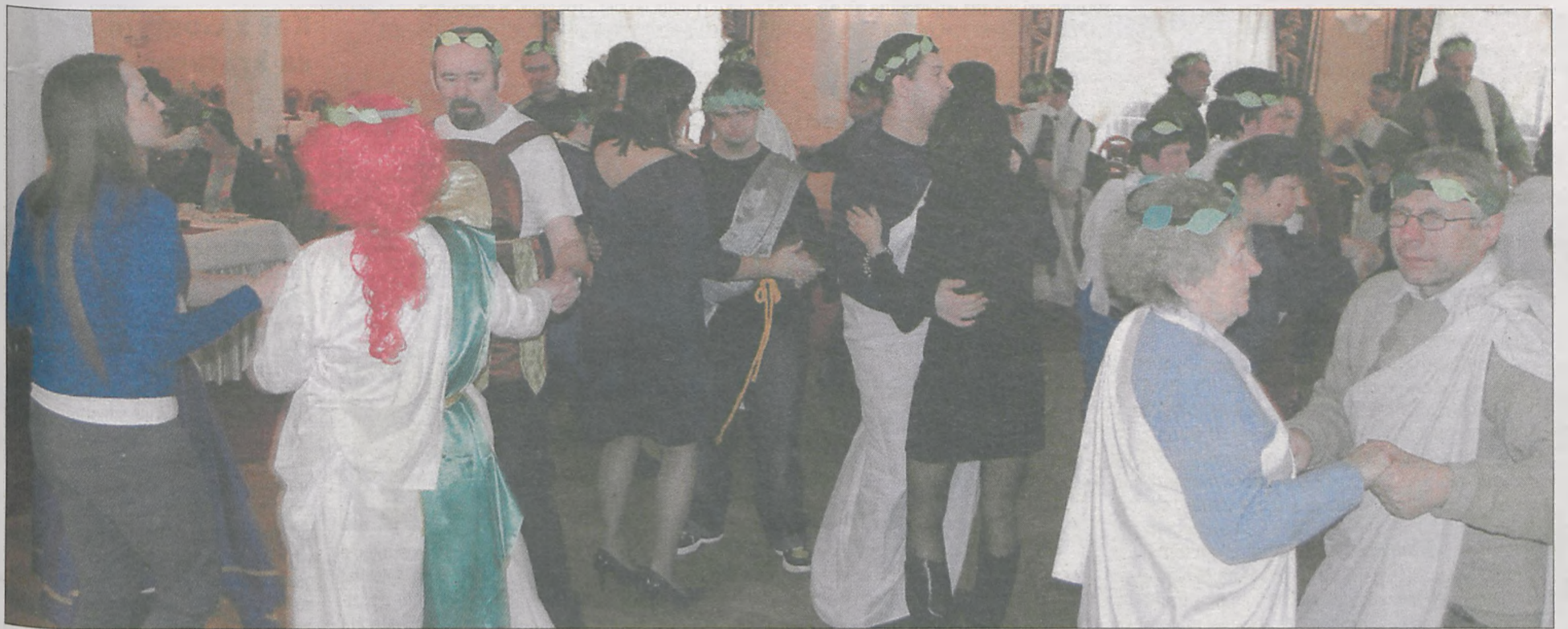
Tematem przewodnim tegorocznej zabawy był „starożytny Rzym”. Na sali królowały tuniki wykonane z prześcieradeł i obrusów