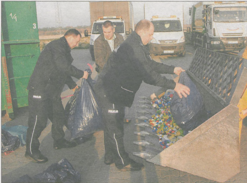
10 worków zakrętek, czyli 80 kg, zebrała jarocińska policja

TONY plastikowych nakrętek podarował nam jarociniak, który chce pozostać anonimowy