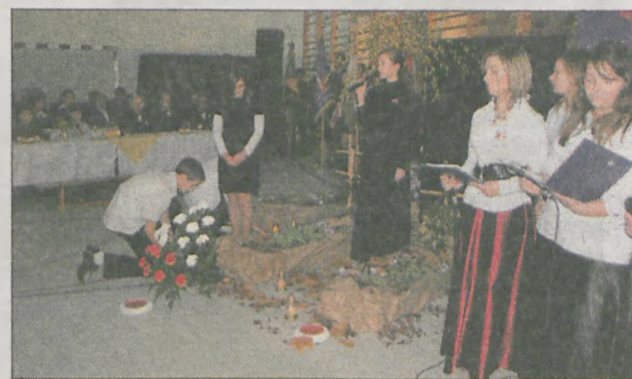
Inszenizację słowno-muzyczną zaprezentowali uczniowie z gimnazjum w Woli Książęcej