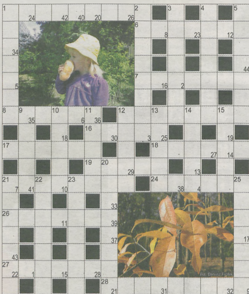
grafika i opracowanie: Stawik Andrzej

Po odbiór nagród prosimy się zgłosić do biura ogłoszeń Jarocin, ul. Rynek 21, wejście od ul. Mickiewicza) w ciągu dwóch tygodni.