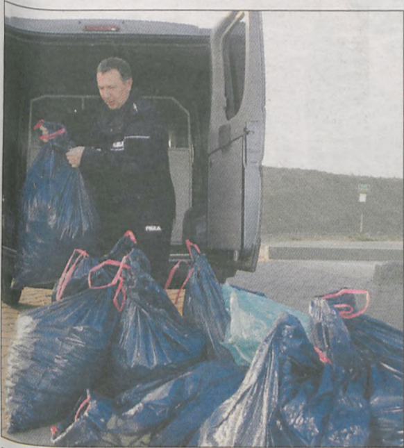
Policjanci odwieźli na składowisko ZGO dziesięć worków zakrętek

W sobotę, 19 listopada, od 12.00 do 13.00 w ZGO Sp. z o.o. w Jarocinie będziemy odkręcać zakrętki z butelek, które znajdują się na terenie zakładu. Wszystkich, którzy chcą pomóc, zapraszamy na spotkanie z wolontariuszami oraz osobami, które chciałyby wstąpić do Klubu Wesołych Ogrodników. Zebranie odbędzie się w środę, 16 listopada 2011, o godz. 15.30 w JOK-u. Osoby, które nie mogą uczestniczyć w zebraniu, a chcą pomóc, proszone są o kontakt telefoniczny pod numerem telefonu (62) 747-15-31.