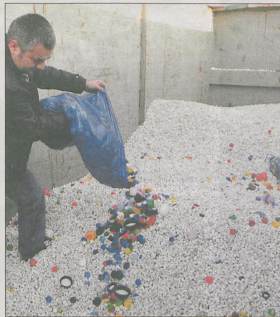
1,5 tony białych zakrętek podarował nam anonimowy jarociniak. Kolorowych nakrętek jest już coraz więcej