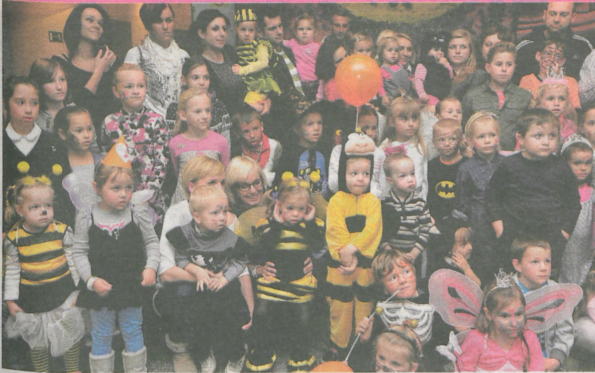
Tradycyjnie podczas baliku dzieci pozowały do wspólnej fotografii