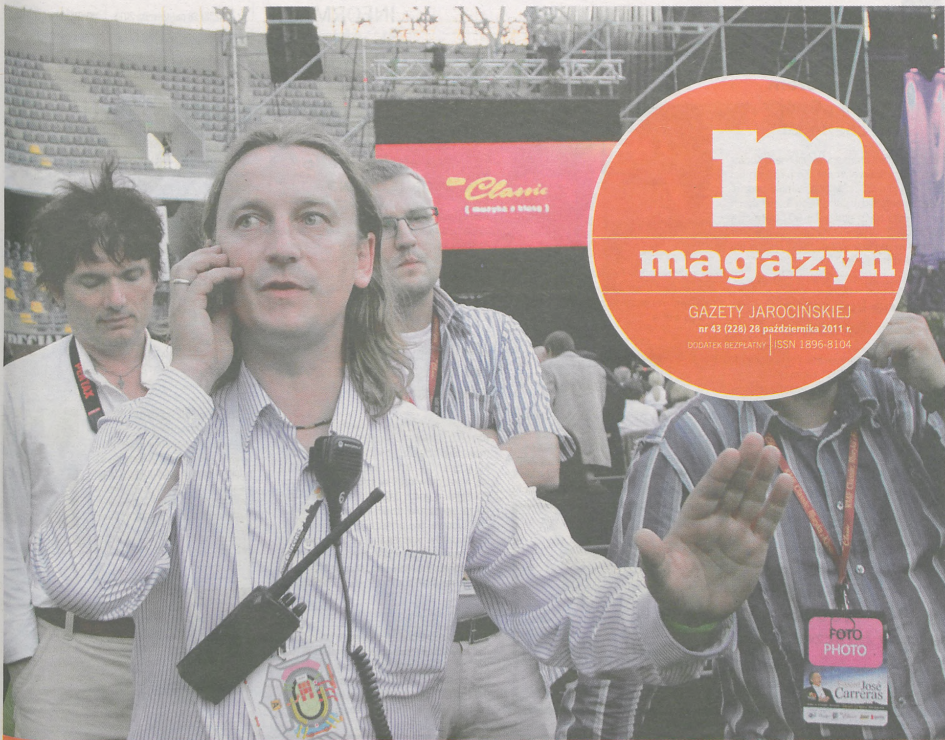
z Jose Carreras'em