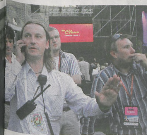
Artyści przygotowuje występ Jose Carrerasa