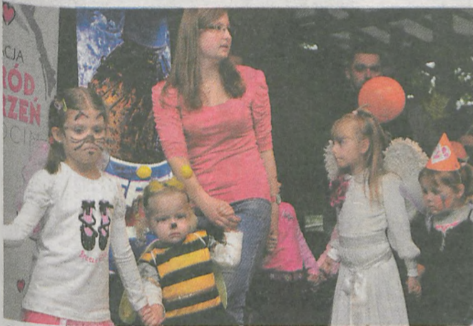
Maluchami opiekowali się wolontariusze z Klubu Wesołych Ogródników