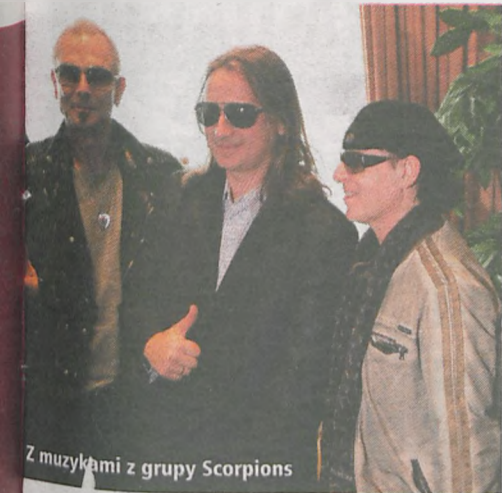
Z muzykami z grupy Scorpions

Pomysł na festiwal zawsze będzie subiektywny. Mam go, ale nie wiem, czy się spodoba. Cztery lata temu bardziej niepewnie stąpałem po ziemi. Teraz wiem, czego chcę i jak to zrobić.