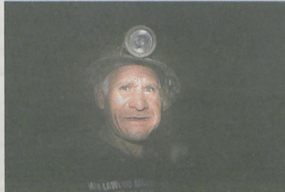
Górnik w kopalni na Cerro Rico