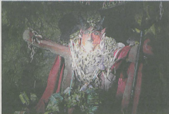
Diabeł Tio - ten „Zły”