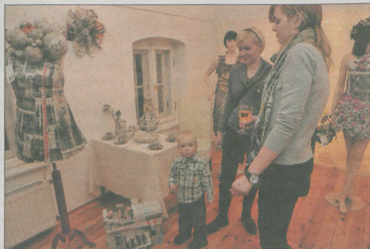
Zwycięzca konkursu Dniekifolski