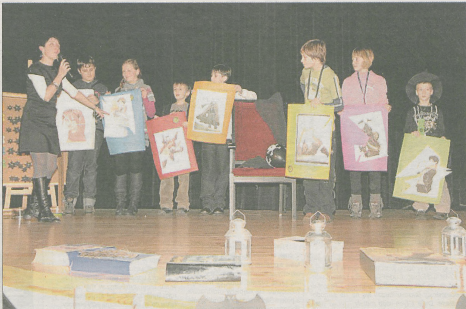
Na uczestników zabawy czekały magiczne konkurencje sprawnościowe