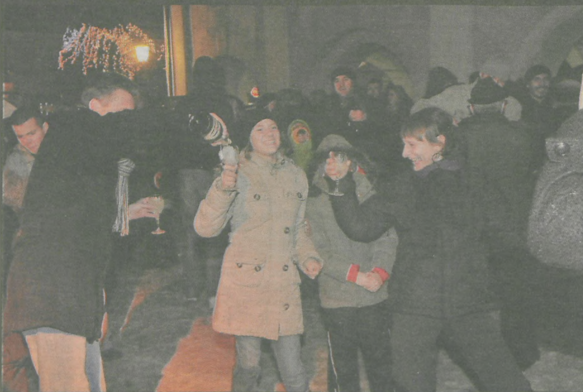
Tak bawili się jarociniacy w noc sylwestrową na rynku.