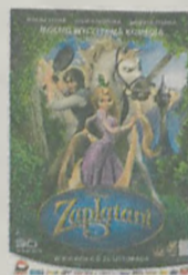
cena biletu 12 zł ulgowe (do lat 15) 10 zł