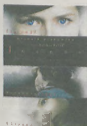
cena biletu 12 zł ulgowe (do lat 15) 10 zł

II wojna światowa. Kraków. Joanna - młoda, czekająca na powrót męża z wojny kobieta znajduje w kościele ocaloną z tapanki siedmioletnią Różę. Postanawia zaopiekować się dziewczynką. Gest dobroci będzie miał dla niej dramatyczne konsekwencje. 7 stycznia, godz. 19.00 8 stycznia, godz. 19.00, 21.00 9 - 12 stycznia, godz. 19.00