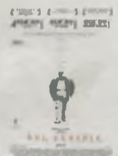
cena biletu 7 zł

Clareece „Precious” Jones to szesnastoletnia otyła, czarna dziewczyna, która mieszka w Harlemie pod koniec lat osiemdziesiątych. Nie dość, że jest po raz drugi w ciąży, w dodatku z własnym ojcem, który regularnie ją gwałci, to jeszcze matka bije ją i poniża. Dziewczyna nie nawidzi samej siebie, a odczeka od nieznośnej codzienności jest dla niej świat własnej wyobraźni. 6 stycznia, godz. 19.30