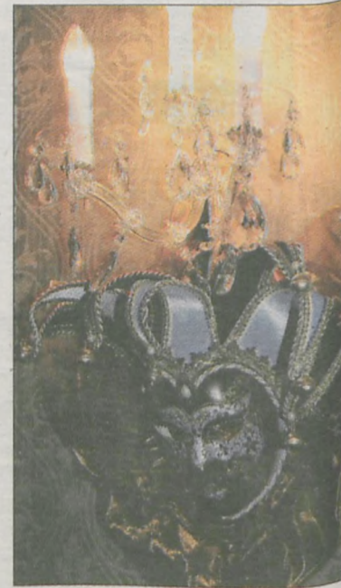
Większość gości zjawiała się na balu z maskami. Niektóre zaskakiwały wyszukaniem wzornictwem.