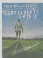
cena biletu 12 zł ulgowe (do lat 15) 10 zł