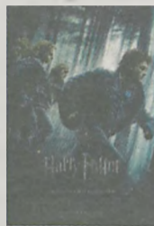
cena biletu 12 zł ulgowe (do lat 15) 10 zł

Ostatnia część przygód młodego czarodzieja Harry, Ron i Hermiona wyruszają w niebezpieczną misję. Ich zadaniem jest znalezienie horkruksów, dzięki którym Voldemort sieje zniszczenie i jest nieśmiertelny. Troje przyjaciół nie mogących liczyć na porady swoich profesorów i opiekę Dumbledora'a, musi teraz bardziej niż kiedykolwiek polegać na sobie. W pobliżu czają się Ciemne Siły. 4 - 5 stycznia, godz. 17.00 6 stycznia, godz. 16.30