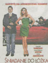
ŚNIADANIE DO ŁÓŻKA

Jarocin ul. Gołębia 1, tel. (62) 747-11-19