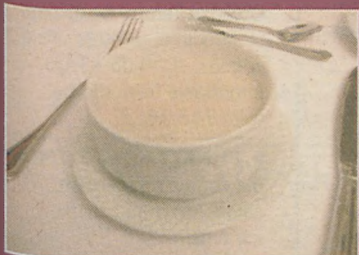
Zupa - aksamitny krem z kalafiora z pieczonym boczkem