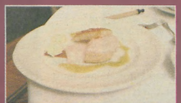
Deser - mus malinowy w cieście francuskim z czekoladą i mussem z białej czekolady i sosem brzoskwiowym