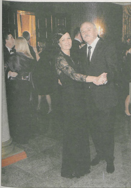
Właściciel pałacu porwał swą małżonkę do tańca