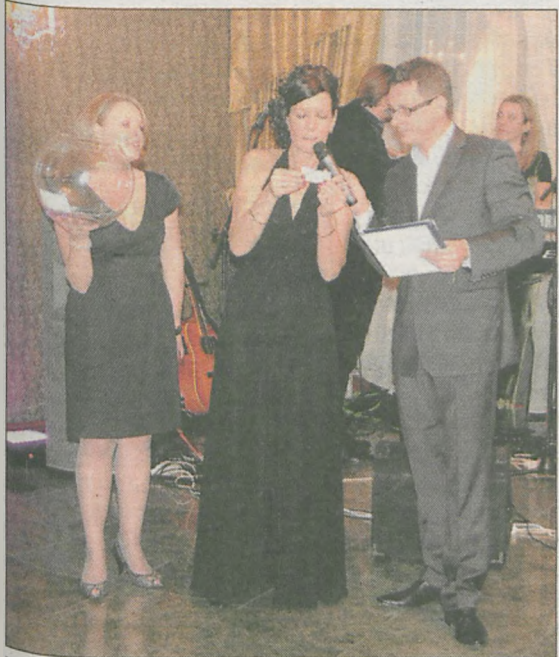
Wśród gości rozlosowano weekendowe pobyty w pałacu, a także nad morzem