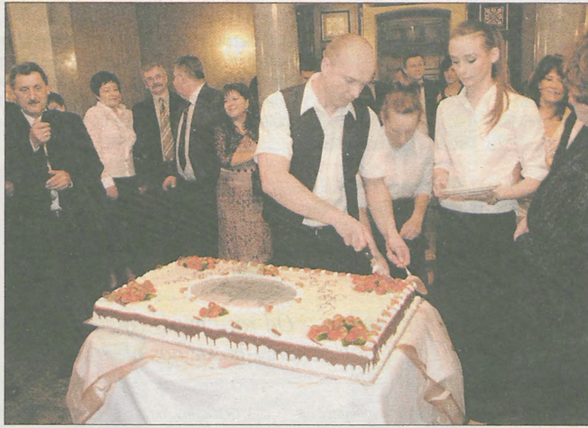
Jedną z atrakcji był wielki tort z wizerunkiem obiektu