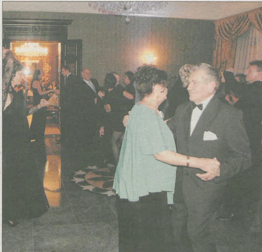
O atmosferę na parkiecie zadbała „Strefa Zero”