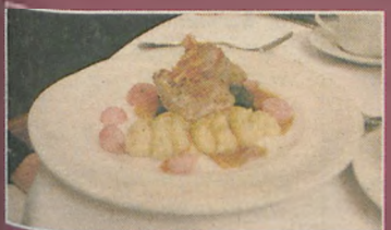
Danie główne - pieczona polędwiczka wieprzowa z musztardowym puree ziemniaczanym, czosnkowym szpinakiem, karmelizowanymi rzodkiewkami i ciemnym sosem