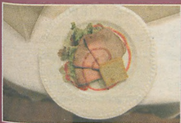
Przystawka - mini sałatka z pieczonym w ziołach rostbefem z sosem winno-żurawinowym i grzankami