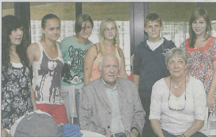
Licealistki przyznają, że pobyt we Francji, zorganizowany przez organizację charytatywną Rotary, przyniósł im wiele wrażeń

Zwiedziły Lille, były w oceanarium Nausica, w Brugii i w Paryżu. Mówią, że to była niezapomniana podróż.