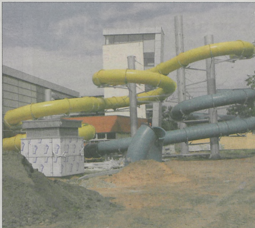
Żółta zjeżdżalnia będzie miała 120 m długości, turkusowa - 80 m. - Jeszcze przyjadą 3 tiry rur. Myślę, że do końca miesiąca zamontujemy zjeżdżalnie - informuje Ryszard Grzebyszak

Relacja wideo od środy na naszym portalu www.jarocinska.pl