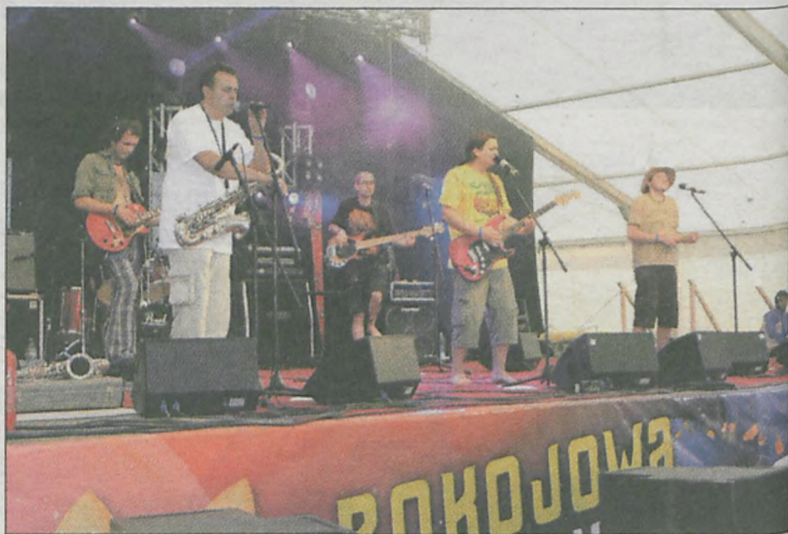
Jarocińska kapela Za Zu Zi w Pokojowej Wiosce Kryszny grała też w ubiegłym roku