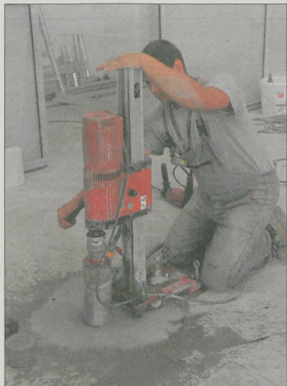
Robotnicy wszelkie prace chcą skończyć do końca września