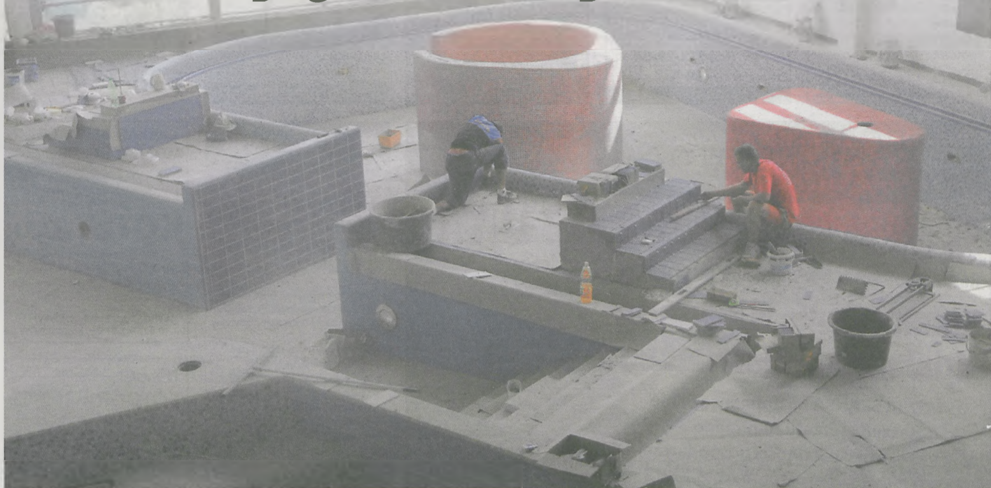
- Do końca sierpnia chcemy podwiesić sufity i ułożyć płytki - mówi Ryszard Grzebyszak. Za 1,5 miesiąca w tym miejscu mają pojawić się fontanny i bicze wodne