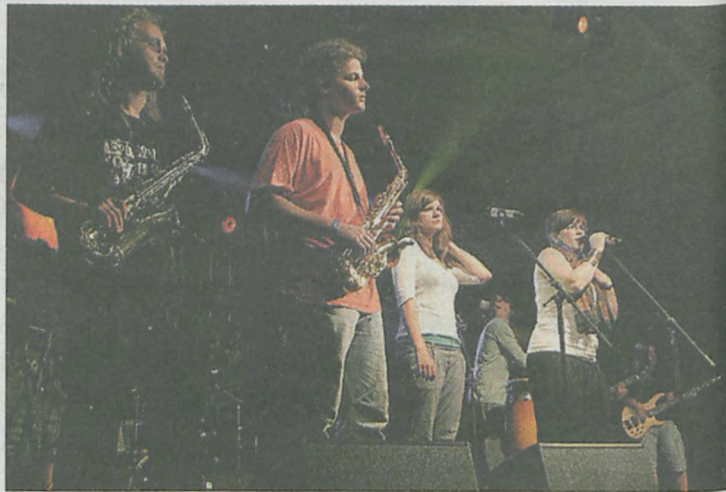
To pierwszy występ SkaNaBis na Woodstocku