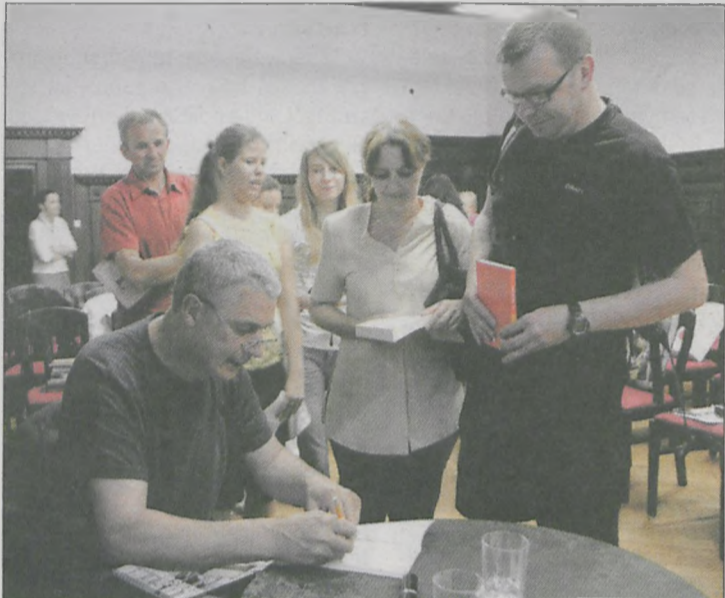
Wielu czytelników stanęło w kolejce po autografy