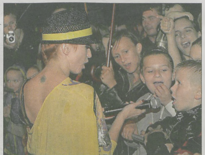
Występ wokalistki wszystkim się podobał