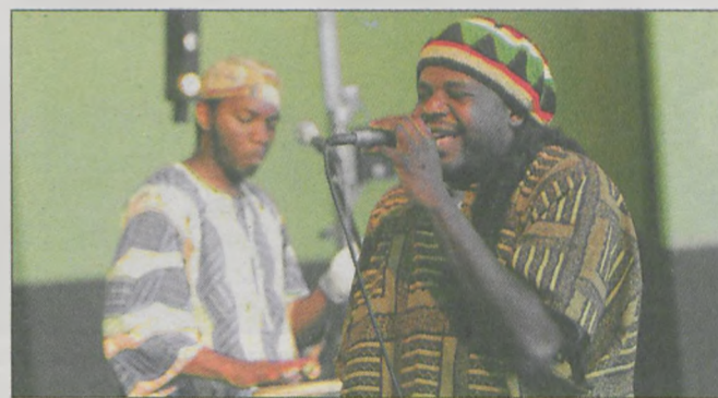
Główną gwiazdą był zespół Jumbo Afrika