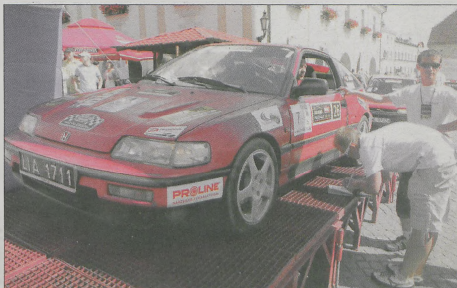
Początek i koniec rajdu odbył się na jarocińskim rynku