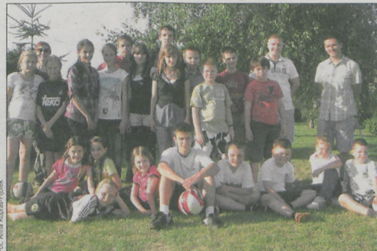
Młodzi zawodnicy po codziennych rozgrywkach korzystali z gościnności gospodarzy