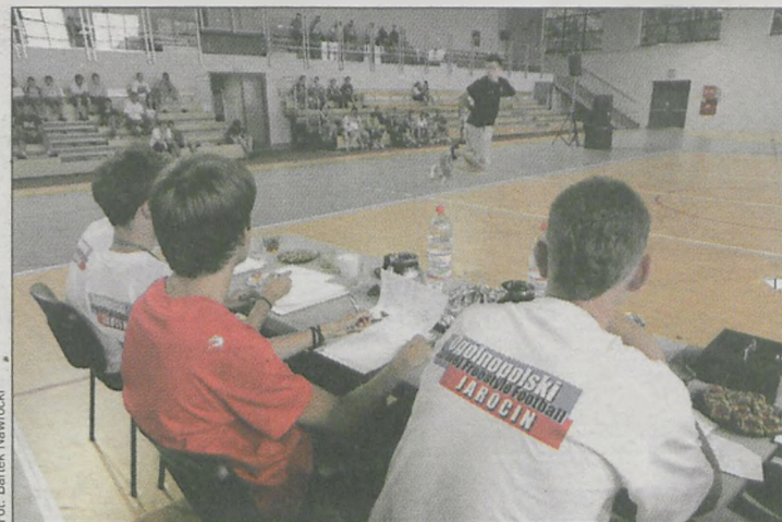
Na turnieju w Jarocinie pojawiło się ponad 60 zawodników z całego kraju