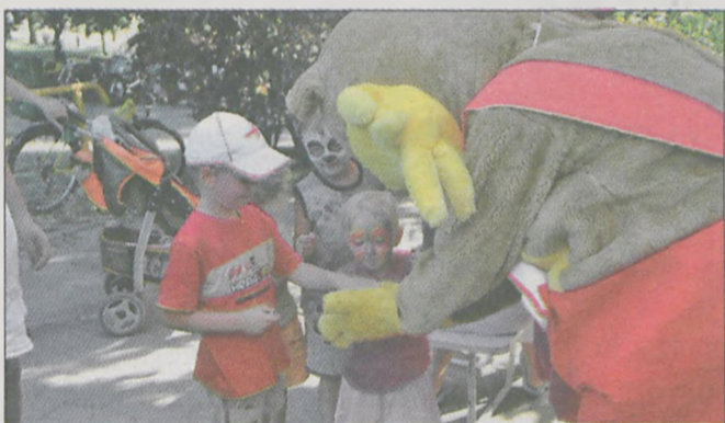
Najmłodszy z uśmiechem brał cukierki od misia...