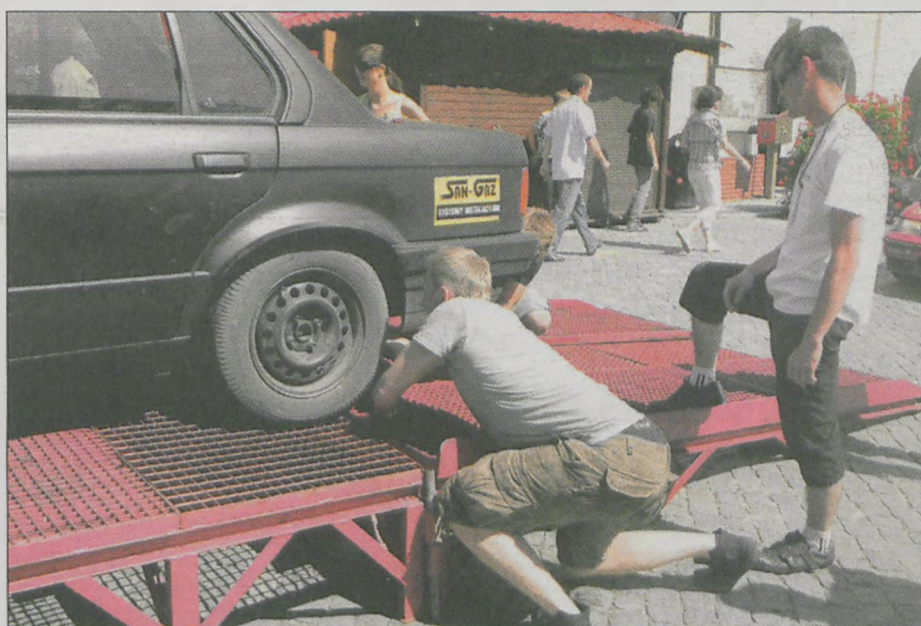
Z powodu awarii nie wszystkim udało się ukończyć wyścig