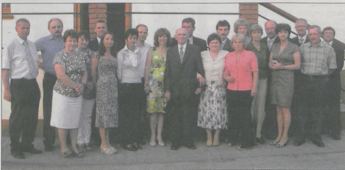
Koleżanki i koledzy z ławki po 30 latach, wraz ze swą wychowawczynią i nauczycielami

W Noskowie spotkali się uczniowie z rocznika 1972-1980.