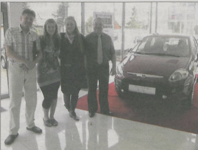
DO SALONU „FIATA” W JAROCINIE aktorka (druga z lewej) przyjechała wraz ze swym wujkiem (pierwszy z lewej) oraz kuzynką