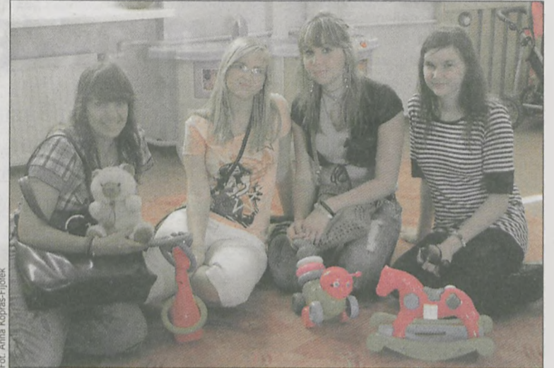
Podczas wizyty w jednym z jarocińskich przedszkoli