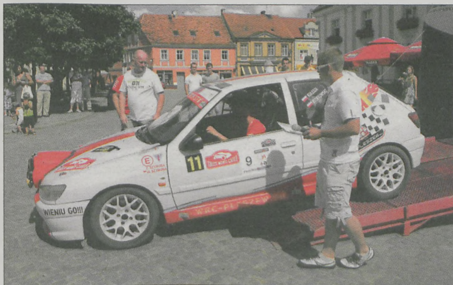
Uczestnicy rozpoczynali jazdę z rampy startowej