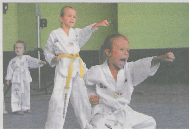
Jedną z atrakcji festynu był pokaz taekwondo w wykonaniu „Białych Tygrysów”

Bank Spółdzielczy, Spółdzielnia Mieszkaniowa Lokatorsko - Własnościowa, Okręgowa Spółdzielnia Mleczarska, Gminna Spółdzielnia „Samopomoc Chłopska”, Spółdzielnia Handlowo-Produkcyjna „Zgoda”, Spółdzielnia Inwalidów „Współpraca”, Spółdzielnia Ogrodnicza „Eurowit”, Spółdzielnia Inwalidów „Prośna”, Spółdzielnia Pracy Kominiarzy, Spółdzielczy Zakład Usługowo-Handlowy Kółek Rolniczych w Mieszku, Spółdzielnia Kółek Rolniczych w Golimie, Rolnicza Spółdzielnia Produkcyjna z Hilarowa