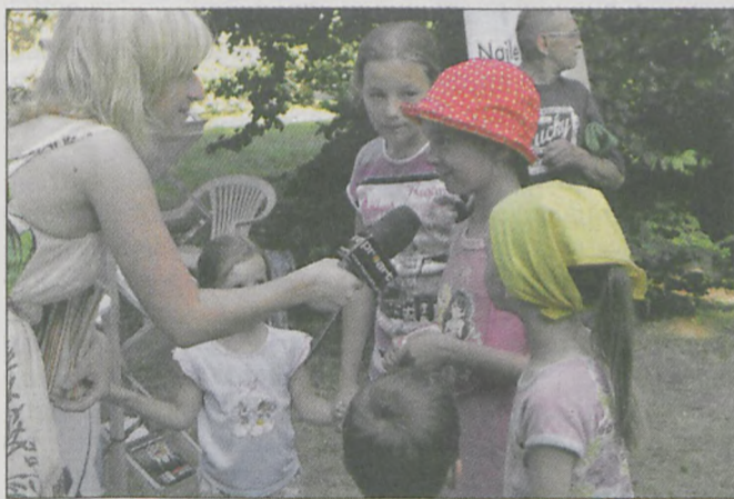
...a później nieśmiało udzielali pierwszych wywiadów dla telewizji Proart

Mniej osób niż zwykle bawiło się na Święcie Spółdzielczości. Tropikalny upał sprawił, że do jarocińskiego amfiteatru, gdzie w tym roku po raz pierwszy odbyła się ta impreza, zainteresowani festynem dotarli dopiero późnym popołudniem, gdy spadła temperatura.