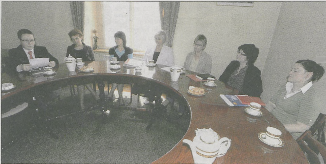
Przedstawiciele szkół zakwalifikowanych do projektu na spotkaniu z mediami

Projekt „Z małej szkoły w wielki świat” przewiduje łączenie klas np. V i VI, ale zdaniem nauczycieli, wiele zagadnień można zrealizować wspólnie. Pedagodzy od razu dodają, że takie wspólne lekcje spowodują, że dzieci będą musiały być aktywniejsze. Zajęcia roz-