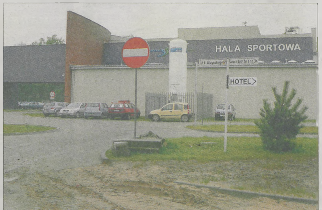
Kiedy sala zostanie oficjalnie otwarta?