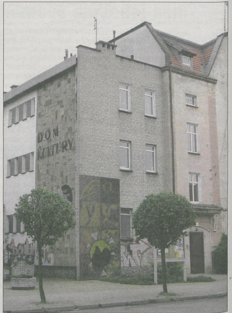
(ag) JOK ma być wyremontowany do października

Na remont budynku gmina Jarocin pozyskała 100 tys. zł z ministerstwa kultury. Samorząd stara się także o 1,4 mln zł dotacji na termomodernizację z Unii Europejskiej. Rozstrzygnięcia jeszcze nie ma. Pozostałe środki na inwestycję pochodzić będą z budżetu gminy.