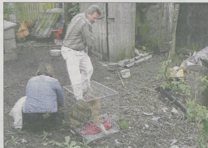
Psa, który pogryzł dzieci, zabrano z zagraconego podwórza