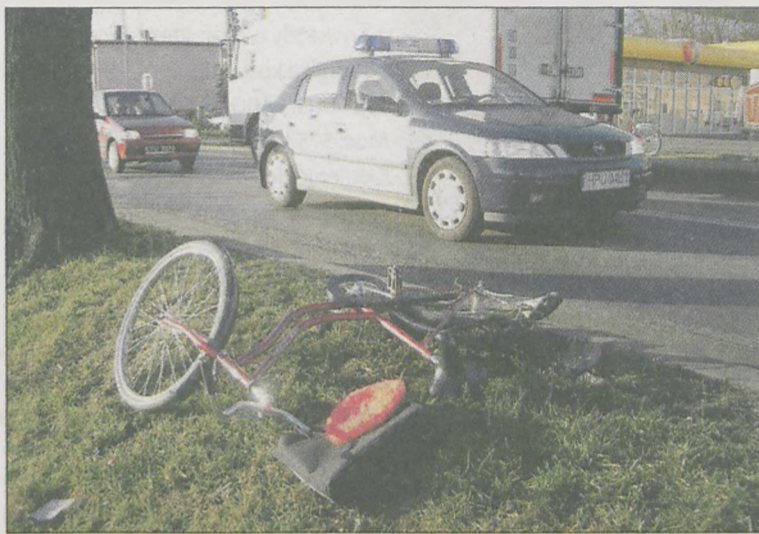
Spotkanie rowerzysty z samochodem zwykle kończy się tragicznie

la. Nieprzypadkowo do większości potrażeń dochodzi wieczorem lub w nocy. Zwykle poza obszarem zabudowanym, gdzie nie ma lamp. Wina w większości wypadków leży po środku, ze wskazaniem na cykli-