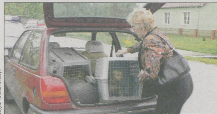
Trzy kundły z Cerekwicy Starej trafiły do schroniska w Radlinie

Trzy psy odebrano 47-letniej mieszkance Cerekwicy Starej (gm. Jaraczewo). Kobieta pozbawiona prawa do opieki nad zwierzętami, po tym jak jeden z jej czworonogów pogryzł dwójkę dzieci sąsiadów.