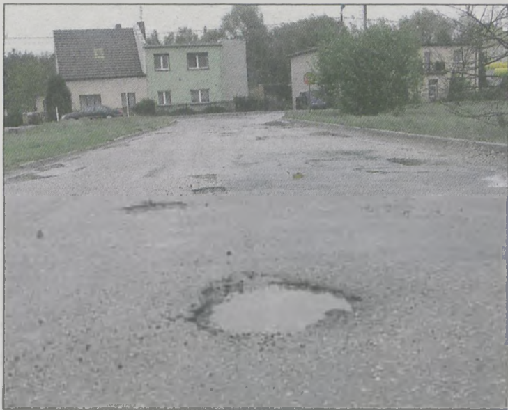
Ulica Zagonowa od skrzyżowania z Wrocławską