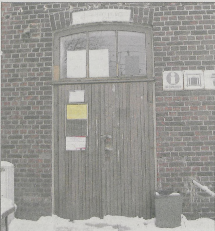
Poczekalnia dworca PKP w Witaszycach jest zamknięta na kłódkę

W redakcji „Gazety Jarocińskiej” interweniował mieszkaniec Witaszyc. Nasz czytelnik jest zbulwersowany zamknięciem na kłódkę poczekalni dworca PKP w wiosce. - Dworzec zamknęli na kłódkę, z drugiej strony budynek zajęły pielęgniarki, a podróżnych wygnali na perony. To skandal, żeby w XXI wieku młodzież dojeżdżająca do szkół stała na mrozie. Nie wymagamy, żeby ten budynek był ogrzewany, ale chodzi o jakieś zadaszenie. Całą zimę nasze dzieci, wnuki stoją na dworze i nikt się tym nie interesuje. Najlepiej na drzwiach powiesić kłódkę i nie przejmować się podróżnymi. Zastanawiam się, co w tej sprawie zrobią radni - pytał zbulwersowany mężczyzna.