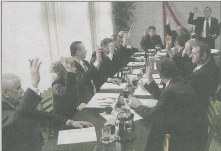
Kotlińscy radni - choć mieli różne zdania na temat niektórych zadań wprowadzonych do budżetu - ostatecznie jednogłośnie przyjęli uchwałę budżetową