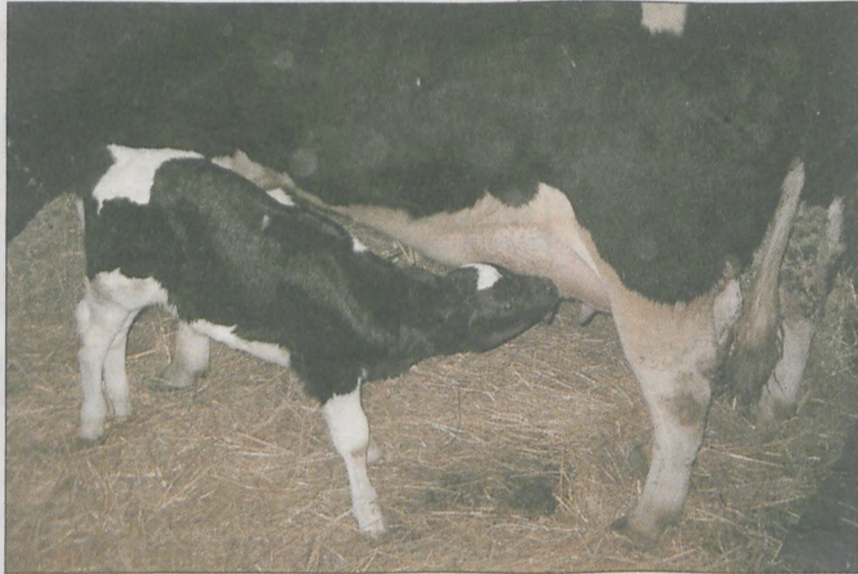
Zdarzenia związane z bydłem można zgłaszać przez internet