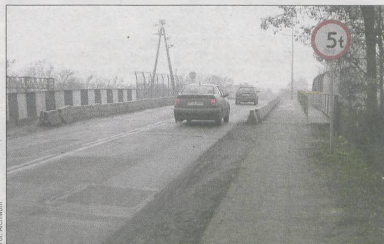
Wiadukty kolejowe przy ul. Powstańców Wlkp. czekają na przebudowę jeszcze co najmniej do 2012 roku