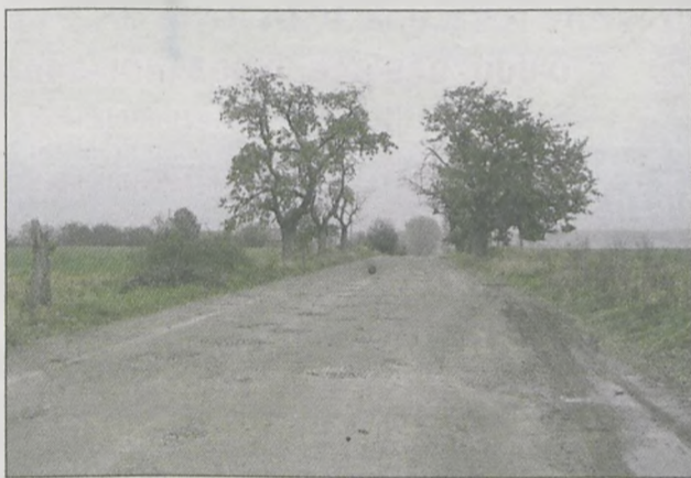
Wiosną ma ruszyć budowa drogi Jaraczewo - Chwałkowo Kościelne

964.750 zł planuje wydać w tym roku gmina Jaraczewo na inwestycje drogowe.