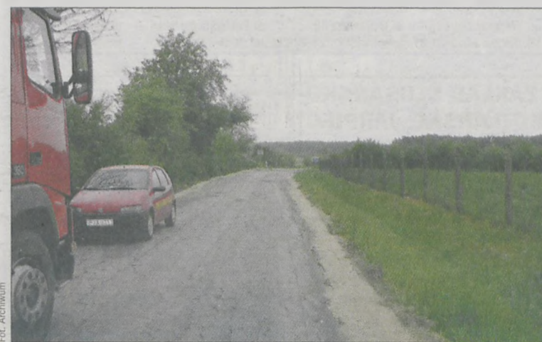
Powiat jarociński planuje przebudowę drogi Kotlin - Sławoszew, która będzie kosztowała ponad 4 mln zł