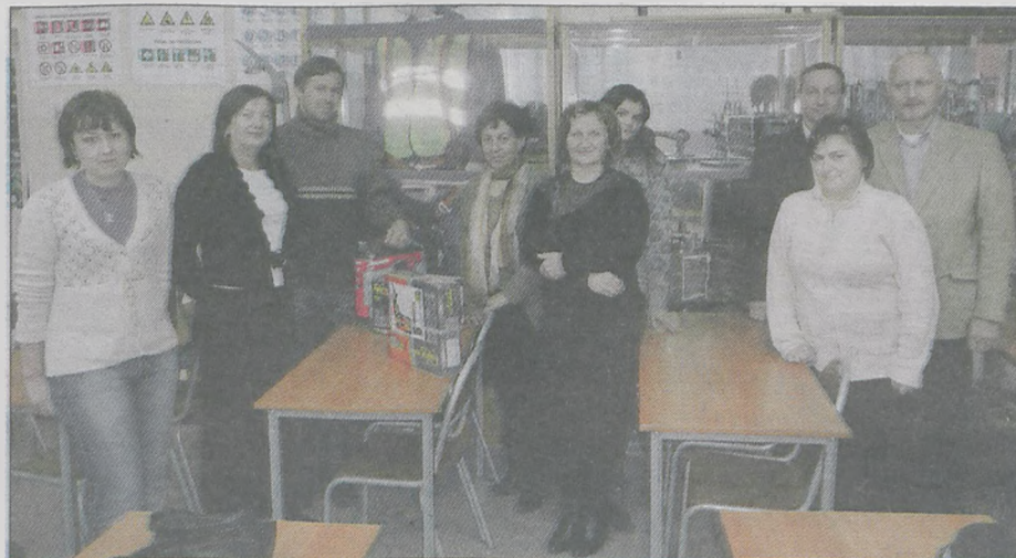
W szkole w Tarcach zorganizowano szkolenie BHP dla uczniów i ich rodziców. Dodatkowo rodzice wzięli udział w konkursie na temat bezpieczeństwa i higieny pracy

Sześćdziesięciu uczniów technikum architektury krajoznawstwa i agrobiznesu Zespołu Szkół Przyrodniczo-Biznesowych w Tarcach oraz ich rodzice przeszli szkolenie BHP. - Nie ma bardziej optymalnej inwestycji w ludzi jak bezpieczeństwo i higiena pracy. Stąd nasza determinacja dotycząca kształcenia