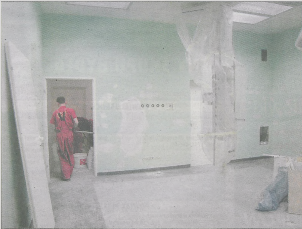
Trwają prace adaptacyjne i montowanie nowych urządzeń i aparatury medycznej na bloku operacyjnym i centralnej sterylizatorni w jarocińskim szpitalu

W jarocińskim szpitalu trwa montaż wyposażenia nowego bloku operacyjnego i centralnej sterylizatorni. Nowoczesny sprzęt medyczny o wartości 3 mln 600 tys. zł trafił do naszej lecznicy dzięki pozyskanemu dofinansowaniu z Europejskiego Funduszu Rozwoju Regionalnego w wysokości 2 mln 718 tys. zł. Na liście zakupionych urządzeń jest ponad 100 pozycji, między innymi wysokiej klasy kolumny anestezyjologiczne, stoły operacyjne i instrumentarium chirurgiczne. Część wyposażenia szpital musiał nabyć z własnych funduszy. - Są to przede wszystkim meble i inne przedmioty, których nie obejmował unijny projekt. Poza tym