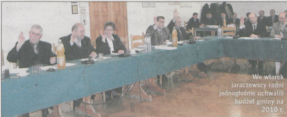
We wtorek jaraczewscy radni jednogłośnie uchwaliли budżet gminy na 2010 r.

W plac budowy ma się zamienić gmina Jaraczewo - taki obraz wyłania się z budżetu na 2010 rok. Samorząd wyda ponad 7,5 mln zł na kanalizację, drogi i rozbudowę świetlic wiejskich. Boom inwestycyjny oznacza jednak zadłużenie gminy.