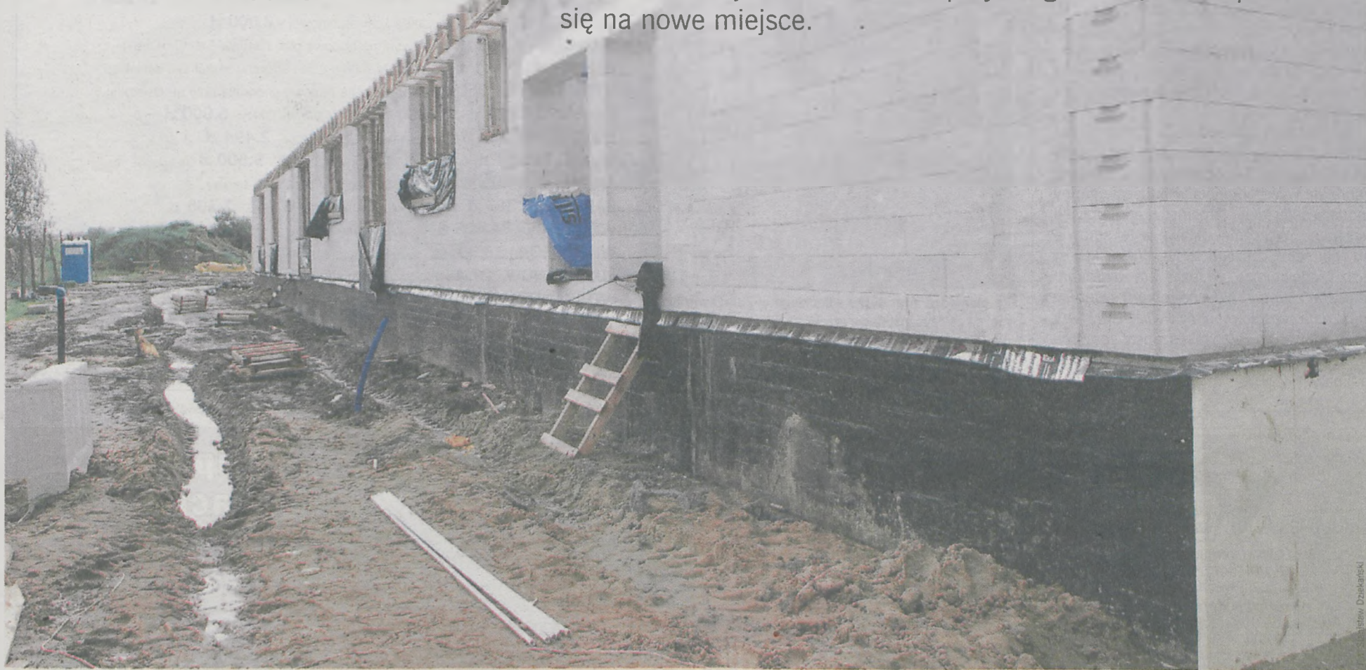
Trwają prace przy budowie nowej siedziby przychodni specjalistycznej Medicus