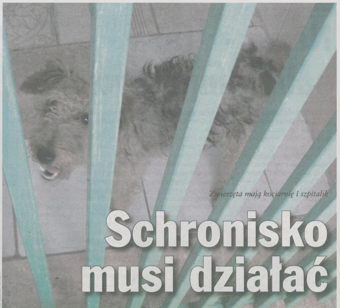
Zwierzęta mają kociarnię i szpitalik

(śmiej). Nie chciałbym tego tak uściślać.