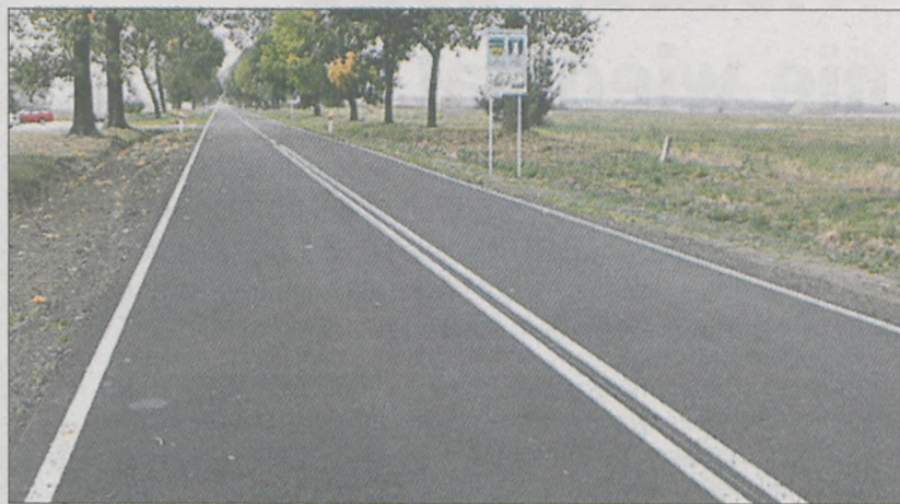
Pierwszy etap przebudowy drogi Klęka - Żerków jest już zakończony. Powiat jarociński zapowiada złożenie wniosku o dofinansowanie drugiego odcinka tej drogi

Powiat jarociński złożył dwa wnioski o dofinansowanie przebudowy dróg powiatowych w ramach „Narodowego Programu Przebudowy Dróg Lokalnych 2008 - 2011” wicepremiera Grzegorza Schetyny. Dotyczą one przebudowy ul. Wybudowanej w Jarocinie oraz drugiego etapu drogi powiatowej Klęka - Żerków. Rządowy program zakłada dofinansowanie z budżetu państwa 50 % kosztów realizacji inwestycji drogowych.