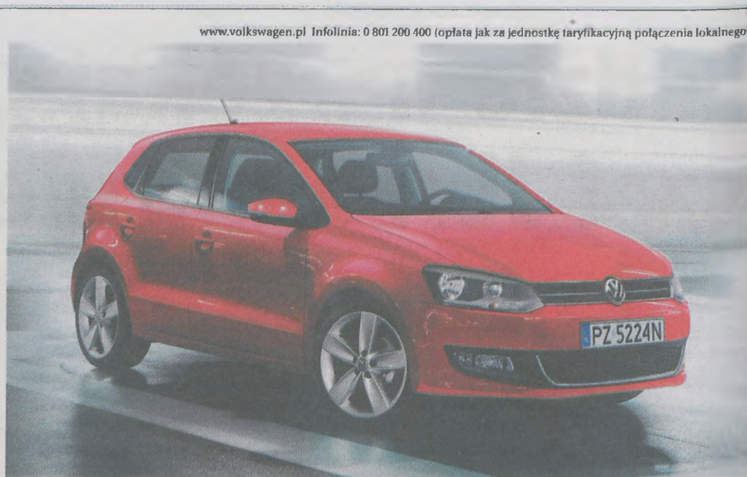
www.volkswagen.pl Infolinia: 0 801 200 400 (opłata jak za jednostkę taryfikacyjną połączenia lokalnego)