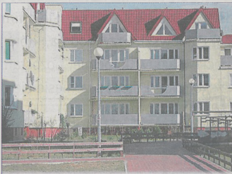
Niższy wskaźnik przeliczeniowy w wielkopolskiej mieszkaniówce