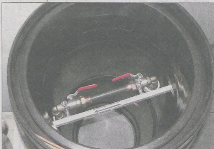
Tego typu studzienki wodomierzowe PWiK montuje przy wymianie sieci wodociągowej

W redakcji interweniowali mieszkańcy Jarocina, u których PWiK instalował wodomierze w studzienkach. - Umieszczane są w takich plastikowych obudowach w ziemi na głębokości około pół metra. Czy w czasie zimy wodomierze nie zamrzną? - pyta jarocinianka. - Urządzenie pomiarowe powinno być chyba lepiej zabezpieczone - dodaje inna osoba.