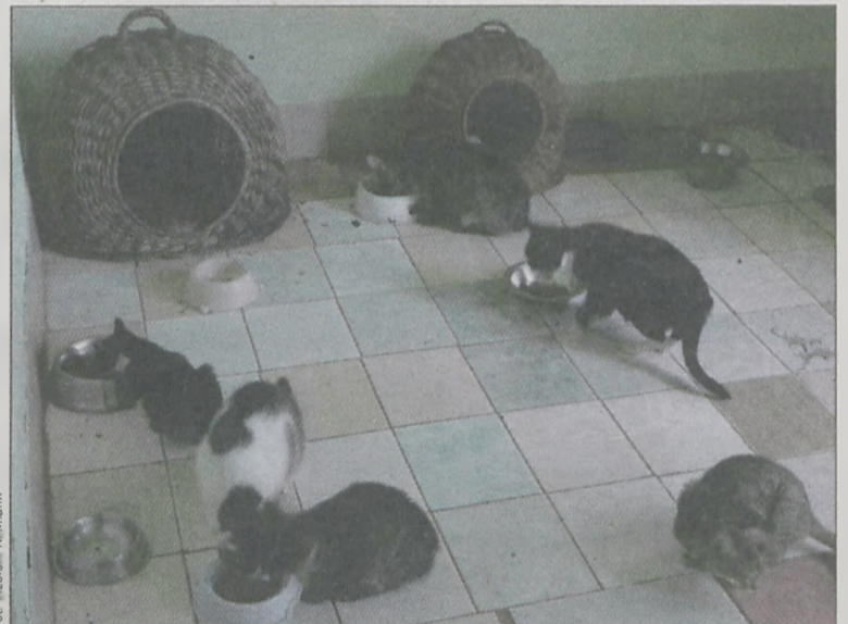
Dzięki sponsorom i pozyskanym środkom z zarządu głównego stworzono kociarnię