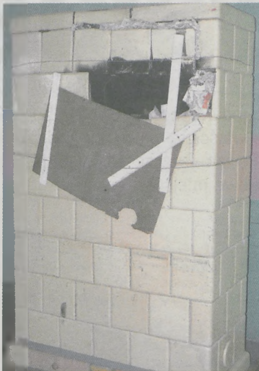
Za pieniądze z funduszu sołeckiego w Zakrzewie będzie można założyć instalację grzewczą w sali wiejskiej. Obecnie „straszny” tam nie nadający się do użytku piec kaflowy. O jego remont, jak przypomina radny miejski Ryszard Kłodziej, mieszkańcy nie mogli doprosić się przez 3 lata