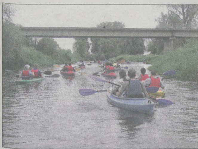
Prosną i Wartą przepłynęliśmy łącznie około 17 km