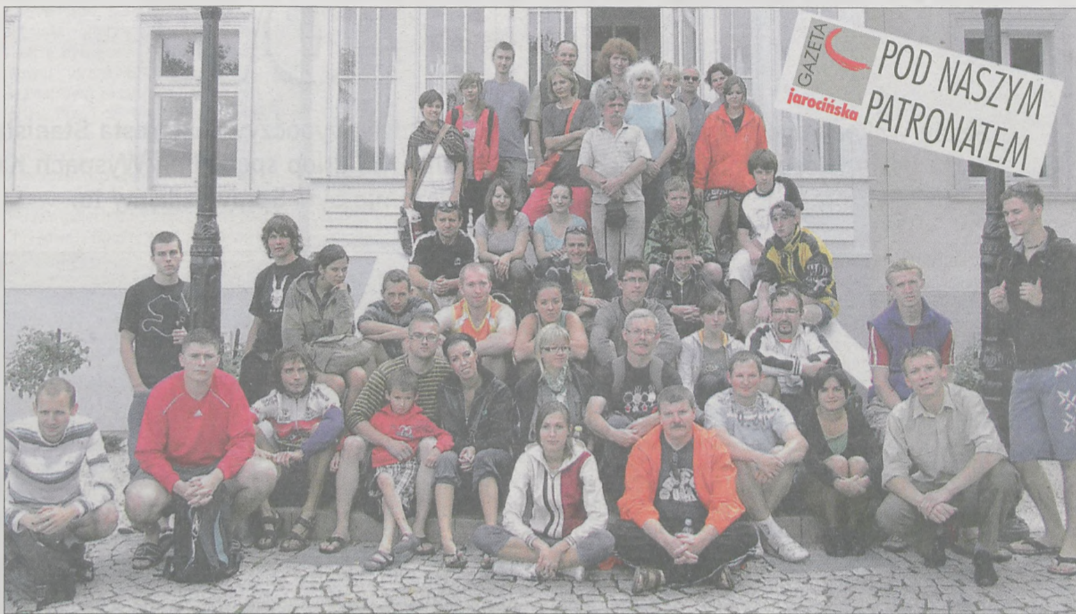
W spływie kończącym tegoroczne „Letnie wędrówki z Gazetą” wzięło udział 48 osób