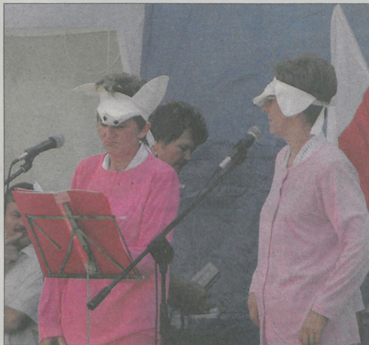
Członkinie zespołu „Chrzanianki”, przebrane za świnki, rozbawiły publiczność swoim występem

Tegoroczne dożynki gmina Żerków świętowała w dwóch częściach. Najpierw, o 10.00 rano, odbyła się uroczysta msza święta w kaplicy w Chrzanie. Część obrzędowa rozpoczęła się o godzinie 13.30, korowodem maszyn rolniczych, specjalnie przyozdobionych na tę okazję. Następnie odbyło się tradycyjne przekazanie chleba przez starostów dożynkowych oraz prezentacja wieńców. W części artystycznej organizatorzy postawili przede wszystkim na dobry humor. Wystąpił m.in. zespół „Chrzanianki”, bawiąc gości oraz zgromadzonych mieszkańców dowcipami i występami kabaretowymi. W czasie występów uruczono przybyłych pysznym plackiem, a na amatorów losowań czekała loteria fantowa. Po występach odbyła się zabawa taneczna, do której przygrywał zespół „Reset”.