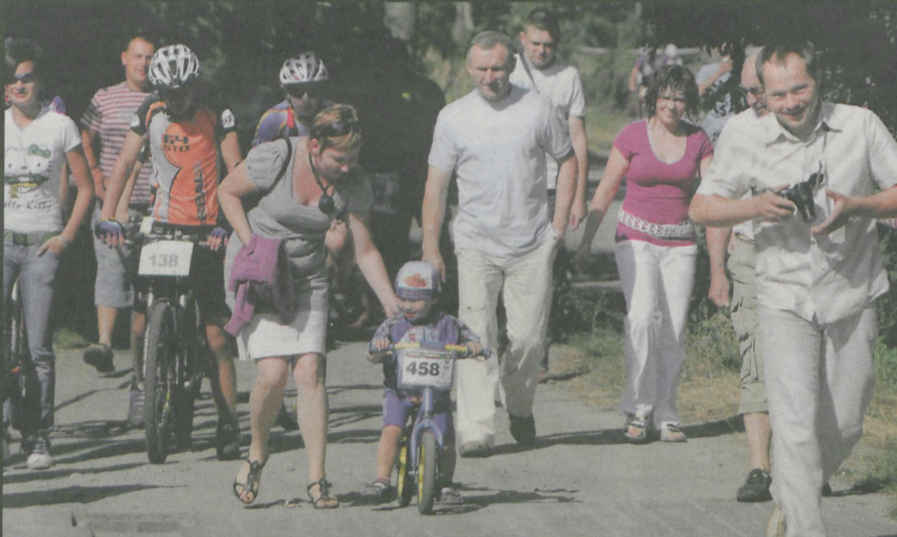
Rower dla każdego i w każdym wieku - zawody MTB w Jarocinie.