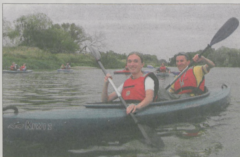
„Jestem zachwycony!” - napisał na portalu jarocinska.pl jeden z uczestników spływu