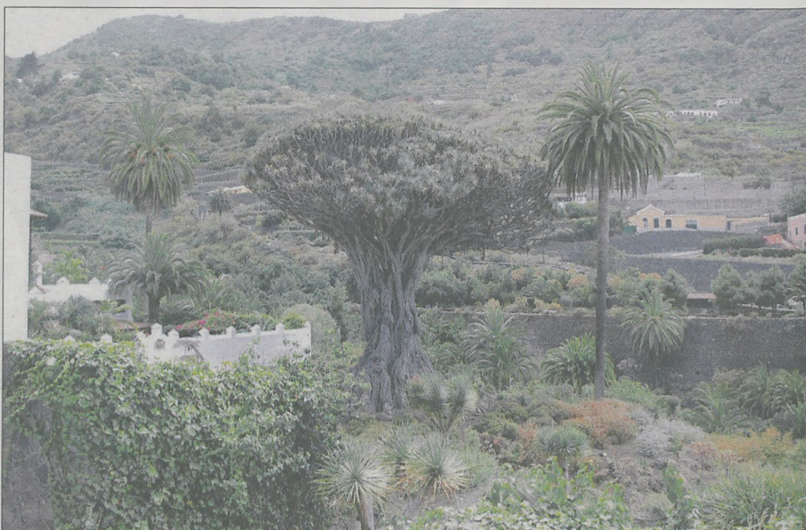
Drago Milenario - wiekowy okaz draceny właściwej, czyli drzewa smoczego z Icod de los Vinos