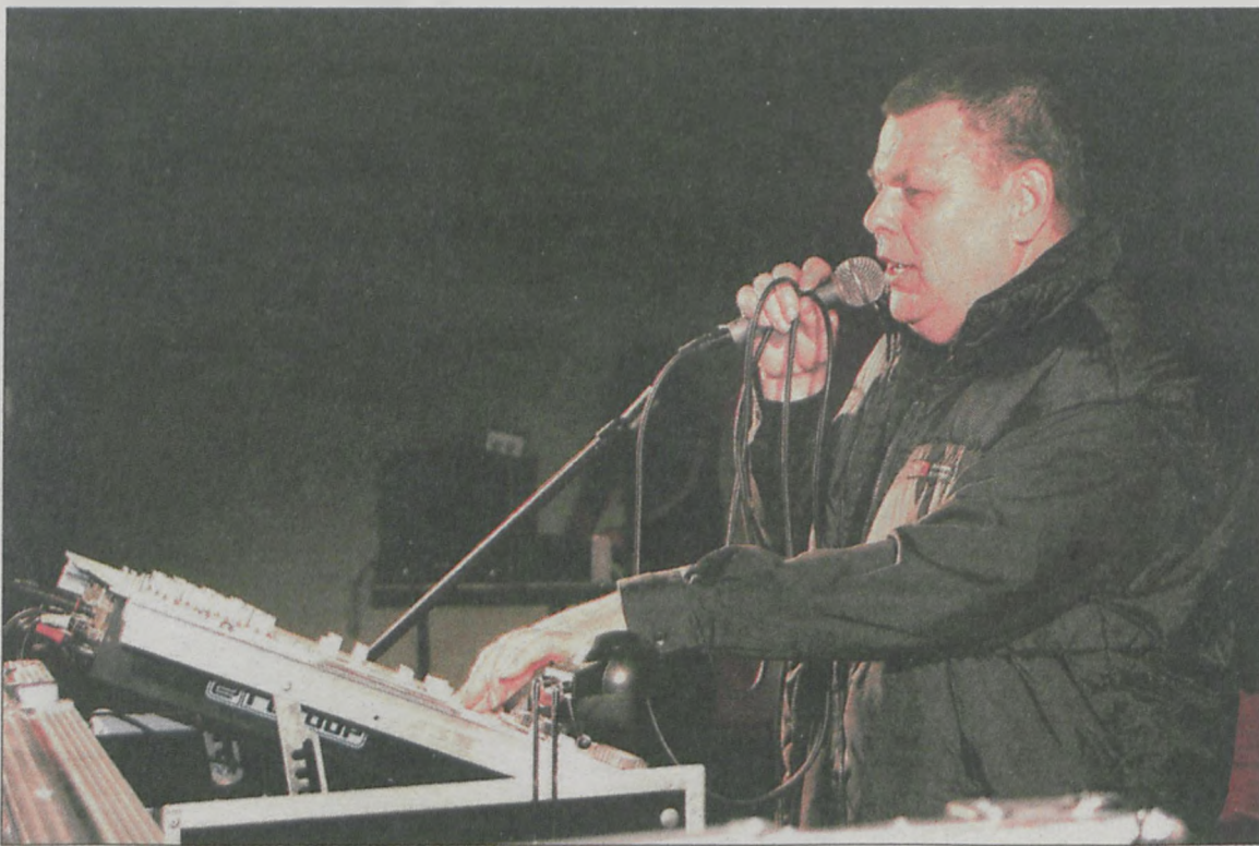
Dj Orkiestra w swoim żywiole