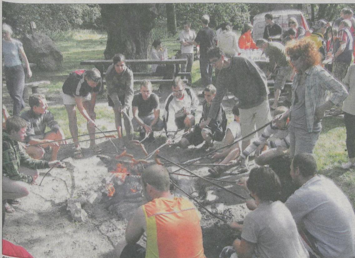
Sił do dalszej drogi uczestnicy spływu nabierali w Czeszewie przy ognisku