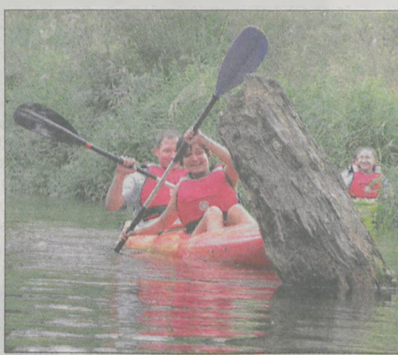
Początkowo niektórzy mieli problem z opanowaniem kajaka